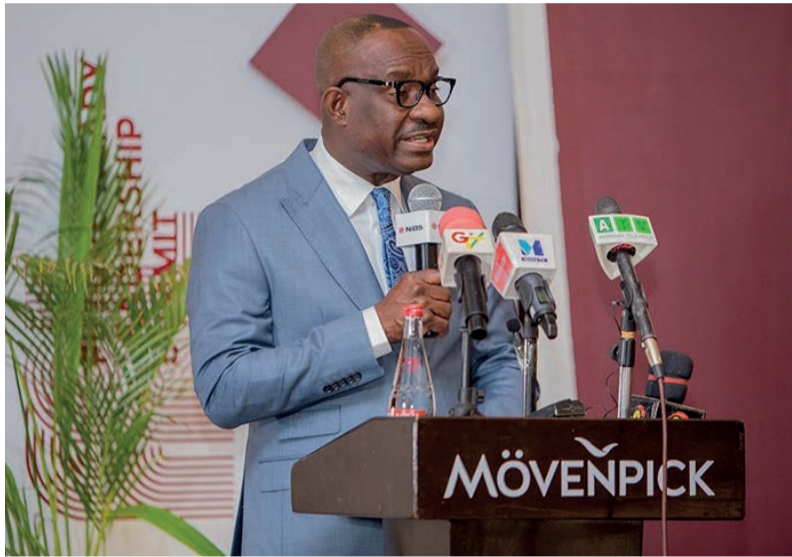
Selon le Président de la BIDC, ces perturbations ont entraîné des conséquences économiques majeures, notamment des perturbations de la chaîne d'approvisionnement et une inflation croissante, nécessitant une adaptation rapide et efficace de la part des entreprises.