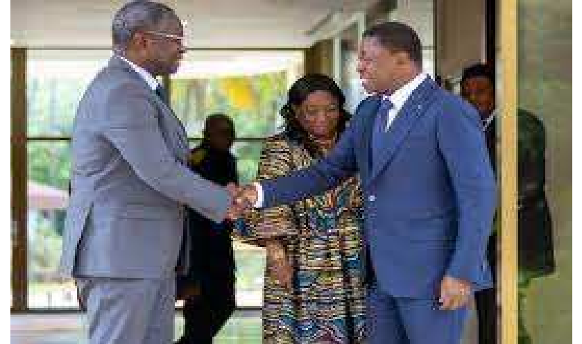
Poignée de mains entre les deux personnalités

Institution régionale regroupant le Bénin, le Burkina Faso, la Côte d'Ivoire, la Guinée-Bissau, le Mali, le Niger, le Sénégal et le Togo, l'Union économique monétaire ouest africaine (UEMOA) a pour objectif, l'édification en Afrique de l'ouest d'un espace économique harmonisé. Le président de la commission de l'Union a été reçu par le chef de l'Etat Faure Gnassingbé. Le point de la situation économique de l'Institution est à l'ordre du jour.