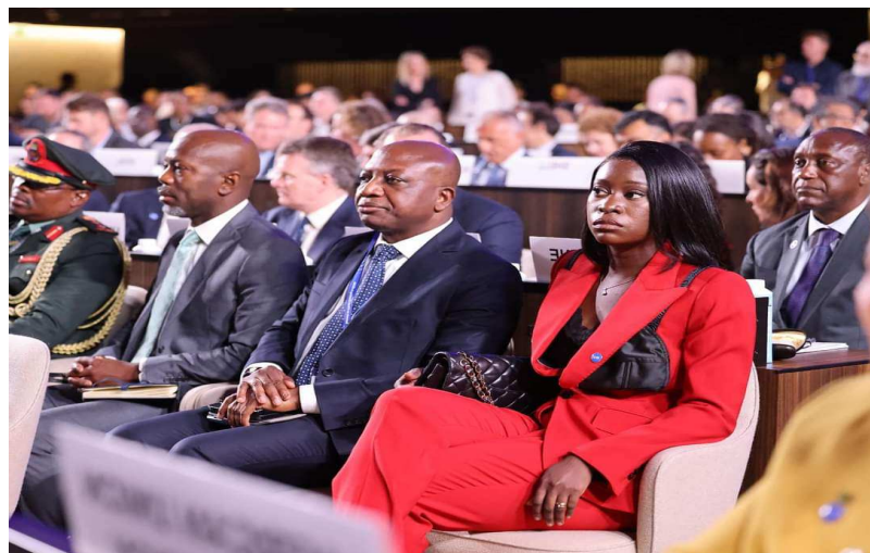
Une vue de l'assistance

part belle aux énergies renouvelables et réduire de façon conséquente les effets de gaz à effet de serre sur la vie humaine.