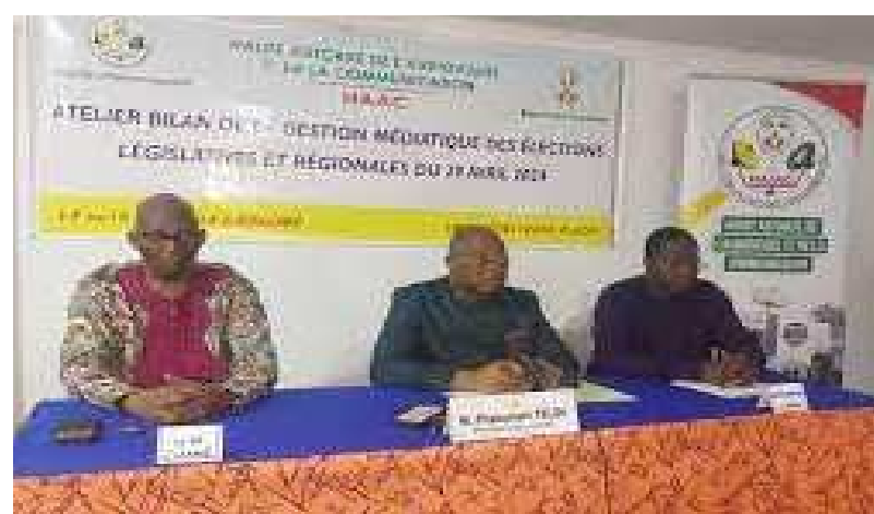
Les officiels lors de la rencontre

Après ce double scrutin capital, les acteurs de l'institution se retrouvent du 14 au 16 mai dans le cadre d'un atelier à Kpalimé où ils se prêtent