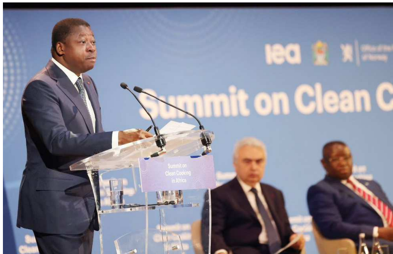
Le Président Faure Gnassingbé lors de son allocution

Le Président de la République, Son Excellence Faure Essozimna Gnassingbé participe ce 14 mai 2024 au siège de l'UNESCO à Paris en France, à un sommet de haut niveau sur la cuisson propre en Afrique, à l'initiative du groupe de la Banque africaine de développement et l'Agence internationale de l'énergie.