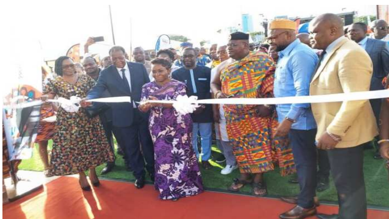
Coupure du ruban symbolique

Afin de valoriser les richesses, le savoir-faire et les saveurs africaines, le Festival internationale la marmite (Fesma) revient en force pour sa 3 e édition qui se tiendra du 15 au 20 mai 2024 sur l'esplanade du Palais des Congrès de Lomé.