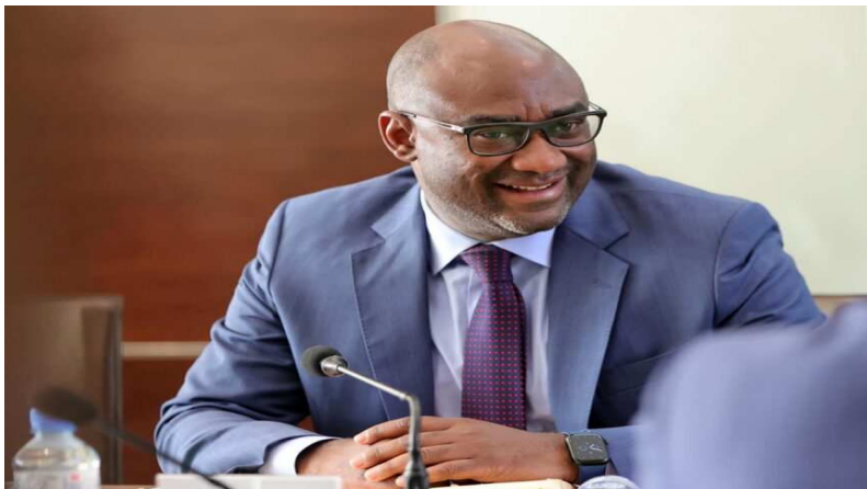
Le ministre Dodzi Kokoroko

A l'heure des réseaux sociaux, où un cliché produit toute suite peut se retrouver à la minute à l'échelle internationale, parfois à des fins compromettantes, les premiers responsables de l'éducation togolaise décident de prendre leurs responsabilités.