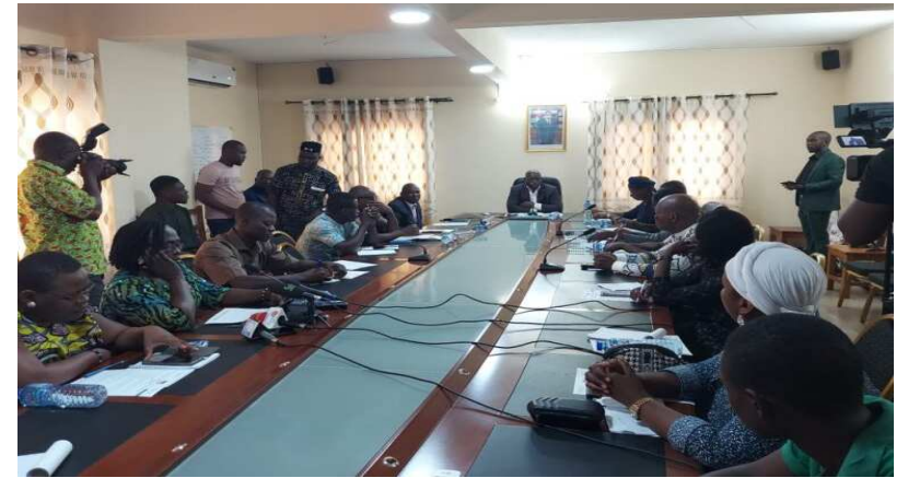
Une vue de l'assistance lors de la rencontre

Face à ces prévisions, des avis et conseils sont prodigués aux agriculteurs et aux habitants des régions concernées : " Il est recommandé de semer dès les premières pluies utiles, en privilégiant les variétés de cultures à cycles courts et tolérantes au déficit hydrique. De