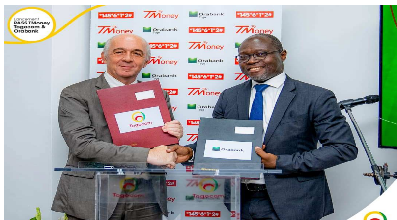
Echange de documents après la signature du partenariat

En effet, le partenariat vise à faciliter les transactions financières entre les clients communs aux deux institutions. A TOGOCOM, on affirme que ce nouveau service, résultat de la convergence des services de la banque numérique et du Mobile Money, est une innovation majeure qui crée des opportunités