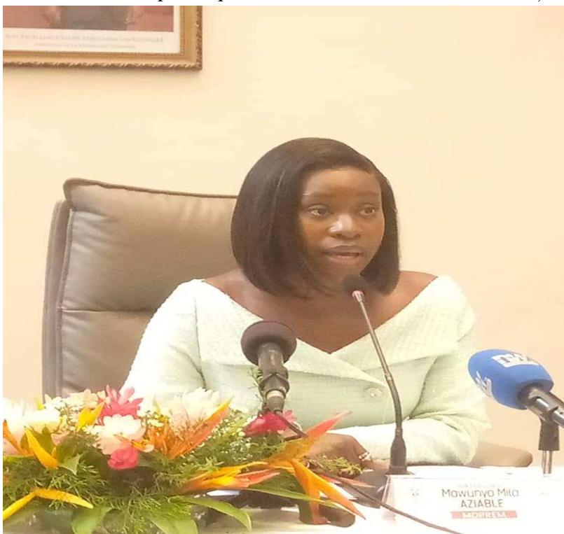
La ministre Mila Aziablé

En matière d'accès à l'électricité des populations, le Togo a fait des progrès remarquables avec sa capacité de production nationale qui a considérablement augmenté pour atteindre désormais 60% des besoins en électricité contre seulement 10% en 2006. Il faut poursuivre la cadence et accélérer la mise en œuvre du plan de renforcement de la souveraineté énergétique du pays. Selon les autorités, dans l'immédiat, plusieurs mesures sont actuellement mises en œuvre pour : diversifier les sources de combustibles des centrales, accroître la production d'électricité nationale et, optimiser la consommation d'électricité. Il est indiqué que Faure GNASSINGBE, reste fermement engagé à garantir l'accès universel à une électricité fiable et de qualité d'ici 2030 et à réduire la dépendance énergétique du Togo. " La situation actuelle ne fait que renforcer cette détermination inébranlable pour atteindre ces objectifs. Nous tenons encore une fois à rassurer nos concitoyens que notre dévouement pour surmonter cette passe difficile est inébranlable. Nous sommes totalement mobilisés et faisons tout ce qui est en notre pouvoir pour résoudre rapidement et de manière durable cette crise énergétique ", a lancé l'autorité chargée du secteur de l'énergie au Togo. Dont acte.