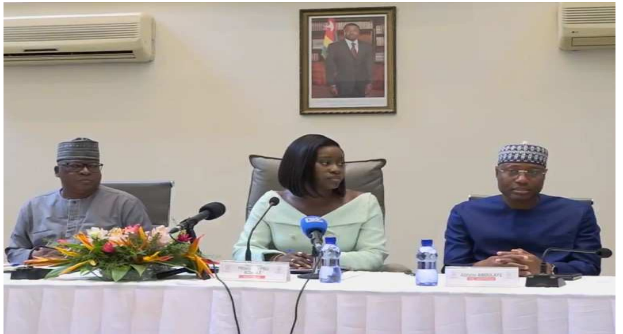
Les officiels lors de la conférence de presse...Au milieu, la ministre Mila Aziablé

Vous savez, cette situation est due à une série d'événements, de