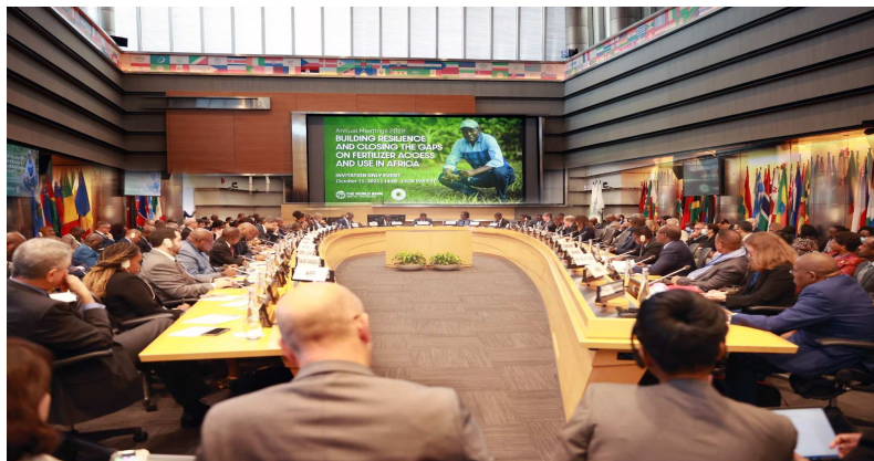
Une vue de la séance de travail

Il est structuré autour de trois objectifs de haut niveau, notamment la création d'emplois de qualité par le secteur privé, l'amélioration du capital humain,