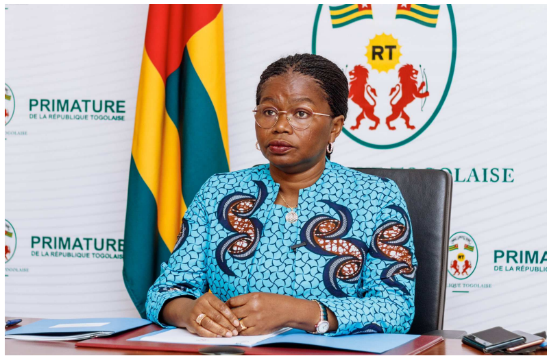
La PM Victoire Tomégah-Dogbé

Exploitant donc ces trois axes à dessein, le but recherché était, non seulement d'intoxiquer l'opinion, mais surtout de la faire réagir ; de susciter des mouvements et actions de mécontentement dans le pays pour en profiter pour semer un bor-