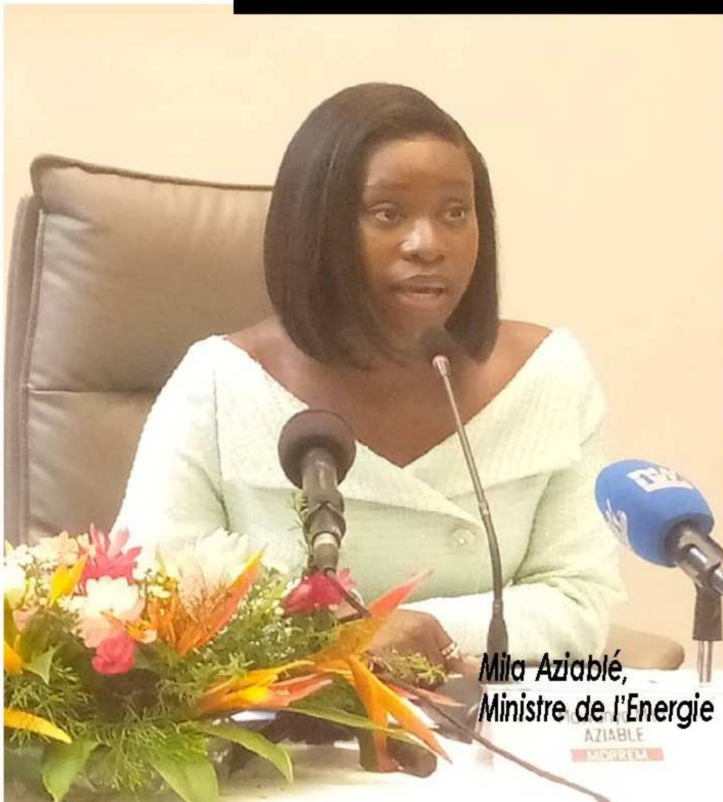
Mila Aziablé, Ministre de l'Energie