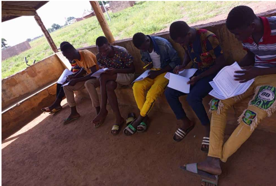
Photo 1 : Enquête individuelle en cours dans le canton de Takpamba

Les entretiens individuels ont concerné la population en général de la tranche d'âge de 15 à 60 ans. Dans l'ensemble, l'enquête a concernée 242 individus et 26 leaders d'opinion soit au total 268 questionnaires ont été renseignés. La figure suivante montre des enquêtes individuelles en cours dans le canton de Takpamba. Au total, 9 enquêteurs ont été recrutés à raison de trois (03) par cantons.