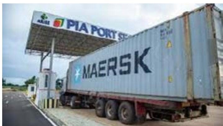
Port sec de la Plateforme industrielle d'Adétikopé

Pôle d'attraction et d'échanges commerciaux des conteneurs en transit vers le sahel, le port sec d'Adétikopé est un relai stratégique du Port de Lomé. Dans une publication sur le réseau X, le mercredi 12 juin 2024, le ministre de l'Économie maritime, Edem Tengué, a annoncé la reprise du transfert des conteneurs en transit du Port de Lomé vers le port sec de la Plateforme Industrielle d'Adétikopé (PIA).