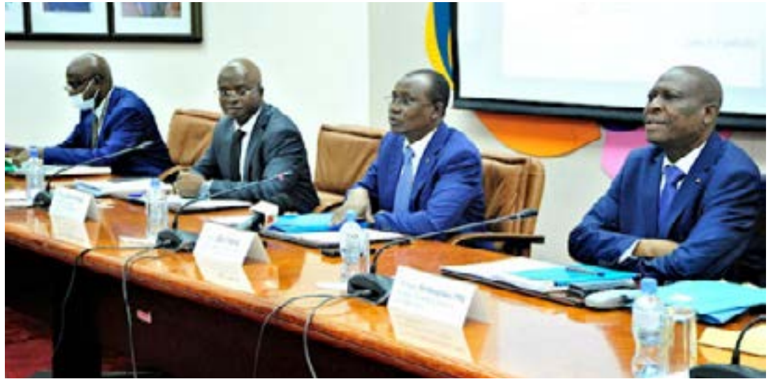
Rencontre du Cadre permanent de concertation entre gouvernement et secteur privé (Image d'archives)

En évoquant « une reprise timide et coûteuse » des économies d'Afrique subsaharienne, notamment togolaise, 4 années turbulentes, marquées par différentes crises, notamment le coronavirus