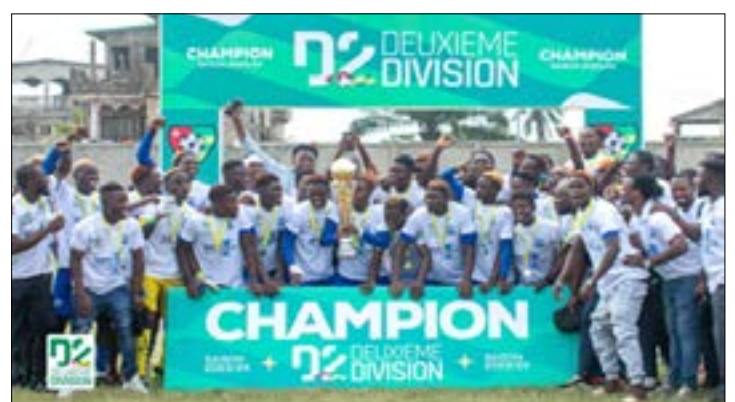
CDF Haknour célèbre son titre