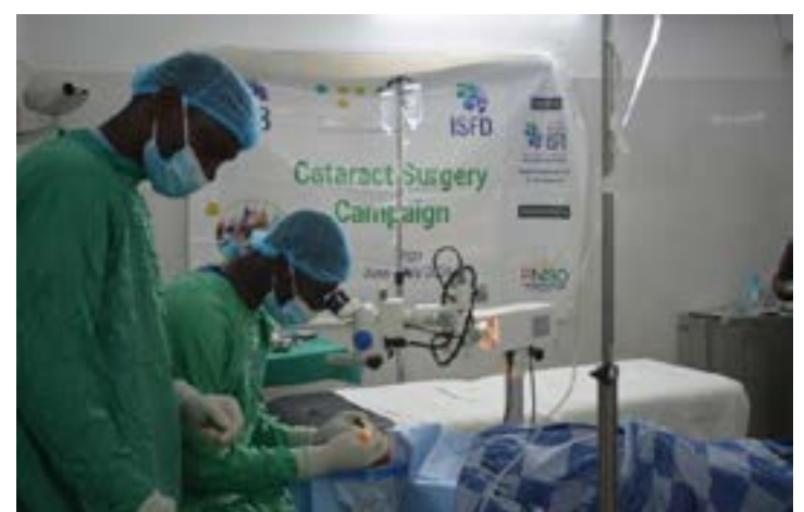
Une équipe de médecins en pleine opération

de 50 ans et plus sont déficients visuels et que la cataracte représente 60% des causes (ARCE Togo, 2014). Cette étude a également montré que 84% des causes des déficiences visuelles au Togo sont curables et que près de 200 mille yeux avec cataracte non opérés