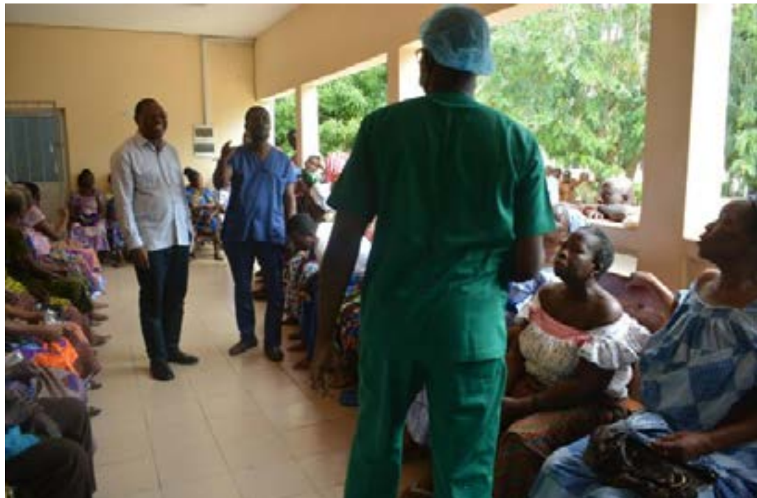
Le SG du ministère de la Santé, Dr WOTOBÉ Kokou, à gauche

Pour contribuer à l'amélioration de la santé oculaire des populations les plus défavorisées, l'Etat togolais, en collaboration avec le PNSO, ont poursuivi des opérations dans la région Maritime, après celles qui ont profité aux populations de la région des Savanes. Les opérations se sont déroulées notamment du 10 au 12 juin dans le CHR de Tsevié et dans le CHP de Vogan, puis du 13 au 14 dans les CHP d'Aneho et d'Afagna.