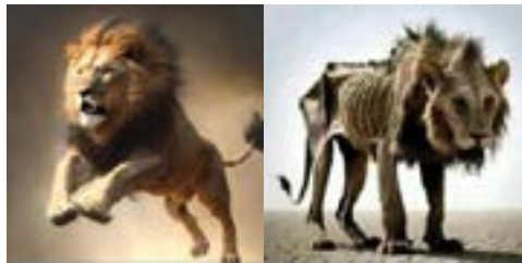
La Force, la Puissance et le Pouvoir sont circonscrits dans le temps et dans l'espace. Soyons toujours humbles!

Aucun d'entre eux ne sait que je le trompe et voilà que je me retrouve surprise par cette présentation nocturne. Le 4eme est celui qui m'a présenté son ami en premier et voilà que le premier aussi me présente le même ami. Je suis perdu Aidez moi. Et si l'ami parle je fais comment ? En passant, l'ami en question est revenu de France et je crois que je suis amoureuse de lui aussi. Aidez moi svp