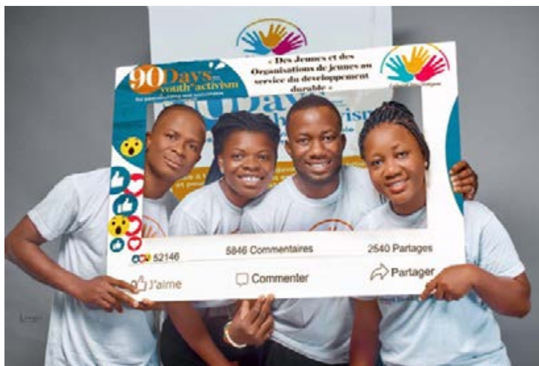
Jeunesse et emploi

Et déjà, les actions suivent les vœux. C'est l'exemple de la maison des jeunes de Niamtougou qui est en cours de construction, dans le cadre du Programme de soutien aux microprojets d'infrastructures communautaires (Psmico) pour un budget de plus de 70 millions de francs. Diverses initiatives