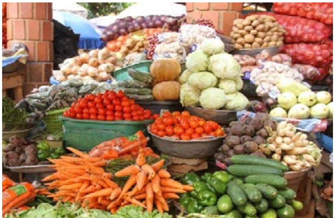
Un marché de légume

En glissement trimestriel, en comparant la situation à février 2024, le niveau général des prix en