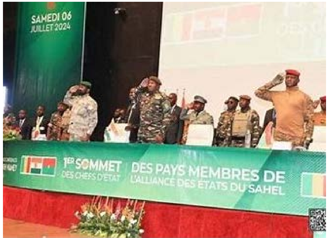
Les présidents des Etats de l'AES

juillet 2024 conformément au calendrier habituel pour aborder les sujets brûlants de l'heure comme la sécurité régionale, la situation économique, et la gestion des pays dirigés par des juntes militaires. L'organisation, qui fêtera