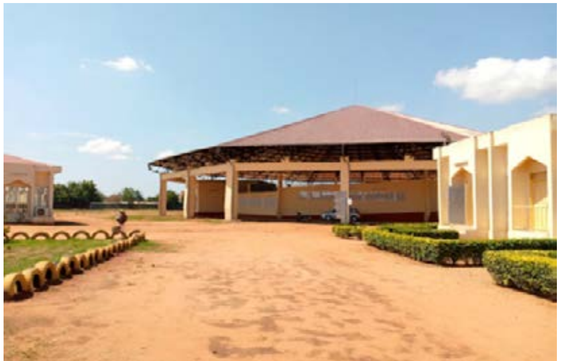
Aperçu maison des jeunes Amadahomé

mobilisés dont 394 parmi eux embauchés par la suite. Tout citoyen de nationalité togolaise,