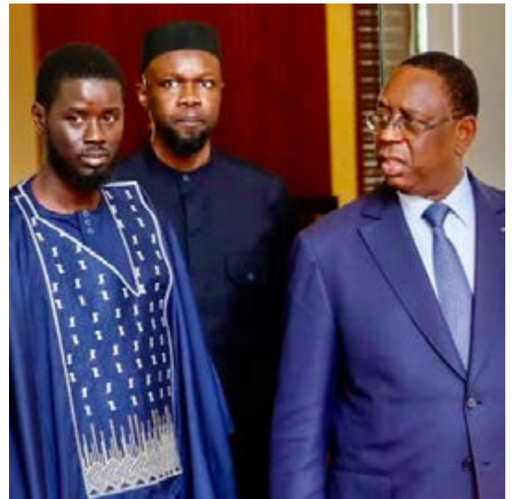
Diomaye Faye, Ousman Sonko et Macky Sall

« Nous sommes en train de travailler pour arranger les choses », affirme Abdou Mbow, président du groupe Benno Bokk Yakaar, la coalition de l'ancien président Macky Sall, majoritaire au Parlement. Il ajoute fermement : « Ce n'est pas au président de la République de dicter à