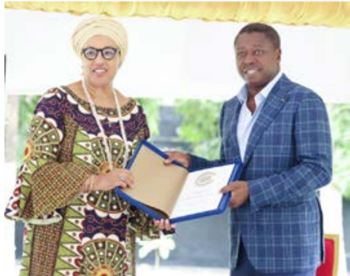
Faure Gnassingbé (à gauche) et Patricia Scotland

C'était une rencontre politique et diplomatique de haute facture. Le mercredi 17 juillet 2024, le président de la République Faure Gnassingbé s'est entretenu à Pya (préfecture de la Kozah) avec Patricia Scotland, secrétaire générale du Commonwealth des Nations. Celle-ci est en visite de travail au Togo. Les deux personnalités ont fait le tour d'horizon de plusieurs questions dont la nouvelle Constitution qui consacre la nouvelle République.