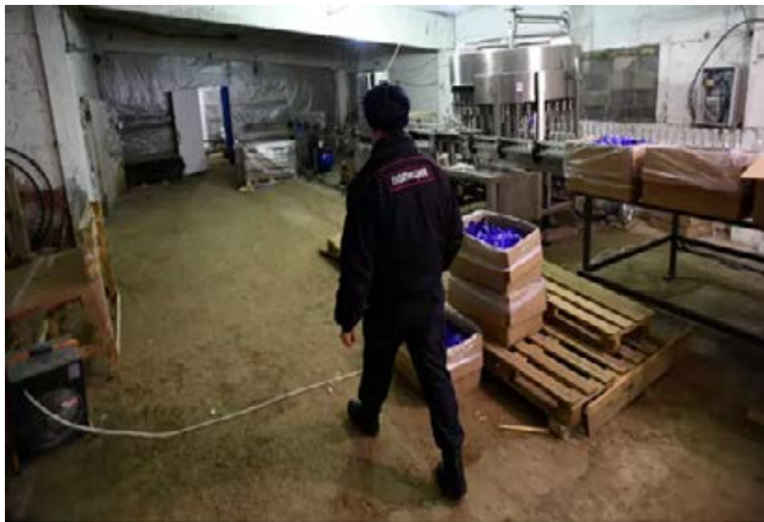
Un atelier de fabrication illégale de la Vodka en Russie

Dans certains pays, comme le Sri Lanka, la production illégale d'alcool affecte l'environnement et la faune. En 2022, des agents de protection de la nature ont sauvé un éléphant dont la trompe était coincée dans un tonneau utilisé pour la fabrication d'alcool illicite. Les écologistes accusent également les contrebandiers de tuer des éléphants pour protéger leurs activités illégales de