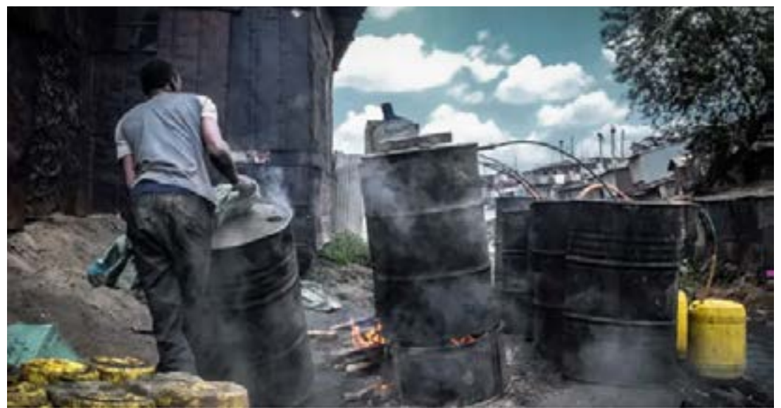
Un atelier de fabrication illégale d'alcool au Kenya

sens : « Méfiez-vous des mauvaises odeurs. Si le produit sent le décapant ou le dissolvant de vernis à ongles, c'est probablement