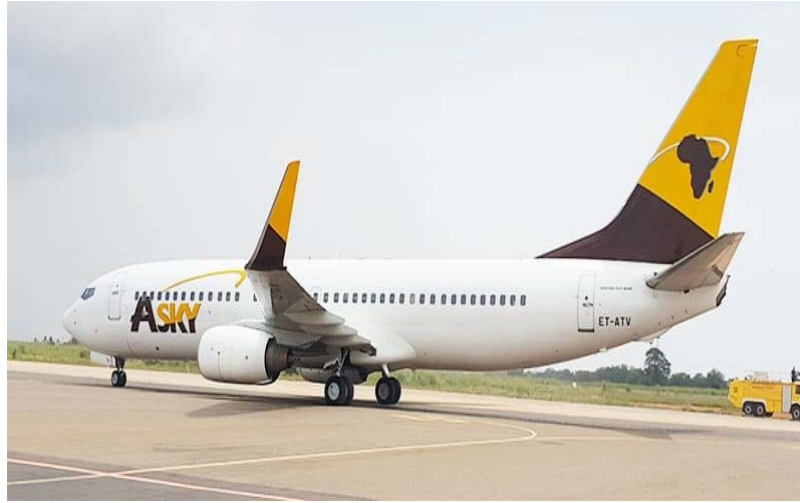
Un avion de la compagnie Asky

A propos de tarifs abordables et avantages exceptionnels pour célébrer l'introduction de ces vols additionnels, ASKY propose des tarifs compétitifs afin de rendre vos voyages encore plus accessibles. " De plus, nos passagers bénéficieront d'une franchise