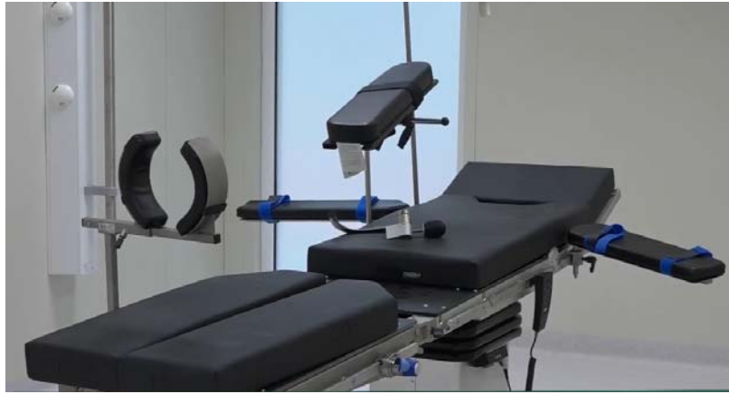
Un plateau technique

de stérilisation, des mobiliers médicaux, des équipements et matériels médico-techniques, de mobilier de bureau et des instruments et petits matériels ont été aussi livrés à cinq Centre médico-social (CMS) à savoir : Atikoumé, Djidjilé, Tado, Sagbiébou, Djarkpangan).