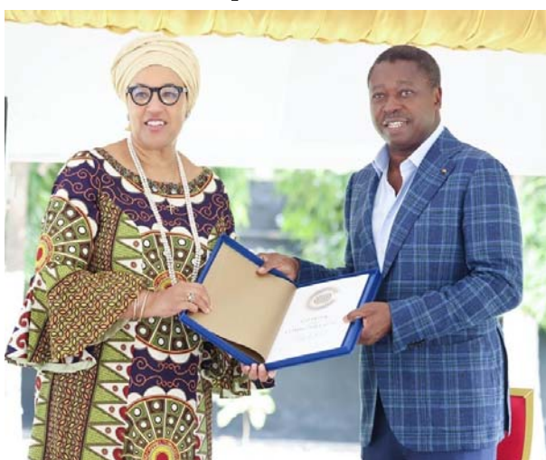
A gauche, ici, Patricia Scotland et Faure Gnassingbé

Patricia Scotland s'est réjouie de sa visite de travail qui augure de bonnes perspectives dans le partenariat entre le Commonwealth et le Togo. " J'ai eu l'immense privilège de visiter le Togo pour la toute première fois et j'ai pu constater de visu la