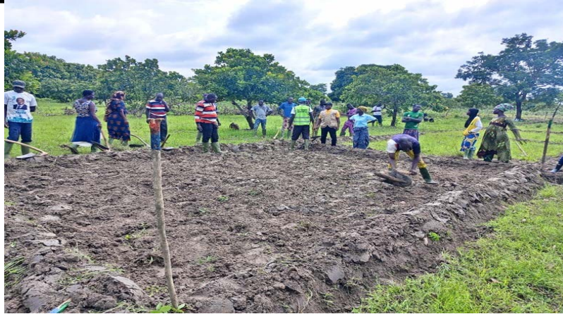
Des agriculteurs dans une rizière

Dans l'optique de promouvoir une approche innovante et de renforcer la résilience des producteurs de riz, le FSRP TOGO soutient la formation d'un pool de riziculteurs formateurs endogènes, à travers le Conseil Interprofessionnel de la filière riz au Togo (CIFR TOGO). Cette formation des producteurs rizicoles, qui s'est déroulée à Blitta dans la région centrale, vise à renforcer les capacités techniques des riziculteurs pour l'appropriation et l'extension de la technologie d'aménagement simple, durable et peu onéreuse des bas-fonds rizicoles pour la gestion de l'eau et de l'espace, à travers l'approche SMART-VALLEYS.