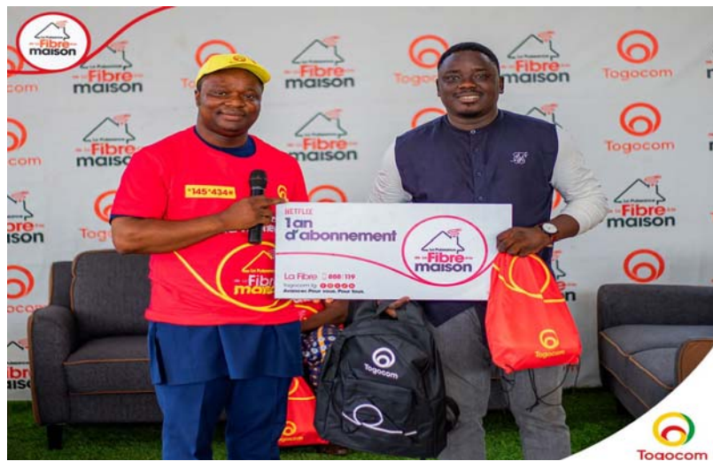
Remise symbolique de prix

Trois mois plus tard, A l'issue de cette fructueuse saison promotionnelle, la dernière cérémonie de remise des prix s'est déroulée le vendredi 12 juillet 2024 à partir de 15h au siège de la direction générale de l'opérateur global à Lomé. En tout, quatre (04) abonnements annuels NETFLIX, cinq (05) Combinés téléphoniques, une télévision