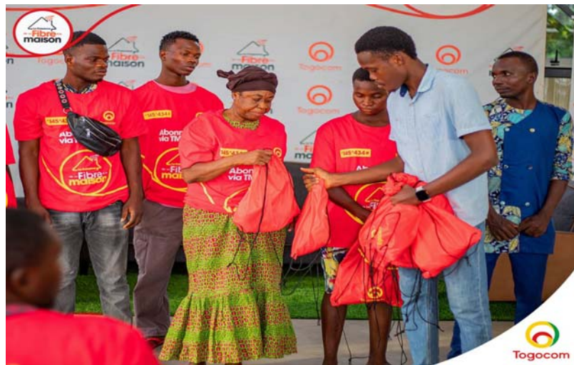
Photo de famille

En rappel, TOGOCOM fait partie d'AXIAN Telecom, un fournisseur panafricain de services de télécommunication opérant sur huit pays à travers ses filiales à Madagascar, aux Comores, à la Réunion et Mayotte, au Sénégal, au Togo, en Ouganda, en RDC et en Tanzanie et au service d'environ 38 millions de clients.