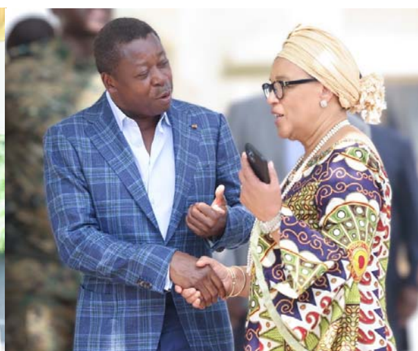
Les deux personnalités à la fin de l'audience

chaleur de l'accueil qui m'a été accordé. Je n'oublierai jamais cette mission au Togo et je crois que le Togo a beaucoup de choses à apporter au Commonwealth. De même le Commonwealth a beaucoup de choses à apporter également au Togo ", a-t-elle lancé à la suite d'une audience que lui a accordé