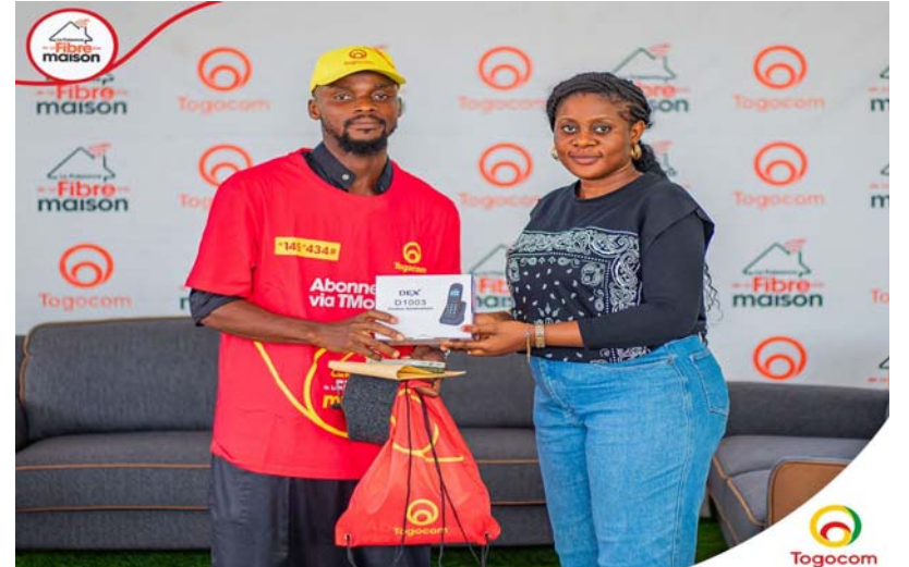
Remise symbolique de prix

qui d'ailleurs, se positionne aujourd'hui comme le leader des télécommunications au Togo. " Ceci illustre le réel engagement de TOGOCOM à offrir des expériences uniques et mémorables à ses abonnés heureux gagnants ",