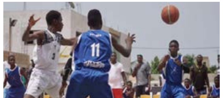
Un match de basketball