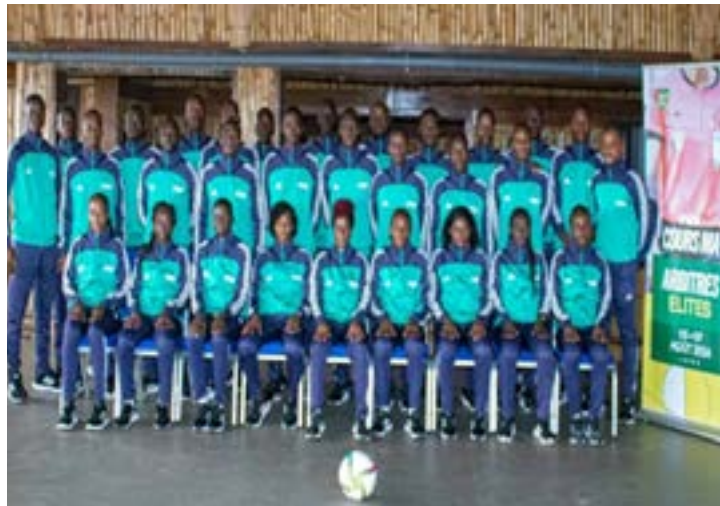
Photo de famille des participants

« Je vous encourage à tirer le meilleur parti de cette formation, à poser des questions, à échanger avec vos pairs et à absorber autant de connaissances que possible. Ensemble, nous pouvons faire en