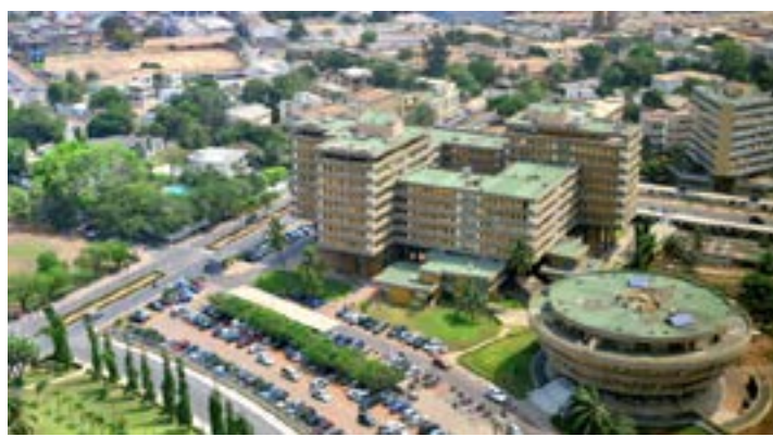
Centre administratif, économique et financier de Lomé

couverture correspond à 32,2 milliards FCFA de soumissions faites par 24 investisseurs sous-régionaux. D'après le rapport de l'opération, 18,6 milliards FCFA ont été mobilisés sur les BAT de maturité d'une année. En ce qui concerne les OAT, 13,5 milliards FCFA ont été collectés sur 3 et 5 ans à