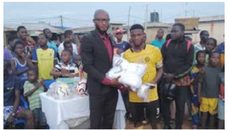
Remise de récompenses

Du côté des garçons, la finale opposant Alaska et Team Rouge s'est également soldée par un match nul (0-0). Team Rouge s'est finalement imposé aux tirs au but (3TAB1). Toutes les équipes participantes,