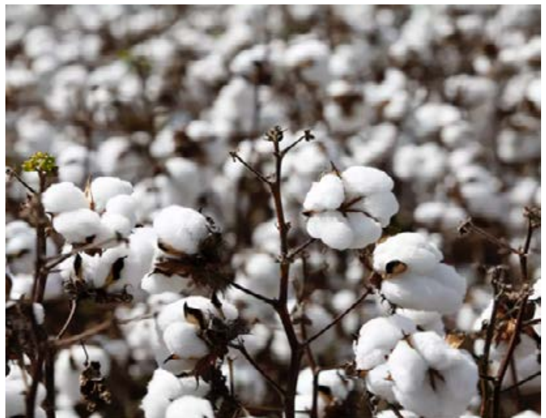
Champ de coton

tonnes de coton ont été récoltées en 2023-2024, soit une hausse de 50 % par rapport aux 46 500 tonnes récoltées lors de la campagne d'avant. Comme d'autres projets