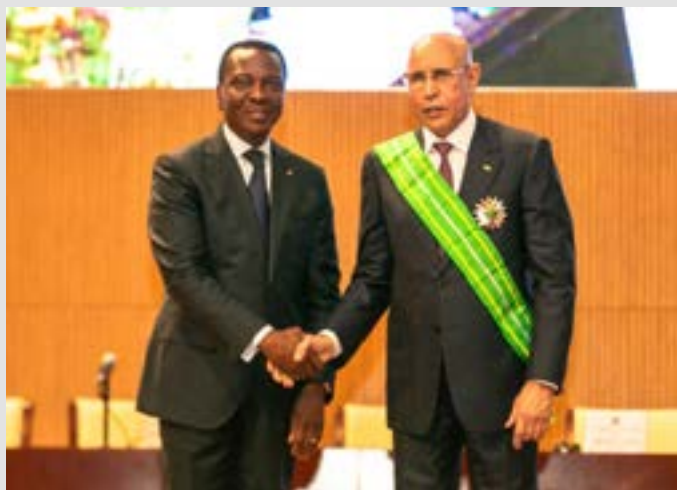
Kodjo Adédzé (à gauche)

Le jeudi 1er août 2024, le président de l'Assemblée nationale Kodjo Adedze a pris part à Nouakchott en Mauritanie, à la cérémonie d'investiture du président Mohamed Ould Cheikh El Ghazouani, réélu pour un second mandat avec 56,12% des voix. Monsieur Adédzé a représenté le président de la République Faure Gnassingbé. L'axe Lomé-Nouakchott se renforce davantage ainsi.