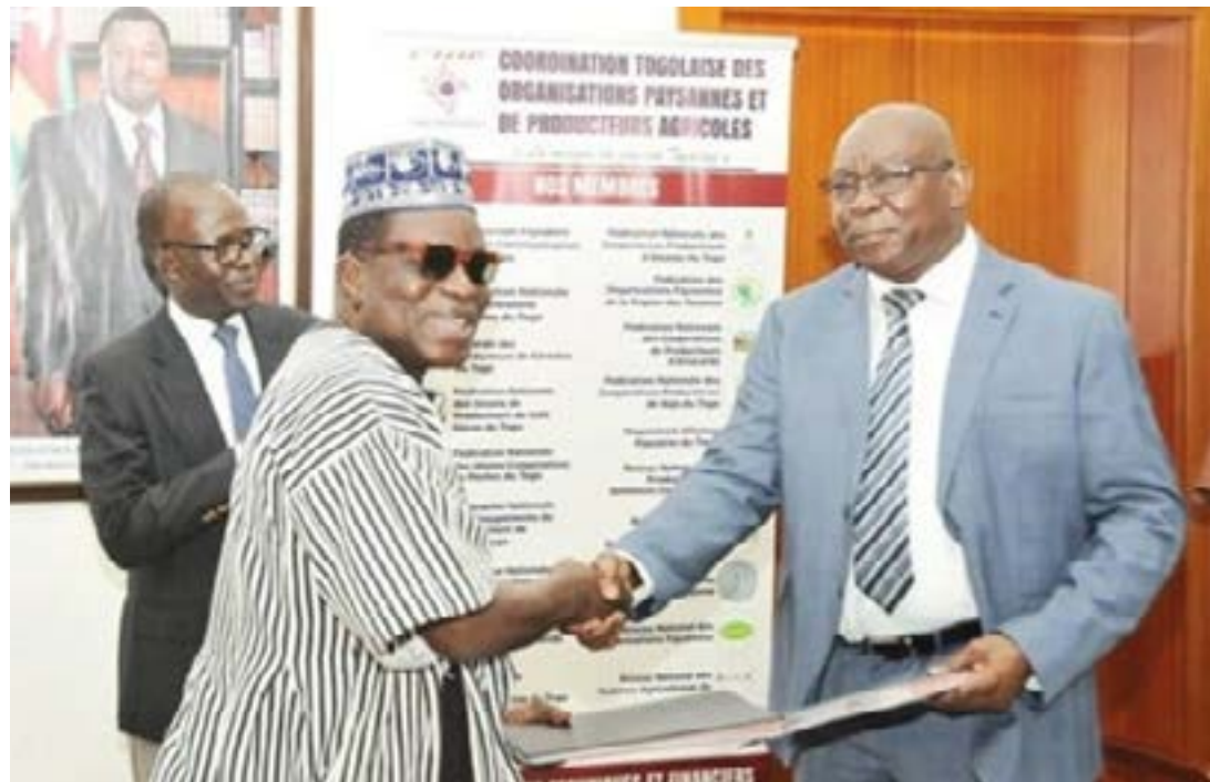
Signature de la convention entre le FIDA et le président du conseil d'administration de la CTOP

Mobiliser des fonds pour faire de l'agriculture togolaise, un facteur de croissance économique est l'un des enjeux de développement qui sous-tend les actions du gouvernement. Pour y arriver, le secteur agricole togolais vient de bénéficier d'un financement de 2,4 millions de dollars, soit environ 1,5 milliard FCFA du Fonds international de Développement agricole (FIDA). L'accord de financement a été paraphé en fin de semaine dernière à Lomé.