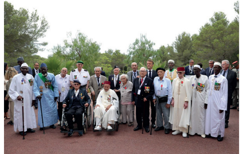
Des soldats ayant pris part au débarquement de Provence

leur volonté à conjuguer avec le présent, la fraternité, la solidarité, l'espérance et bien d'autres valeurs universelles qui ont prévalu en août 1944 en Provence. En ce jour mémoriel, le chef de l'État a salué la mémoire des Africains et Togolais tombés au champ d'honneur pour la paix. Il