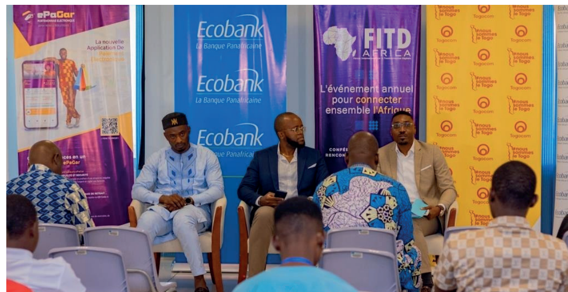
Des experts lors d'un panel

Les 27 et 28 juin dernier, Lomé a accueilli la première édition du Forum International sur la Transformation Digitale (FITD AFRICA 2024). Le groupe Carrefour des Nou-