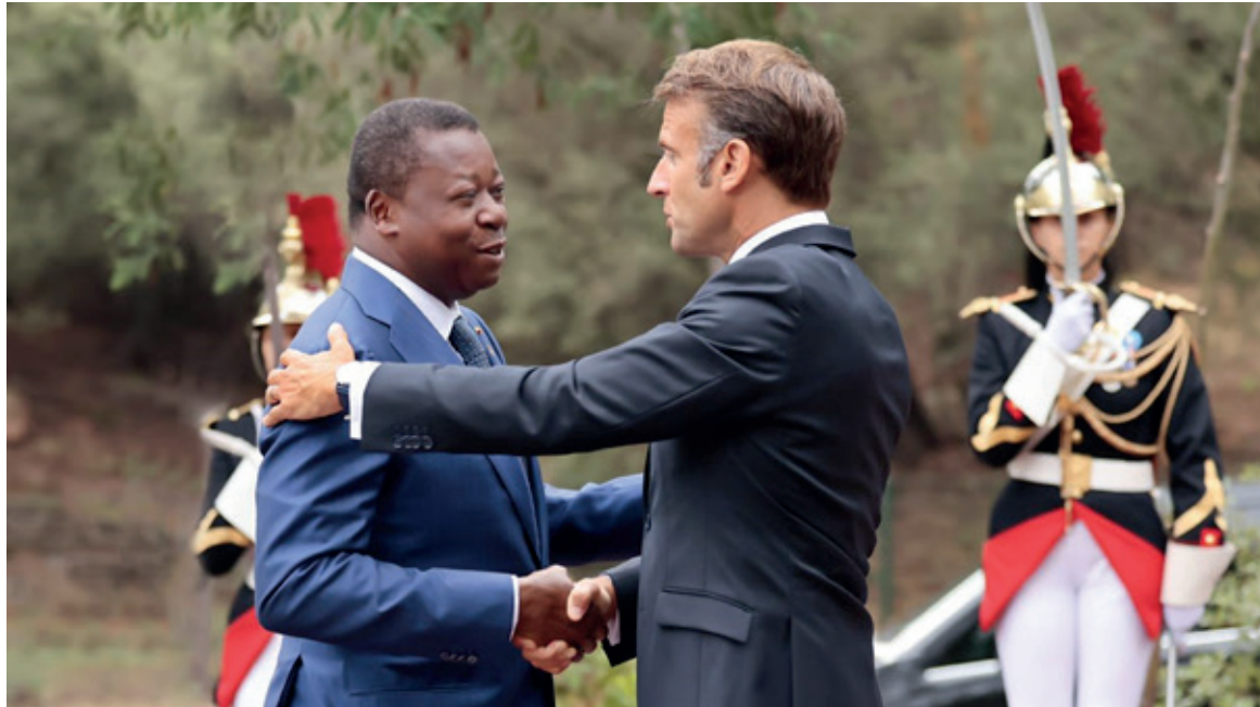
Poignée de main entre les présidents Faure Gnassingbé et Emmanuel Macron

Le Président de la République, Faure Essozimna Gnassingbé a participé aux côtés de ses homologues français et africains, à la commémoration internationale du 80 ème anniversaire du Débarquement de Provence, ce 15 août 2024 à Toulon en France.