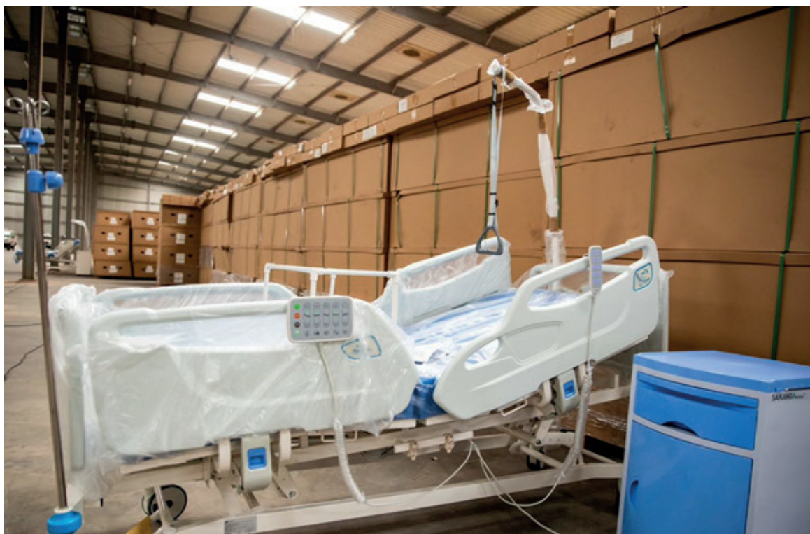
Un aperçu du lot d'équipements médicaux

Les équipements, qui se distinguent par leurs variétés et leurs qualités, comprennent quelques milliers de lits d'hospitalisation et d'accouchement, des appareils de radiodiagnostic mobiles numérisés, des ambulances médicalisées, des tables d'examen, de soin et d'accou-