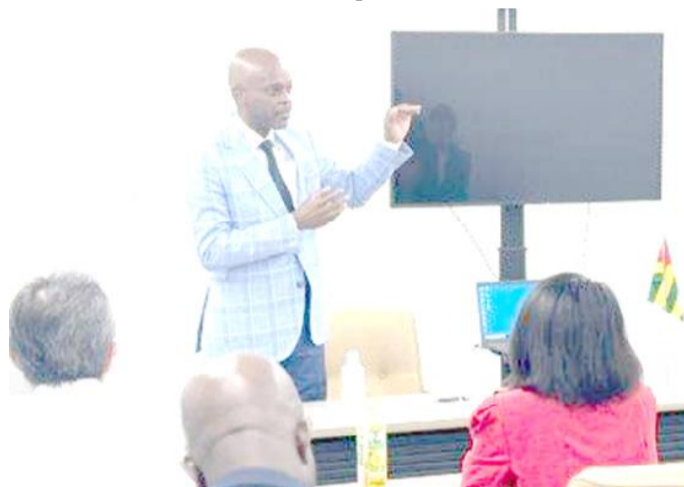
Robert Dussey, lors de sa conférence à l'Université Sophia de Tokyo

A cette réunion, le ministre Dussey a rappelé l'importance des relations nippo-africaines tout en se félicitant de l'excellence des relations entre les deux pays et présenté les atouts de l'économie togolaise et les opportunités d'investissements qu'elle offre aux entreprises et aux entrepreneurs japonais et souligné la disponibilité de notre pays à renforcer davantage les relations de coopération avec le Pays du Soleil Levant. Il a invité le Japon à soutenir la riposte anti-terroriste en cours en Afrique de l'Ouest et à appuyer les efforts du gouvernement pour la préservation de la paix, de la sécurité et de la stabilité dans notre pays.