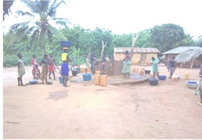
Assainissement et eau potable dans le Vo, même défi

Les projets concernés qui coiffent ces activités sont le Projet d'Amélio-