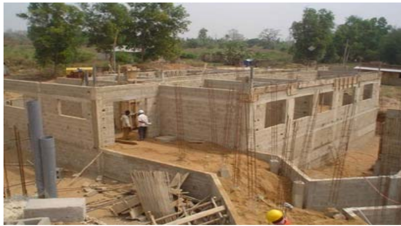
Un chantier en construction

Les "Activités spécialisées de construction" affichent au 1er trimestre 2024 une tendance à la baisse avec un chiffre d'affaires qui diminue de (-63,1%) par rapport au 4ème trimestre de 2023. Cette baisse est en lien avec la diminution conjuguée du chiffre d'affaires des sous-branches : "Travaux de finition" (-71,4%) et "Autres travaux spécialisés de construction" (-