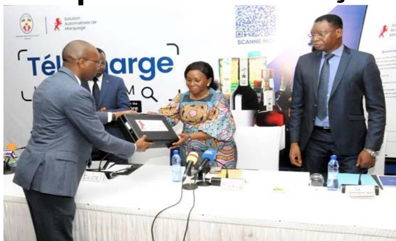
Au milieu, la ministre du Commerce, lors de la cérémonie de lancement de l'application

En effet, ce lancement marque un engagement fort du Gouvernement, sous le leadership du Chef de l'État, d'œuvrer pour la qualité et la bonne traçabilité des produits, la transparence sur la