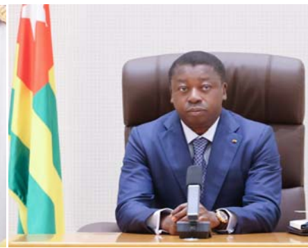
Le Président Faure Gnassingbé