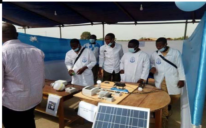
Des jeunes en formation

L'exécutif a indiqué en août de cette année que le grand objectif est de faire arriver l'indicateur du taux d'insertion professionnelle à au moins 80 % à l'horizon 2025. Cela " dénote de l'importance toute particulière que le gouvernement accorde à ce secteur, considéré comme l'un des leviers pour booster la croissance de l'économie nationale ", assurent les pouvoirs publics. Selon les chiffres communiqués, entre 2020 et 2023, le nombre d'apprenants dans les établissements d'enseignement technique a progressé de façon significative. Il est exactement passé de 49 797 à 67 183. Il existe donc un intérêt vraiment croissant de la jeunesse pour l'enseignement tech-