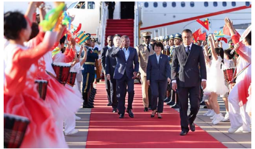
Le Président Faure Gnassingbé à son arrivée à Beijing

Il est prévu, à l'agenda du FOCAC 2024, des réunions de haut niveau, des rencontres en bilatérale et une conférence des entrepreneurs