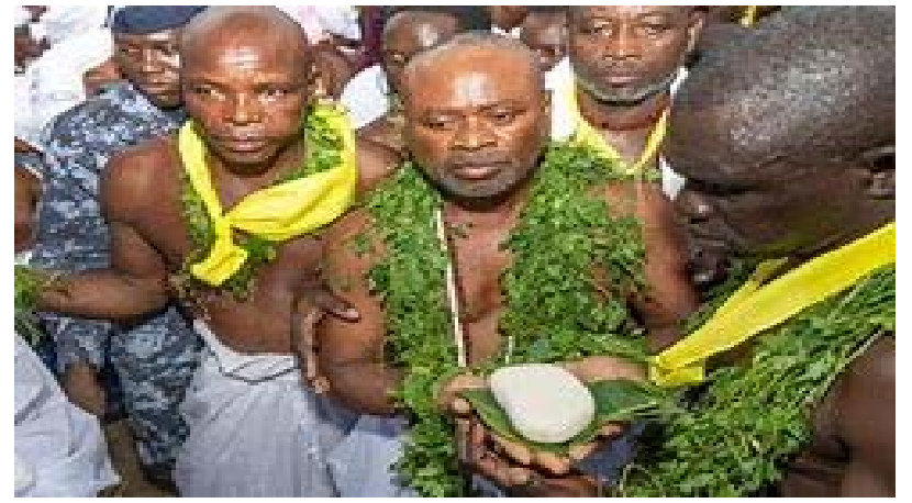
Des prêtres vaudou tenant la pierre sacrée

Ce rituel consiste à se déguiser en fou, en chantant " Togné bé noué wémawè... " (C'est l'héritage de mes parents. Je suis fière de l'honorer), dansant à travers les rues du monde