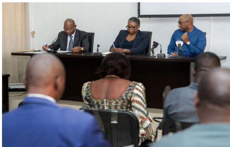
Une vue de l'assistance lors de la rencontre

niers ont entretenu les professionnels des médias sur le Bilan des Réalisations et Préparatifs pour la Rentrée Scolaire 2024-2025, aussi bien du ministère de l'enseignement technique, de la formation professionnelle et de l'apprentissage, que de celui de l'enseignement primaire et secondaire.