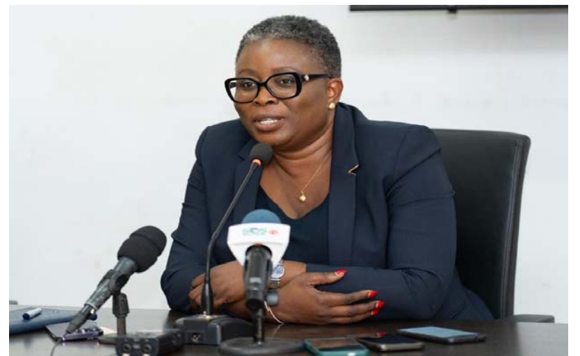
La ministre Yawa Kouigan

Intitulé " Rendez-vous avec le Gouvernement ", la première session s'est tenue le vendredi dernier dans la salle de conférence du Ministère de la Communication autour du thème de l'éducation. Ce qui a justifié la présence des Ministres Kokoroko et Tchiakpe. Ces der-