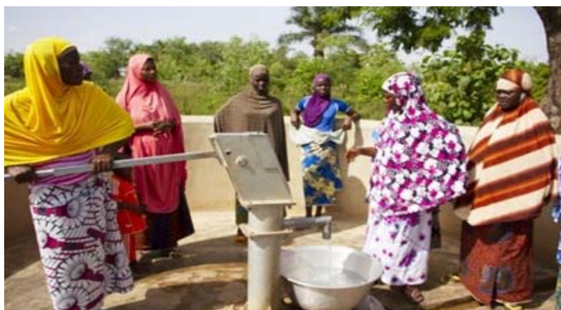
Un forage public

urbain et urbain, le taux de desserte en eau potable a connu une hausse spectaculaire entre 2014 et 2023.