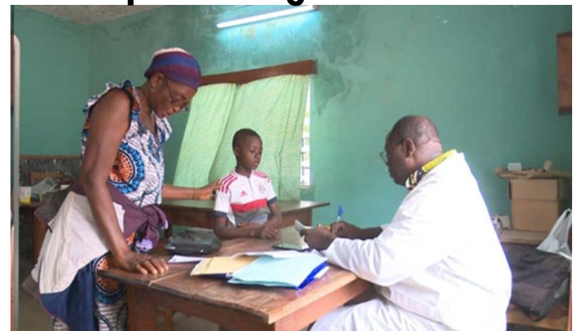
Une consultation médicale

Aussi, 150 motos sont offertes pour le renforcement de la surveillance épidémiologique et du programme élargi de vaccination sur le terrain. Sont également inclus dans les dispositifs acquis et offerts par les gouvernements, un lot de maté-