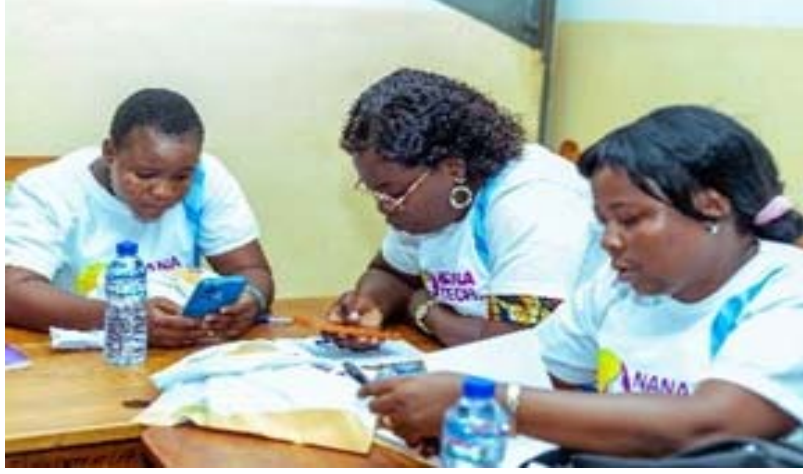
Des jeunes femmes connectées

Depuis quelques semaines déjà, le MENTD déroule le programme de NanaTech Immersion dans toutes régions du Togo,