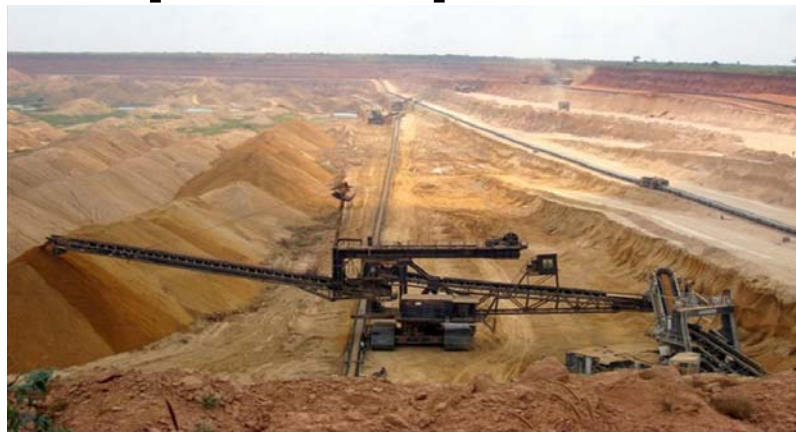
Un gisement de phosphate

Le premier client du Togo est l'Inde, avec une part de 22,0 % des exportations du trimestre. Les exportations du Togo vers ce pays