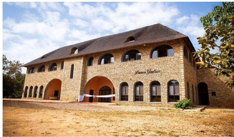
Une vue dudit centre

Les activités du Centre s'organisent autour de trois pôles consacrés respectivement à la formation-entrepreneuriat avec une école des arts, des métiers et des incubateurs, aux