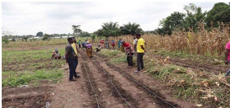
Des agriculteurs dans un champ

Une des offensives phares, consignées dans la Feuille de route gouvernementale 2025, le PTA vise à moderniser l'agriculture et à encourager sa transformation industrielle. Ses réalisations sont bénéfiques aux acteurs, en ce sens qu'elles offrent des opportunités d'entrepreneuriat