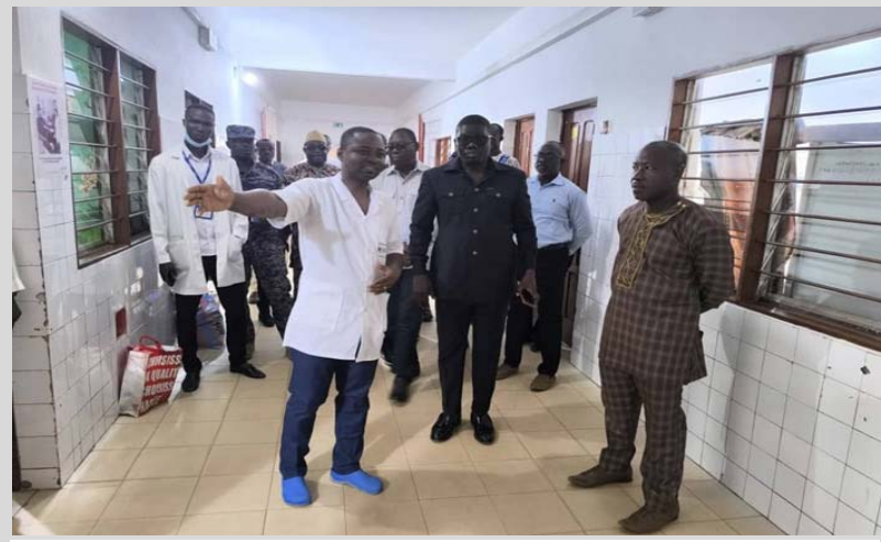
Le ministre de la Santé, Prof Darré

Les réformes engagées au cours de la décennie pallient les insuffisances comme le manque d'infrastructures, la pénurie de personnel médical et les inégalités d'accès aux soins. Cette série de mesures, qui touchent aussi à la formation, au recrutement, à la gestion et à la répartition des res-