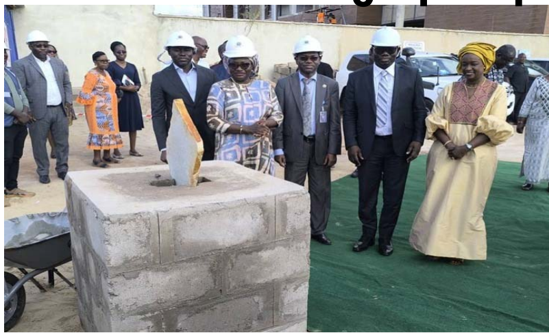
Pose de la première pierre pour la construction du Centre national de santé digitale

Il palliera, autant que faire se peut, les inégalités, en rendant les services de santé plus accessibles à distance. Grâce à la télémédecine, par exemple, les médecins basés dans les grandes villes du pays pourraient offrir des consultations à des patients situés dans des zones isolées, réduisant ainsi le temps d'attente et les déplacements coûteux pour