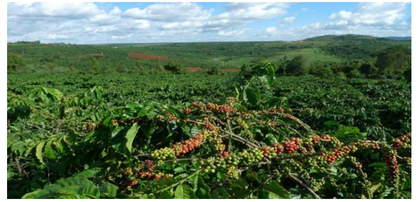
Un champ de café

Le Conseil des ministres a aussi adopté le décret portant approbation de l'accord international de 2022 sur le café, adopté le 09 juin 2022 à Bogota. Le Togo est également membre de l'Organisation Internationale du café (OIC), créée en 1962. L'accord international a été plusieurs fois révisé et le nouvel accord a été adopté le 09 juin 2022, pour permettre à l'organisation de rechercher de nouveaux moyens et ressources pour développer davantage l'industrie du café, lutter contre les maladies qui s'attaquent à cette culture et contre les changements climatiques. " L'approbation du nouvel Accord par le Togo ouvre la voie à l'adoption de stratégies appropriées en vue de soutenir la production, la commercialisation, la transformation et la consommation