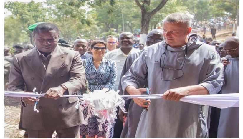
Coupe du ruban symbolique par le Chef de l'Etat (g)

retraites et conférences et au ressourcement spirituel. Le complexe dispose pour cela des infrastructures d'accueil de qualité, telles que des salles de conférence, un auditorium, des salles de classe, des ateliers, des dortoirs et villas, une chapelle, un restaurant, une piscine, toutes construites avec des matériaux locaux, notamment la pierre et la paille.