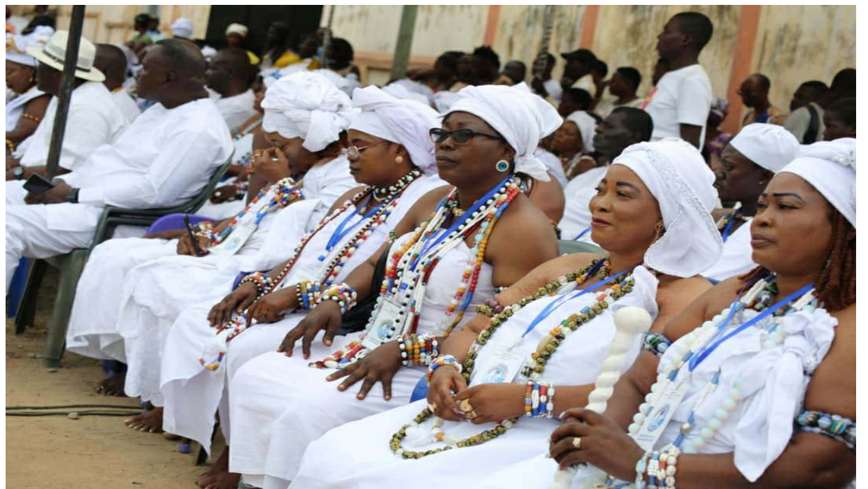
La richesse culturelle de la ville d'Aného

Selon le Comité d'organisation du FIHA, cette année, le carnaval d'Aného sera une nouvelle fois, une fête populaire. Il sera composé de plusieurs défilés, dont le cortège traversera