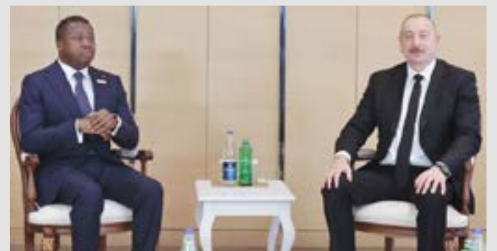
Faure Gnassingbé (à gauche)

Le mercredi 13 novembre 2024, le président de la République Faure Gnassingbé s'est entretenu avec son homologue azerbaïdjanais, Ilham Aliyev à Bakou. Les deux hommes ont eu ce tête-à-tête à l'occasion de la 29ème Conférence des Parties (CoP 29) à la Convention-cadre des Nations unies sur les changements climatiques (CCNUCC).