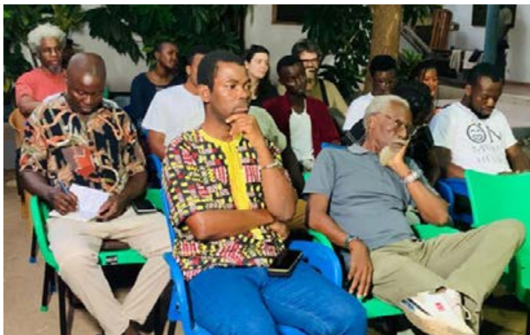
Aperçu de l'assistance

à décembre 2023, les quatre auteurs ont été en immersion dans la capitale