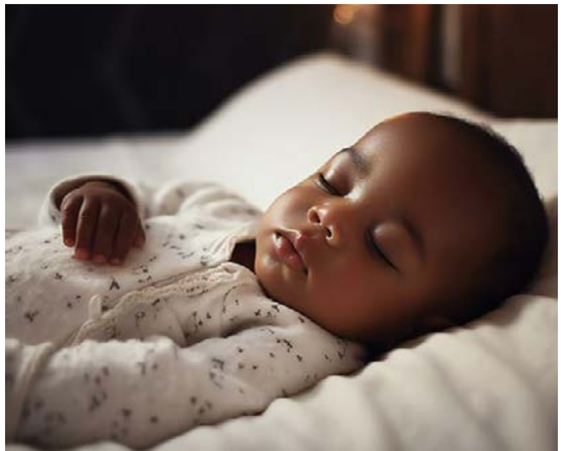
Un bébé dans son sommeil

Ces résultats, qui suggèrent que des durées de sommeil supérieures ou inférieures à sept heures environ sont préjudiciables à toutes les fonctions cognitives étudiées, sont similaires pour les adultes d'âge moyen et les adultes âgés, bien que les scores de résultats soient plus faibles chez les personnes âgées que chez les adultes. En outre, l'insomnie semble affecter plus fortement les fonctions exécutives, mais aussi la mémoire et la