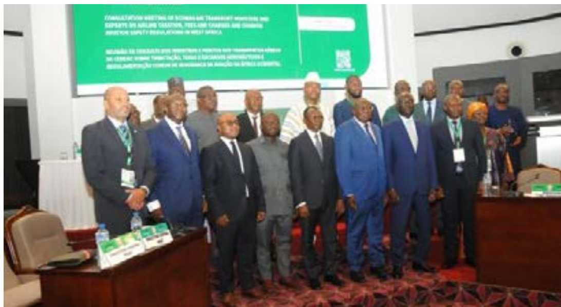
Réunion des ministres des Transports de la Cedeao, du 5 au 8 novembre dernier à Lomé

La Communauté économique des Etats de l'Afrique de l'Ouest (Cedeao) veut bousculer la donne du transport aérien dans la région. Réunis à Lomé, du 5 au 8 novembre dernier, les ministres des Transports de la Communauté ont validé une stratégie régionale visant la « suppression de toutes les taxes jugées non conformes aux recommandations de l'OACI et la réduction de 25% des redevances liées aux passagers et à la sécurité ». Une diminution des tarifs des vols devrait donc intervenir dès janvier 2026, selon un communiqué de l'institution communautaire, datant du 12 novembre.