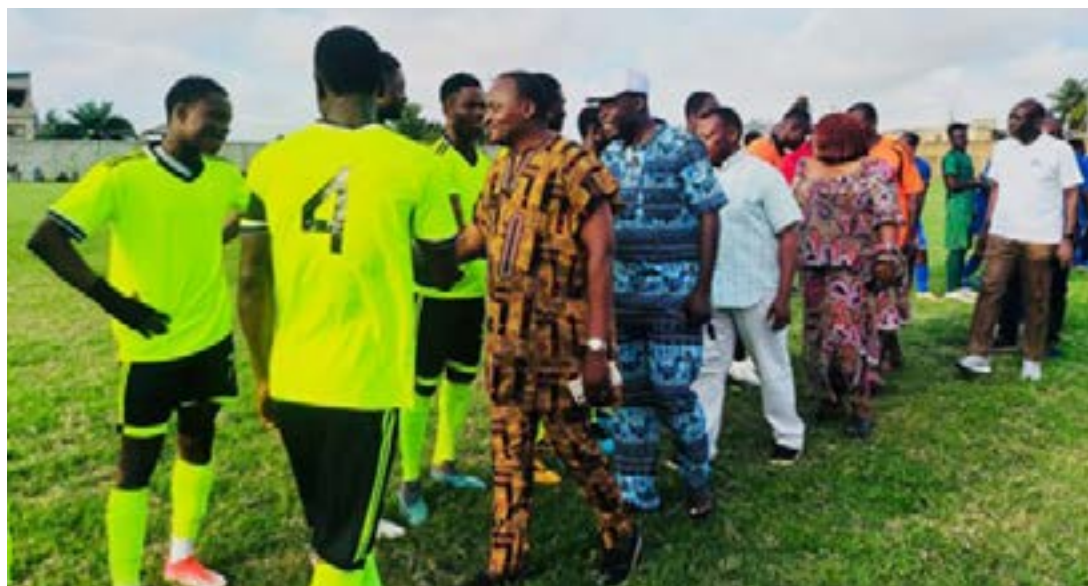
Protocole entre joueurs et initiateurs

Lancé le 10 août 2024, ce tournoi a rassemblé des équipes issues des ghettos de Lomé et d'Agoè-Nyivé, avec pour objectif de promouvoir la fraternité, l'inclusion sociale et le vivre-ensemble. Pour cette première édition,