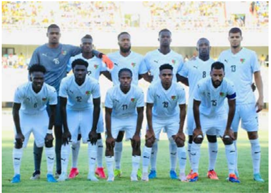
Éperviers du Togo

« Nous avons été inefficaces dans le rectangle du Liberia. En première partie, nous aurions pu mener 3 buts à zéro. Même durant tout le match, nous avons eu des situations de buts non concrétisées. Nous avons maîtrisé le match