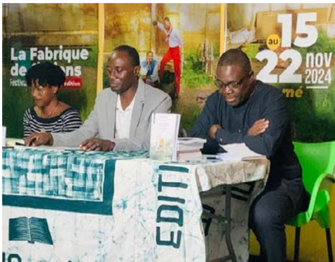
Présidium de la dédicace

Les critiques littéraires ayant pris part à la dédicace ont relevé la qualité, la rhétorique et le style des auteurs. Ils se sont également intéressés aux thématiques développées. « La maison de mon père » parle d'une maison en ruine, d'une nouvelle à