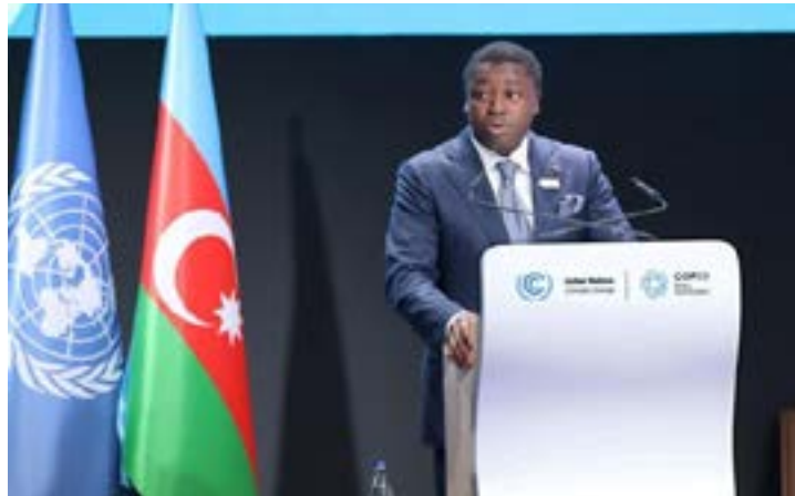
Faure Gnassingbé durant son intervention à la CoP 29

Le mardi 12 novembre 2024, le président de la République Faure Gnassingbé a activement participé au sommet des dirigeants mondiaux sur l'action climatique. C'était dans le cadre de la 29ème Conférence des Parties (CoP 29) à la Convention-cadre des Nations unies sur les changements climatiques, à Bakou en Azerbaïdjan.