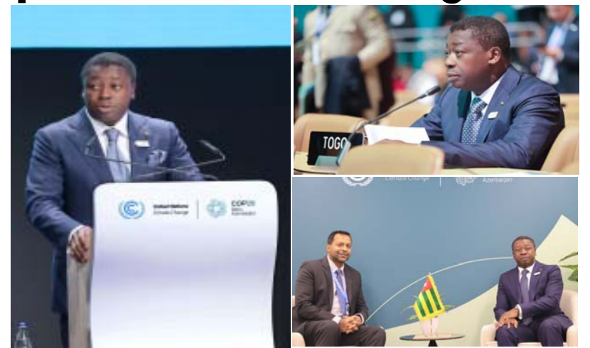
Quelques temps forts de la participation de Faure Gnassingbé à la Cop29

Il a appelé à un leadership africain sur la question climatique, avec une position unifiée et une