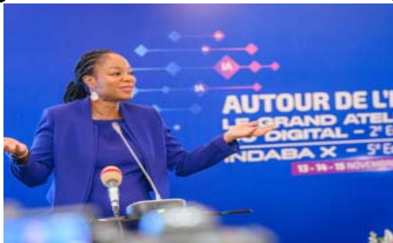
La ministre Cina Lawson

Depuis quelques temps déjà, le Togo mène des réflexions sur sa stratégie nationale de l'Intelligence Artificielle. " Nous sommes en 2024, et nous allons utiliser l'intelligence artificielle à bon escient ", a déclaré Cina Lawson. Pour elle, plusieurs domaines structurants, notamment l'éducation, doivent intégrer l'IA, car elle améliore la qualité des cours. L'IA peut égale-