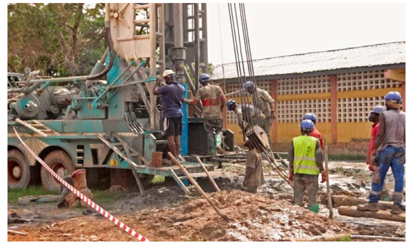
Un forage en chantier

Par le truchement des réalisations du PURS, l'énergie électrique gagne la région des Savanes à une allure rapide. Précédemment sous-équipées, les zones qui bénéficient du programme ont de plus en plus de la