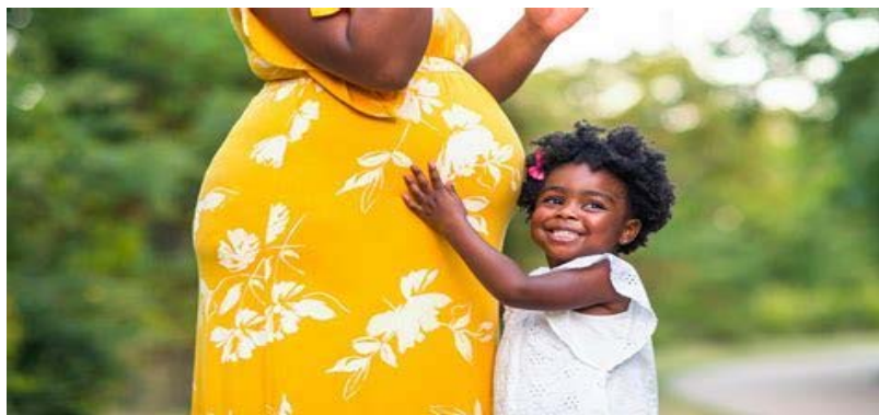
Une femme enceinte

ment complet, les autorités montrent à la couche de la population concernée que personne ne sera laissé au carreau, comme l'a promis le chef de l'État, qui se met au service du bien-être de ses concitoyens.