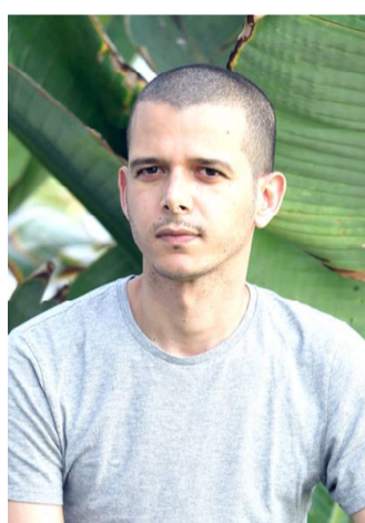
2010) et Vivre à la lumière. Le Bastion des Larmes est son premier livre aux Éditions