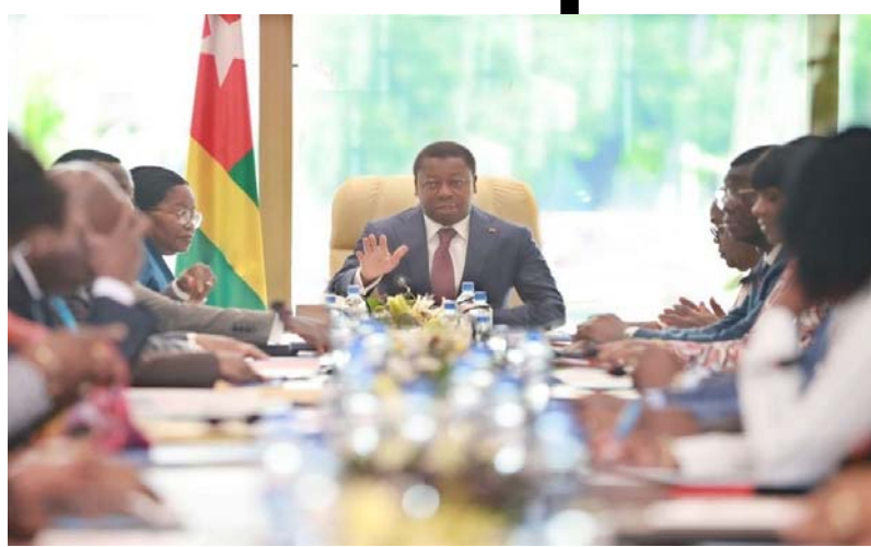
Une vue des membres du gouvernement en conseil des ministres

En lien avec la feuille de route gouvernementale 2025, le présent projet de loi de finances, exercice 2025, tient compte des priorités de l'exécutif en matière de développement économique et social, notamment les mesures de soutien aux couches les plus vulnérables. Axe 1 inclusion et capital humain (dépenses sociales) : 659,2 milliards de francs CFA, soit 49,7% contre 48% en 2024 ; Axe 2 Transformation éco-