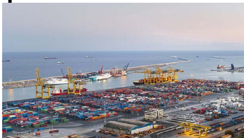
Une vue aérienne du Port autonome de Lomé

Les " Huiles de pétrole ou de minéraux bitumineux (à l'exclusion des huiles brutes) et préparations, n.d.a., qui contiennent en poids 70 % ou plus d'huiles de pétrole ou de minéraux bitumineux et dont ces huiles constituent l'élément de base " sont le deuxième produit exporté, avec une valeur de 16 954,0 millions de F CFA, pour un volume de 27 687,3 tonnes. Ils représentent 7,9 % des exportations. Les " Sacs,