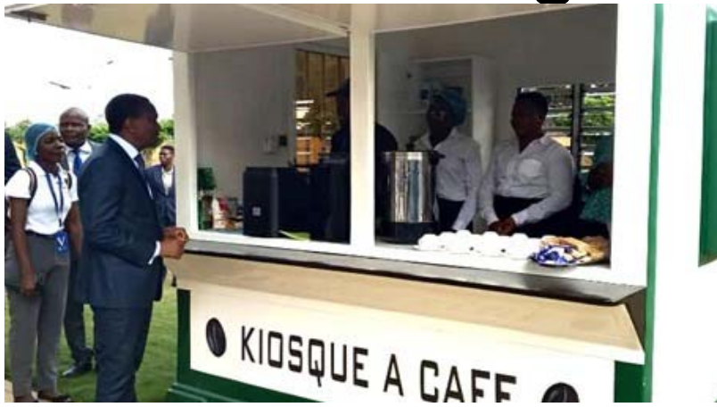
Le PA Adédézi devant le nouveau kiosque à café "made in Togo"

Face à l'importance de cette filière dans le développement écono-