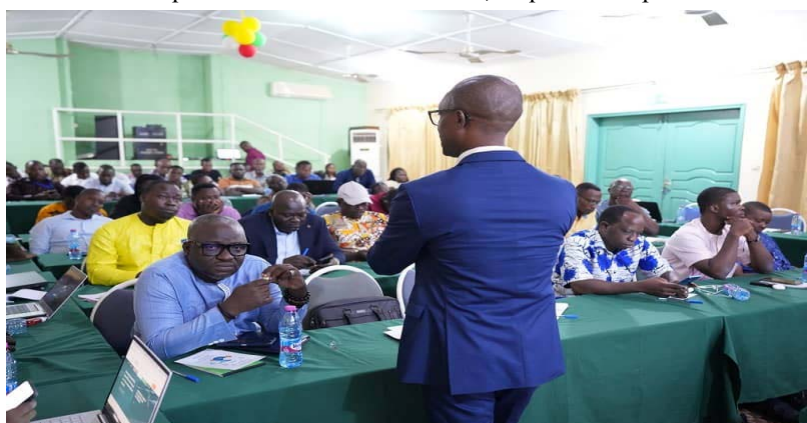
Une vue de l'assistance lors des travaux