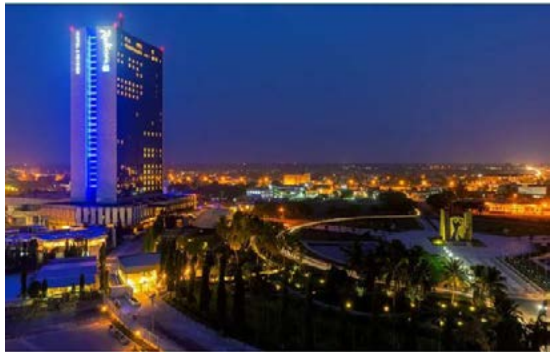
L'hôtel du 2 février de Lomé où se tient le sommet

Madame Tomégah-Dogbé recommande de former les jeunes aux métiers de l'énergie, d'encourager l'innovation locale, et d'investir dans la recherche