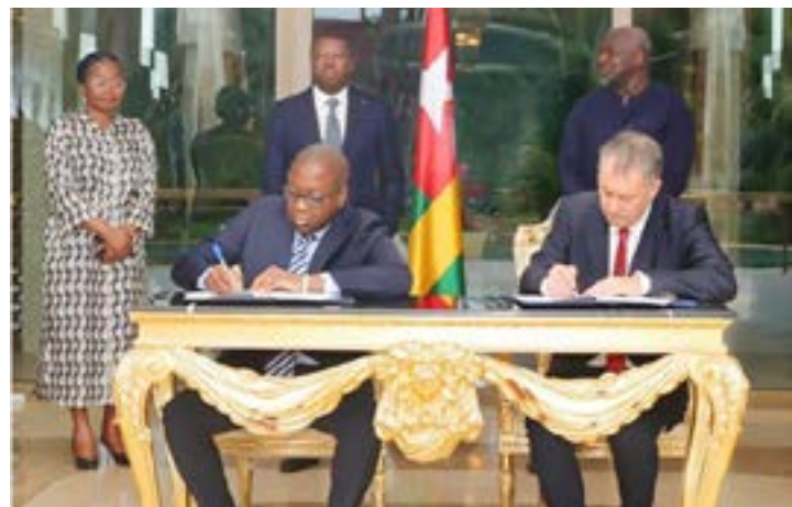
La séance de signature

Le lundi 2 décembre 2024, le président de la République Faure Gnassingbé a présidé, à Lomé, une cérémonie de signature d'accord de production d'électricité à base de microréacteurs nucléaires entre le Togo et la société américaine Nano Nuclear Energy.