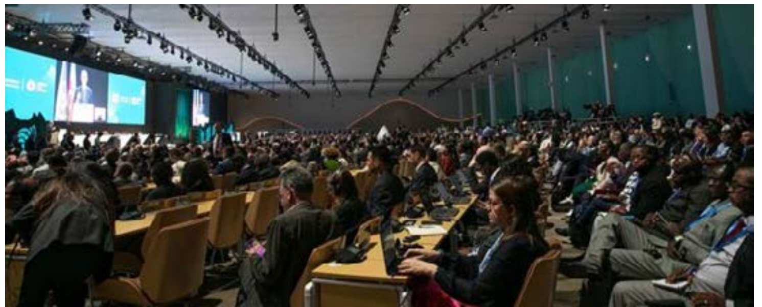
Vue partielle des participants à la CoP 29

Le chef de l'Onu a félicité les négociateurs d'avoir trouvé un terrain d'entente, argumentant :