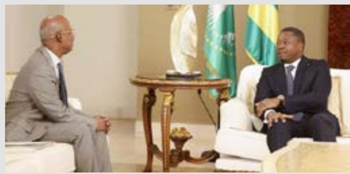
Faure Gnassingbé (à droite)

Le président de la République, Faure Gnassingbé a accordé, le lundi 2 décembre, une audience à une délégation djiboutienne conduite par le ministre djiboutien de la Santé.