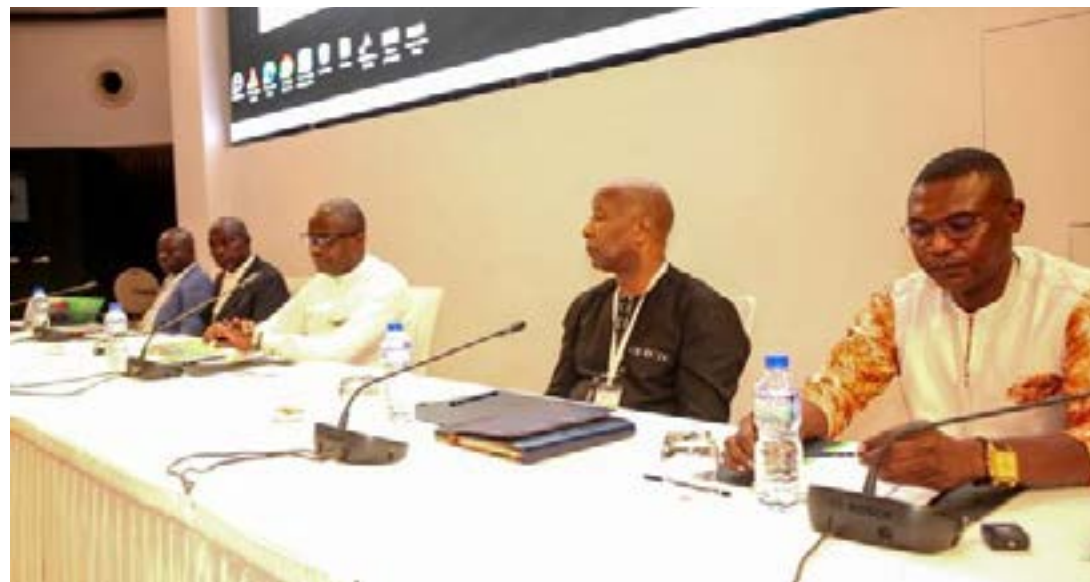
Point du projet DigiCoop-WA, ce 02 décembre à Lomé

Pour le président du conseil d'administration