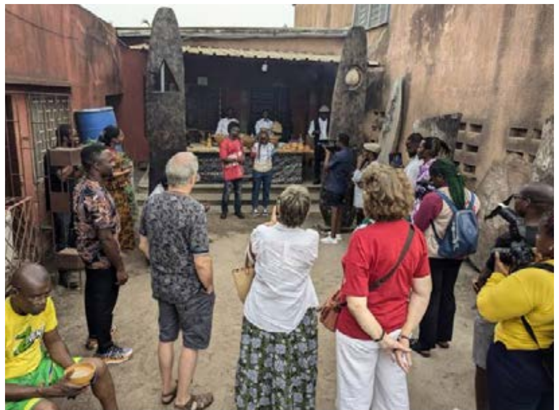
Exposition "Alodo", vernissage tenu ce samedi 30 novembre à Lomé

Suite à ce vernissage, l'exposition se tiendra du 02 au 14 décembre 2024 à