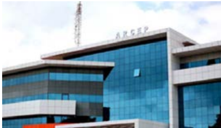
Siège Arcep Togo

potentielles défaillances du marché du stockage de la donnée, les interventions publiques pour y remédier ainsi que sur les mesures réglementaires pour permettre l'émergence et le développement des services numériques, en