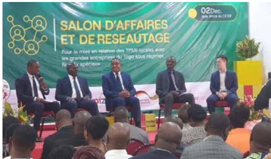
Salon d'affaires et de réseautage, ce lundi 2 décembre à Lomé

(Zlecaf). Récemment, avec le soutien de l'Allemagne, le ministère du Commerce, de l'Artisanat et de la Consommation locale a