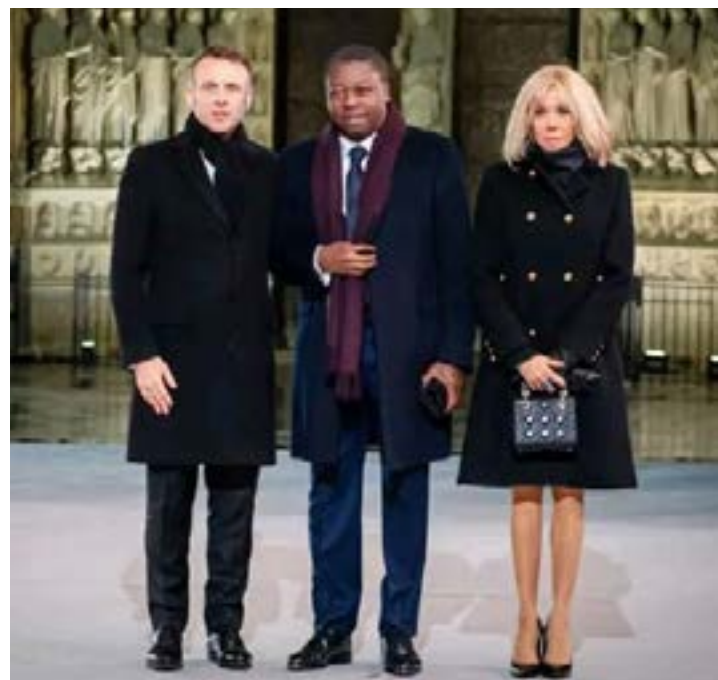
Faure Gnassingbé (au milieu)

allemand Frank-Walter Steinmeier, ukrainien Volodymyr Zelensky, congolais Denis Sassou Nguesso, bissau guinéen Umaro Embaló, du roi Philippe des Belges, du prince britannique William et bien d'autres, le président de la République, a assisté aux