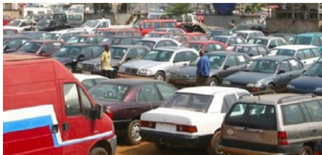
Enchères publiques de l'OTR

Pour participer, il suffit de payer une quittance non remboursable de 5000 FCFA. Les paiements devront être effectués immédiatement, sur place, avec une majoration de 12 % sur le prix d'adjudication. Le retrait des biens se fera dès l'achat, offrant ainsi une satisfaction instantanée aux acheteurs. L'Office précise que les adjudicataires devront s'acquitter de leurs obligations avant 17 h 30, sous peine de voir leur acquisition annulée. Une précision qui témoigne du