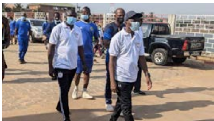
Au premier rang, le président de l'Assemblée nationale, Kodjo Adedze lors de la "JNRD Togo-Propre"

Sous le signe de la gratitude, la Journée nationale de reconnaissance à Dieu (JNRD) aura lieu le 15 décembre prochain. En prélude à cette Journée, l'initiative JNRD Togo Propre a investi, ce samedi 7 décembre, 15 localités du pays pour une opération de salubrité publique. A Lomé, dans le quartier Avedji, quelques ruelles jouxtant le bassin de rétention d'eau ont été rendues au propre.