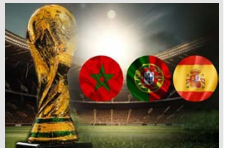
Maroc, coorganisateur du mondial 2030

Afin de faciliter les déplacements entre les