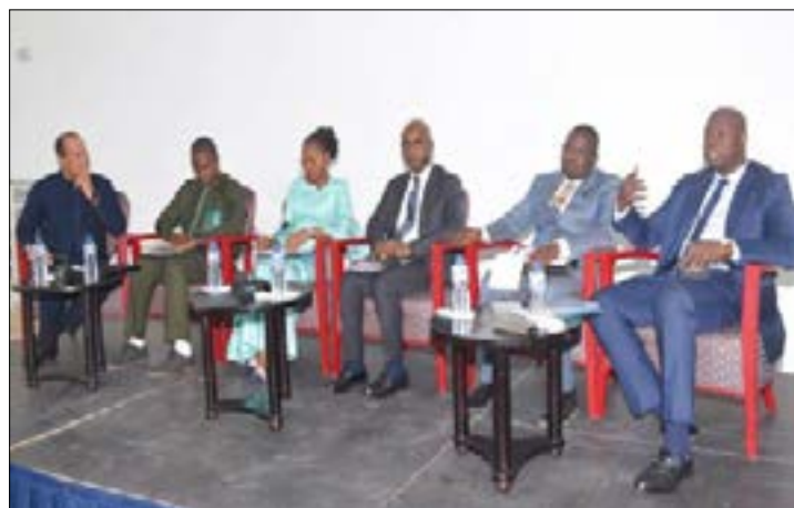
Dialogue public-privé, ce mercredi 04 décembre à Lomé

Rassemblant une mosaïque d'acteurs clés des sphères publique et privée, le dialogue public-privé vise à parvenir à un consensus autour de réformes institutionnelles. Ces dernières sont des leviers visant à renforcer l'attractivité du Togo en tant que destination d'investissement. Cet atelier a ainsi vu la participation active des secrétaires généraux des ministères, directeurs d'agences publiques, élus locaux et parlementaires, aux côtés des présidents d'organisations professionnelles et