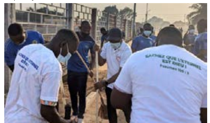
Opération "JNRD Togo-Propre", ce samedi 07 décembre à Lomé

En ces temps où le Togo cherche à concilier tradition et modernité, cette initiative citoyenne est une illustration éclatante de ce que peut accomplir une nation unie. Elle rappelle que chaque coup de balai, chaque déchet ramassé, est une brique posée pour un avenir meilleur. Le rendez-vous est ainsi donné aux populations dans les 15 localités qui vibreront à l'unisson pour célébrer la 12ème édition de la JNRD. Un Togo propre, uni et reconnaissant : voilà