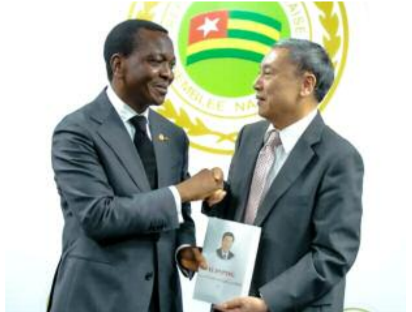
Le chef de la délégation a invité le Président de l'Assemblée nationale pour une visite de travail en Chine pour l'approfondissement des discussions entre les deux parties.