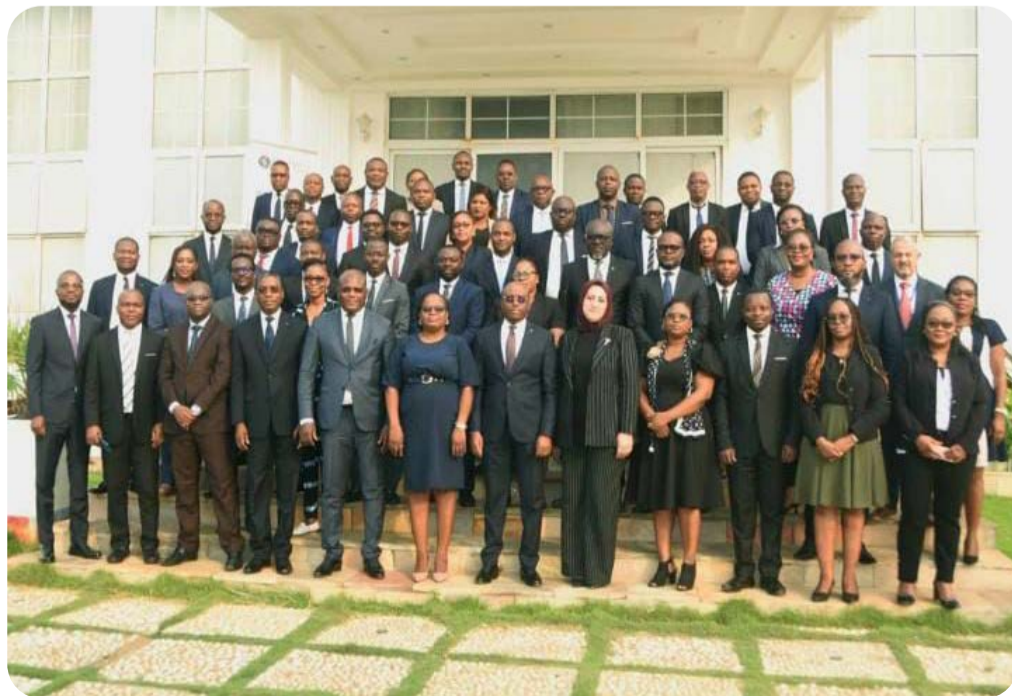
• Les équipes de BSIC-Togo S.A. réunies pour la retraite de stratégie 2025 placée sous le signe de l'innovation et de la performance.