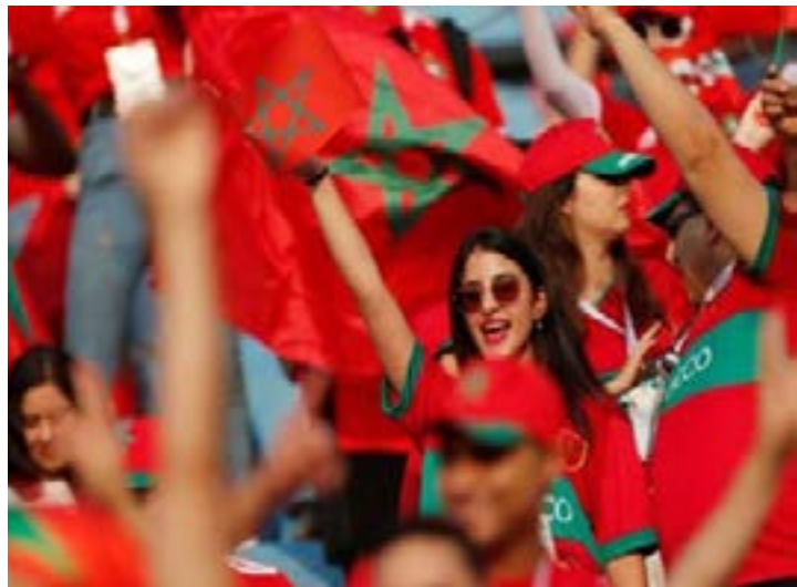
Supporters du Maroc

Le Maroc innove pour la CAN TotalEnergies 2025. Chaque équipe qualifiée disposera d'un camp de base dédié, combinant un hôtel haut de gamme et un terrain d'entraînement exclusif. Les dispositifs mis en place sont historiques.