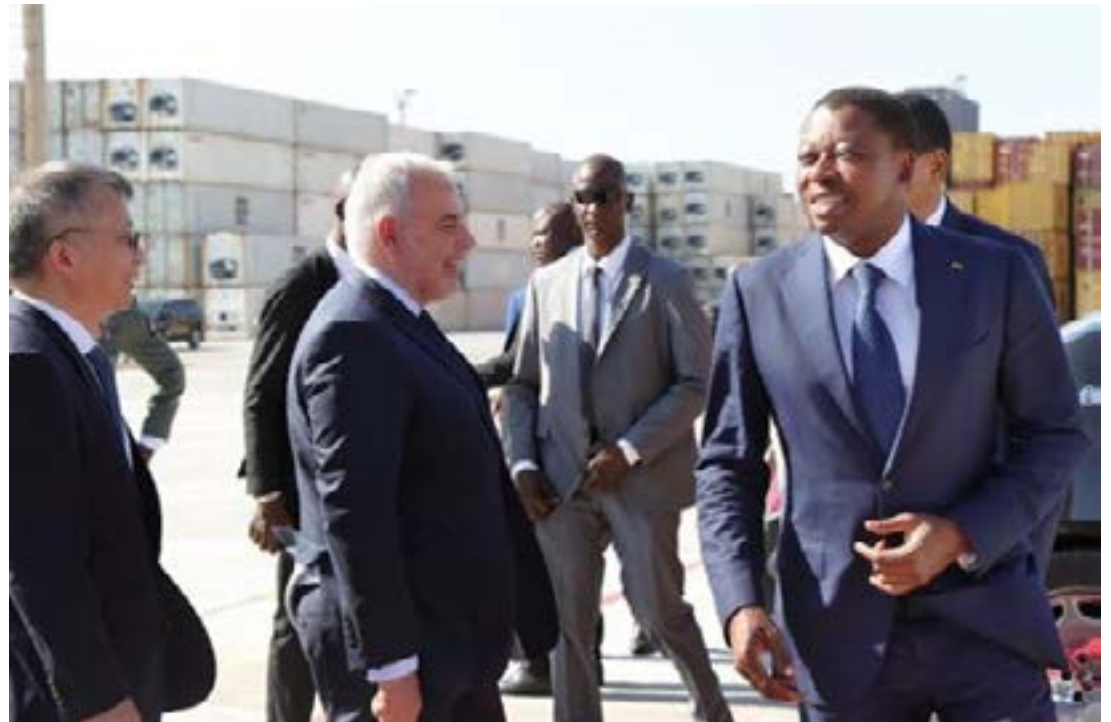
Faure Gnassingbé (à droite) et des partenaires au Port de Lomé

Au Togo, la taxe sur la plus-value de cession (TPV) a généré des recettes chiffrées à 1,5 milliard FCFA à fin octobre 2024, dépassant les prévisions initiales fixées à 1,3