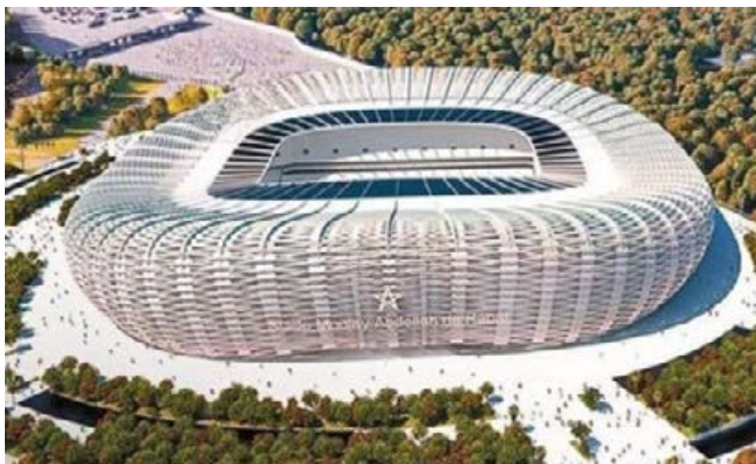
Un des stades de la CAN 2025

et le Soudan dans un groupe E intéressant. Et la Côte d'Ivoire, championne en titre, affrontera son vieux