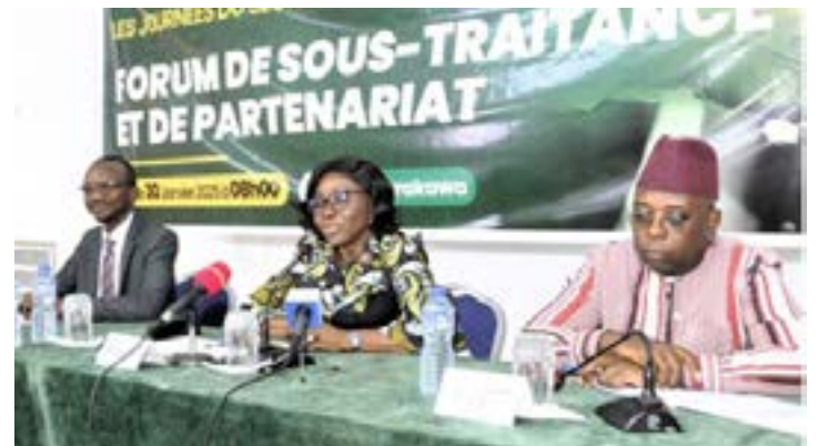
La 2ème édition des Journées du secteur privé

flux d'investissements directs étrangers atteignant 230 millions de dollars en 2022, le Togo démontre son potentiel de croissance. Il reste néanmoins un défi de