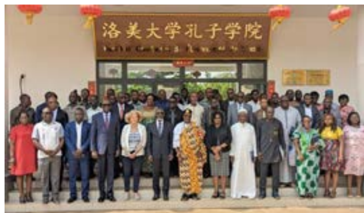
6ème session ordinaire du Comité consultatif national (CCN), doublée d'un colloque scientifique sur le foncier, tenue ce 31 janvier à l'Université de Lomé

Le projet LRAP, financé par la Millennium Challenge Corporation, s'inscrit dans une logique d'harmonisation et de transparence. Il vise à établir des textes d'application concrets pour le Code foncier adopté en 2018. Son ambition