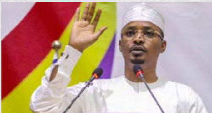
Mahamat Idriss Déby

Le 13e congrès du Mouvement patriotique du salut (MPS) s'est tenu ce mercredi au palais du 15, le palais des arts et de la culture de N'Djamena. Mahamat Idriss Déby, jusque-là président d'honneur, est désigné aujourd'hui président national du parti au pouvoir.