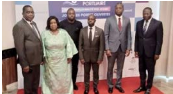
Gala de l'excellence portuaire à Lomé, les 30 et 31 janvier derniers