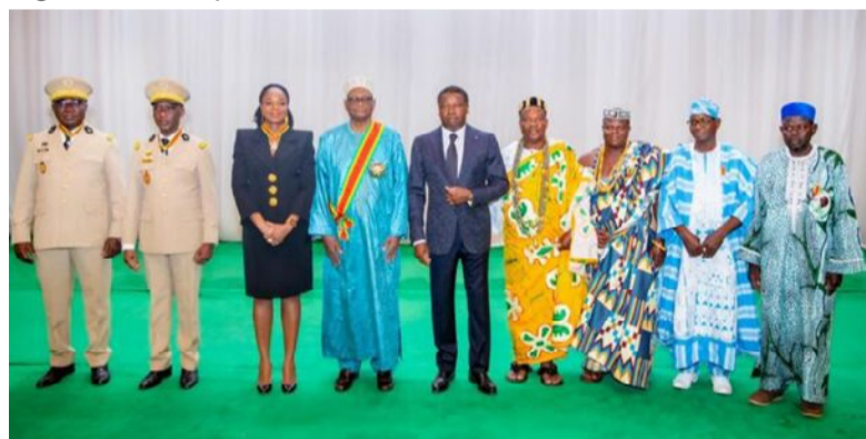
Le chef de l'Etat Faure Gnassingbé entourée des huit personnalités décorées

Plus qu'un père de famille, Feu Général Eyadema