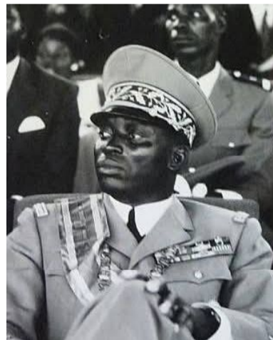
Le Général Gnassingbé Eyadema,

A la tête du Togo de 1967 à 2005, l'homme qui a