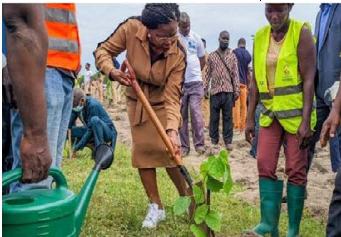
La PM Victoire Tomegah-Dogbé

Pour l'édition 2024, les cérémonies de remise de prix se sont tenues dans 5 régions du pays: les Plateaux, la Maritime, la Centrale, la Kara et les Savanes. Dans chacune de ces régions, plusieurs candidats ont été en lice, évalués selon des critères avant d'être sélectionnés pour les distinctions: la superficie reboisée, le