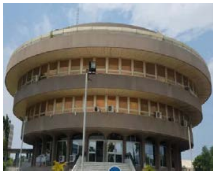
Centre administratif, économique et financier de Lomé

Cette opération renforce la position du Togo dans la recherche de financements durables. Depuis le début de l'année, le pays a déjà mobilisé 88 milliards FCFA, soit 26 % de l'objectif annuel de 332 milliards FCFA. Une performance qui illustre bien la nécessité de la mobilisation des ressources financières sur