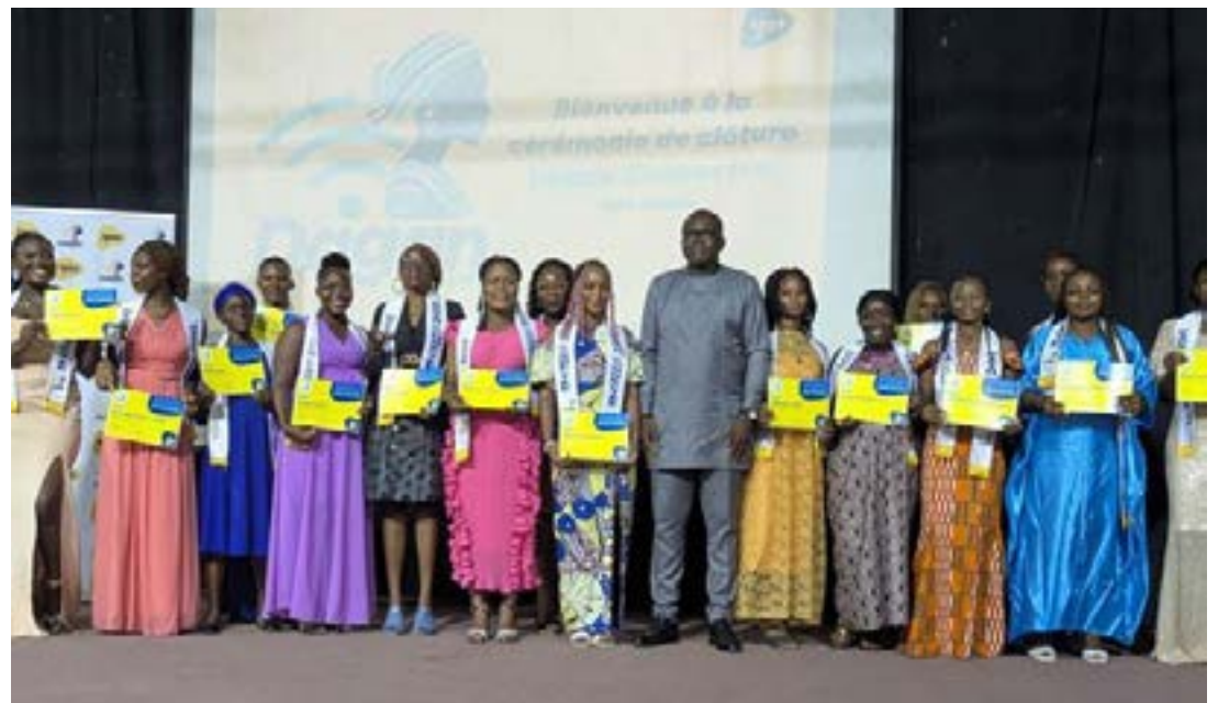
Remise des attestations aux différentes entrepreneures

Les participantes ont été formées sur des aspects variés du numérique : de l'usage des outils informatiques à la compréhension d'Internet et de ses enjeux sécuritaires. Mais aussi sur la communication, le