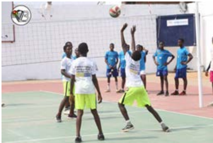
Match de volleyball

La Ligue des Savanes se distingue par le plus grand nombre d'engagements, avec un total de 10 équipes inscrites, suivie des Ligues Centrale et Grand Lomé, qui comptabilisent 9 inscriptions chacune. Ces chiffres témoignent de l'intérêt croissant pour cette discipline sportive dans le cadre scolaire. La compétition se déroulera en trois étapes : une phase préfectorale, suivie d'une phase régionale,