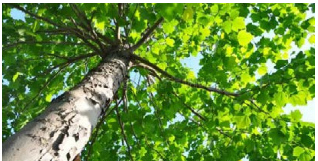
Protection de l'environnement

tête a été récompensé à hauteur d'un million FCFA pour le premier prix, 700 000 pour le deuxième et 500 000 pour le troisième. Les efforts conjugués des reboiseurs ont permis