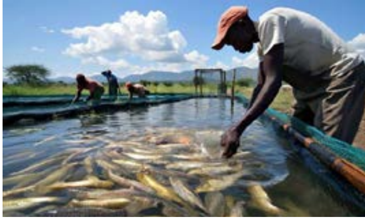
L'aquaculture souffre du dérèglement climatique

Une nouvelle étude publiée dans "Nature climate change" a révélé que le nombre de jours de canicule marine au cours des étés 2023 et 2024 a été près de 3,5 fois supérieur à celui de toutes les autres années enregistrées. Au cours des deux dernières années, le changement climatique, exacerbé par El Niño, a provoqué plusieurs vagues de chaleur marine record, qui ont causé des milliards de dollars de dégâts dans le monde entier.