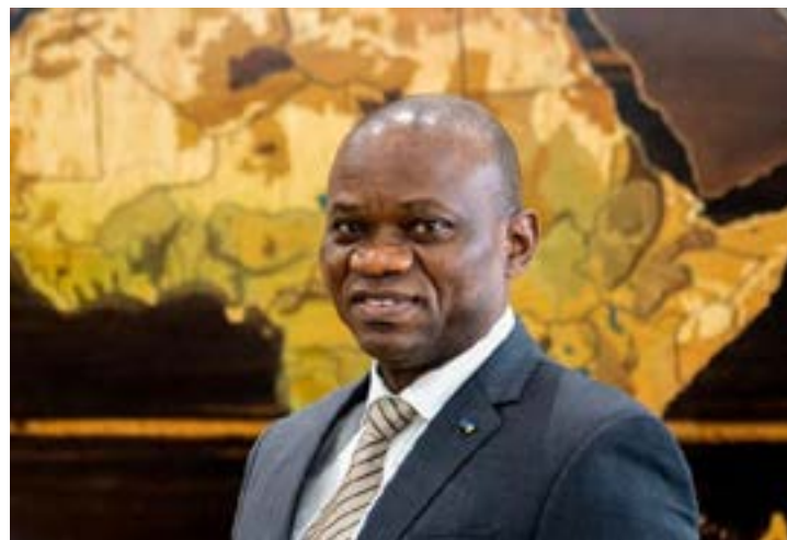
Brice Oligui Nguema, président de la transition du Gabon

vive controverse. Pour l'opposition, les règles du jeu ont été établies pour lui assurer une victoire sans véritable concurrence. « Tout a été taillé dès le départ pour lui permettre d'être candidat et surtout pour lui assurer la victoire. Il est à la fois l'arbitre