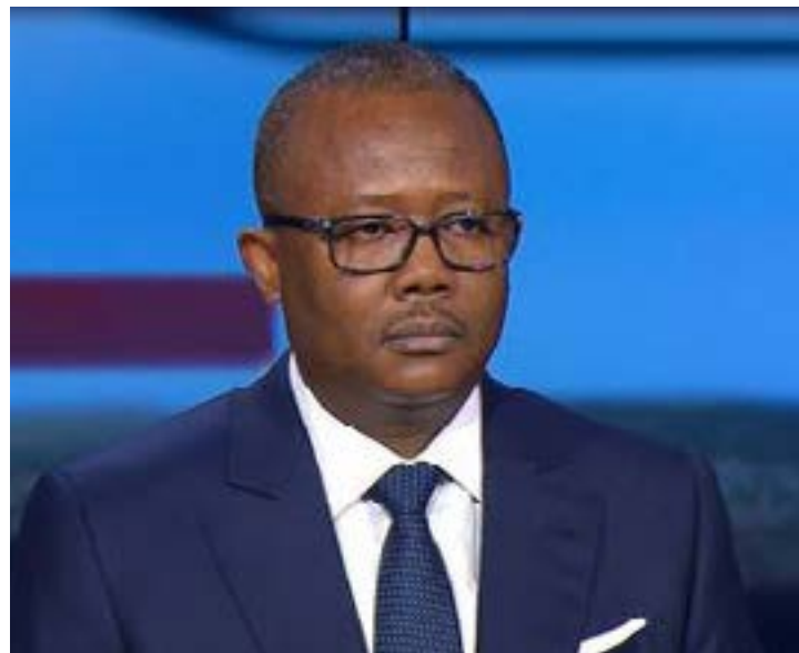
Président bissau-guinéen, Umaro Sissoco Embaló

chef de l'État à changer sa position en l'espace de quelques mois ? Pressions politiques internes ? Contexte géopolitique régional ? Ou volonté de préserver son