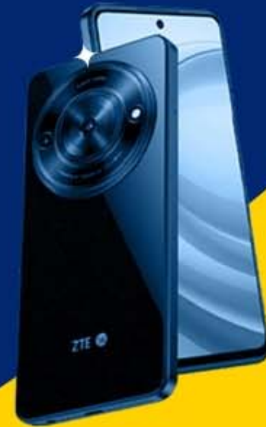
ZTE BLADE A75