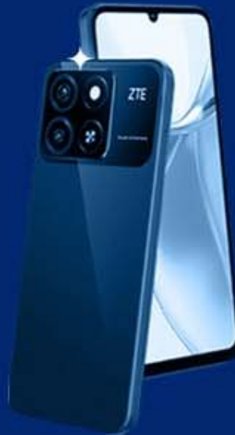
ZTE BLADE A35