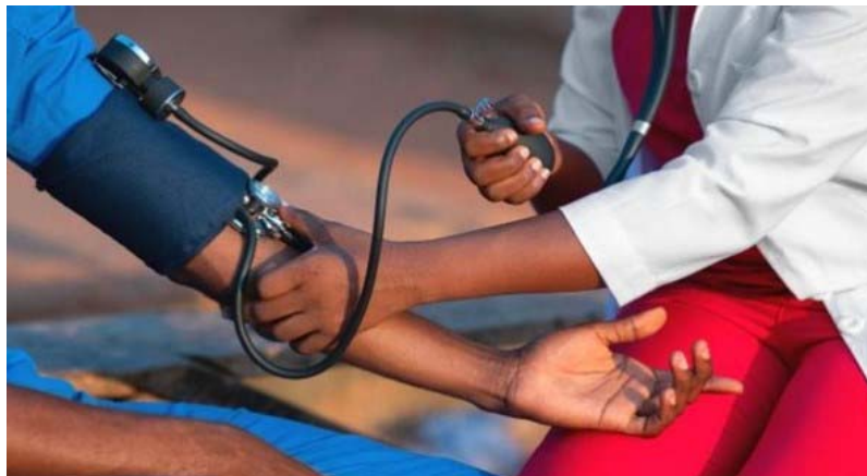
Un médecin au chevet d'un patient

Au Togo, pour y faire face, le gouvernement déploie des stratégies de prise en charge améliorée. La progression de ces maladies s'explique par plusieurs facteurs. Ce sont entre autres l'évolution des modes de vie, avec une alimentation déséquilibrée, la sédentarité et la consommation excessive de sel, de