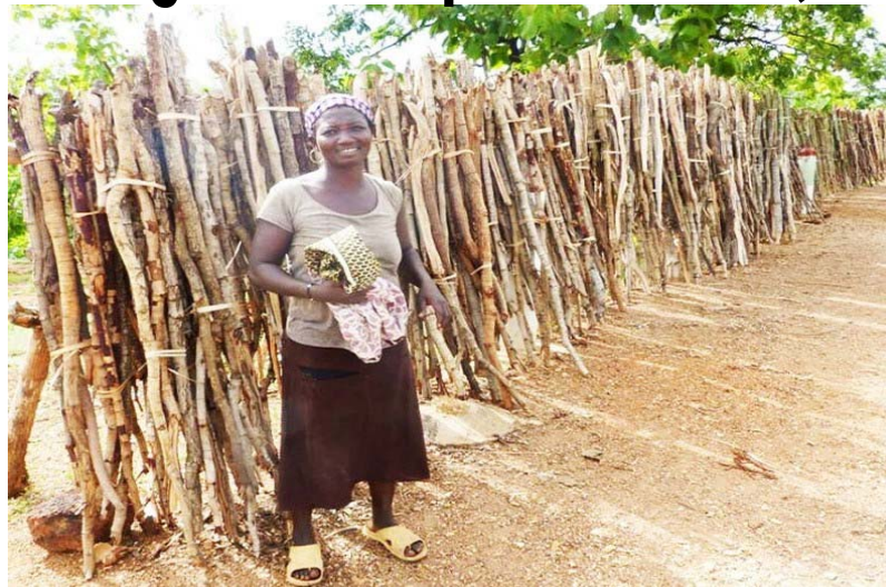
Une paysane

A contrario, les produits qui ont fait fléchir le niveau général des prix en février 2025 sont : "Oignon frais rond" (-38,4%) ; "Adème" (-17,8%) ; "Gombo frais" (-9,2%) ; "Riz local longs grains vendu au bol" (-3,0%) ; "Maïs jaune vendu au bol" (-6,6%) ; "Saloumon fumé" (-4,9%) ; "Huile d'arachide artisanale" (-4,2%) ; "Feuilles d'oseille" (-23,7%) ; "Oeuf frais de poule de race" (-17,9%) ; "Tomates rondes (pomme) locales" (-9,2%) ; "Gboma" (-8,7%) ; "Avocat" (-8,1%) ; "Concentré de tomate" (-2,0%) ; "Noix de palme (décou)" (-17,6%) ; "Tomates rondes (pomme) importées" (-8,6%) ; "Gari (farine de manioc)" (-3,8%) ; "Piment rouge frais" (-10,7%) ; "Tomates ovales importées" (-8,8%) ; "Mouton vivant" (-7,8%) et "Masque - cache nez (jetable) contre le covid 19" (-7,4%).