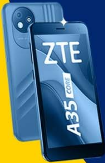
ZTE BLADE A35 CORE