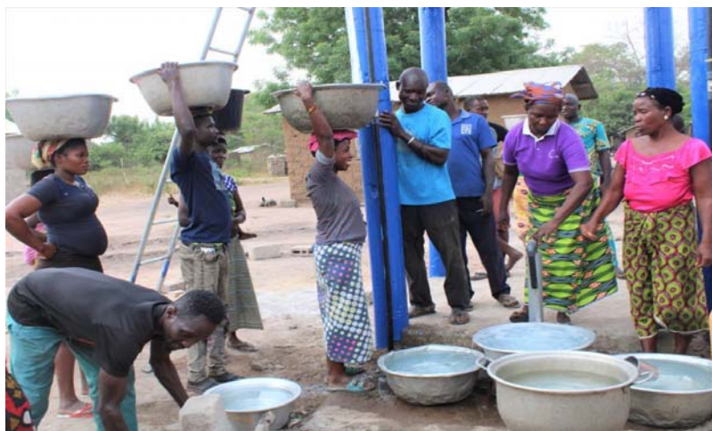
De l'eau potable pour tous

À terme, selon les indications des pouvoirs publics, le Passco 3