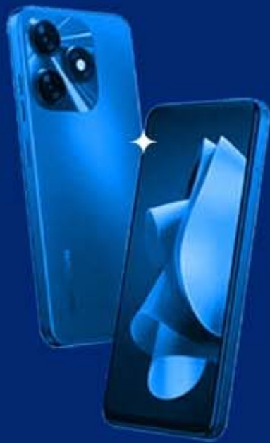
TECNO SPARK 20