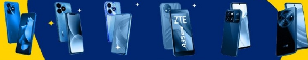
TECNO SPARK 20