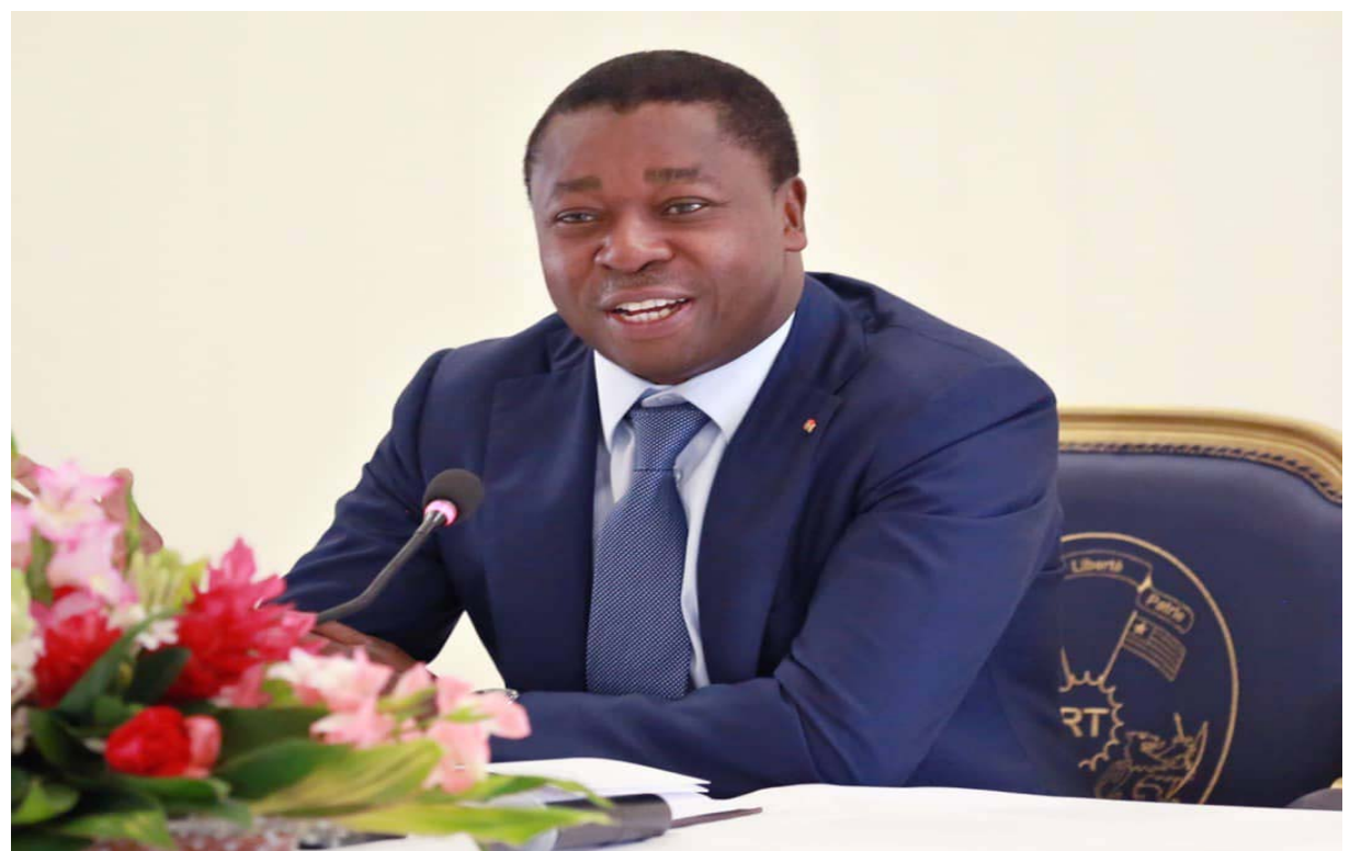
Faure Essozimna Gnassingbé, Président de la République

L'objectif visé est d'accroître de façon constante l'accès aux services d'approvisionnement en eau et d'assainissement et leur qualité, améliorer la performance opérationnelle du fournisseur des services d'eau potable et optimiser la gestion des ressources en