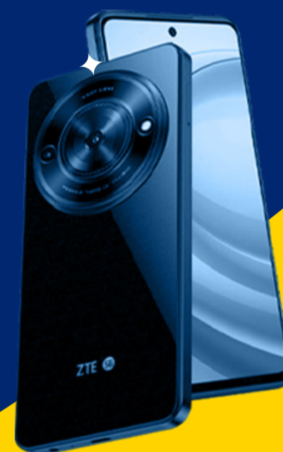
ZTE BLADE A75