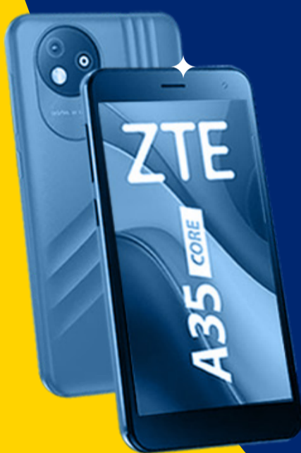
ZTE BLADE A35 CORE