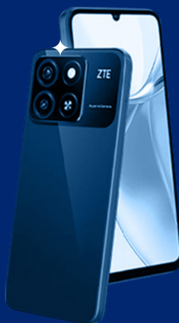
ZTE BLADE A35