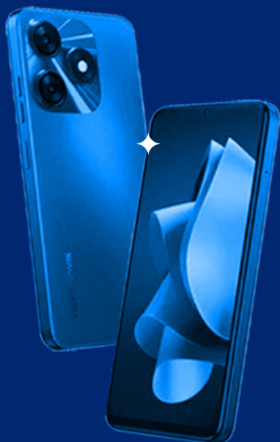
TECNO SPARK 20