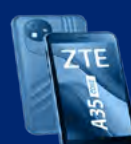
ZTE BLADE A35 CORE