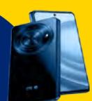
ZTE BLADE A75