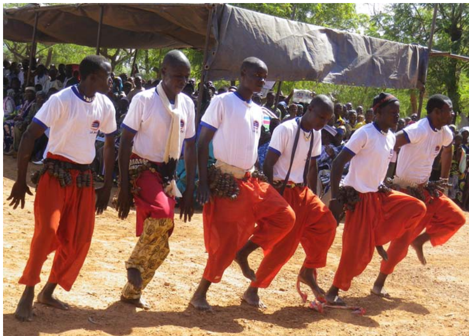
Quelques groupes folkloriques dont le groupe “Bontana” de Kpendjal ...