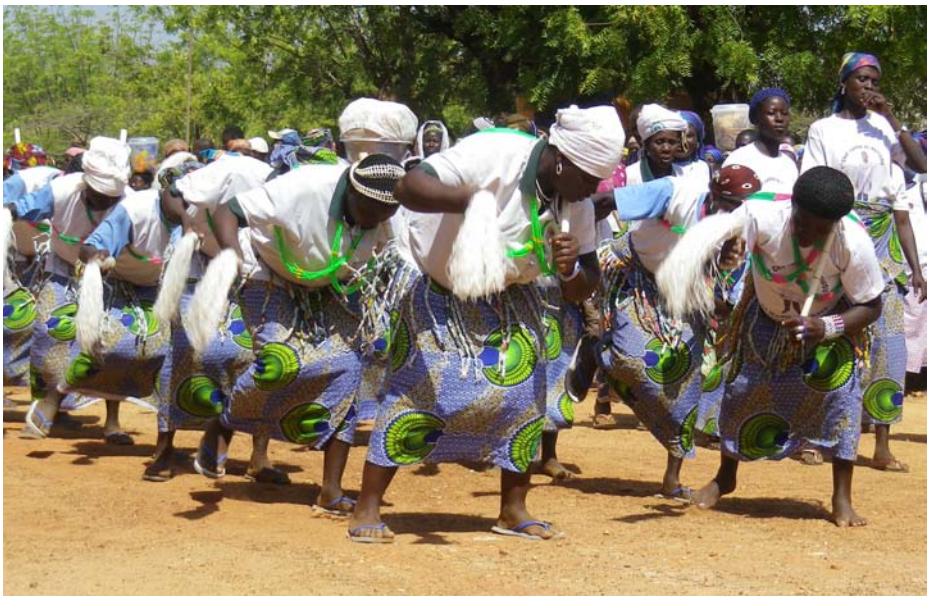
... et le groupe “Kompossiak” de Tône