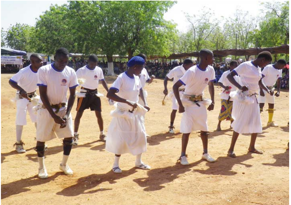
Ici, le groupe folklorique “Talkoutke” de Tendjoaré