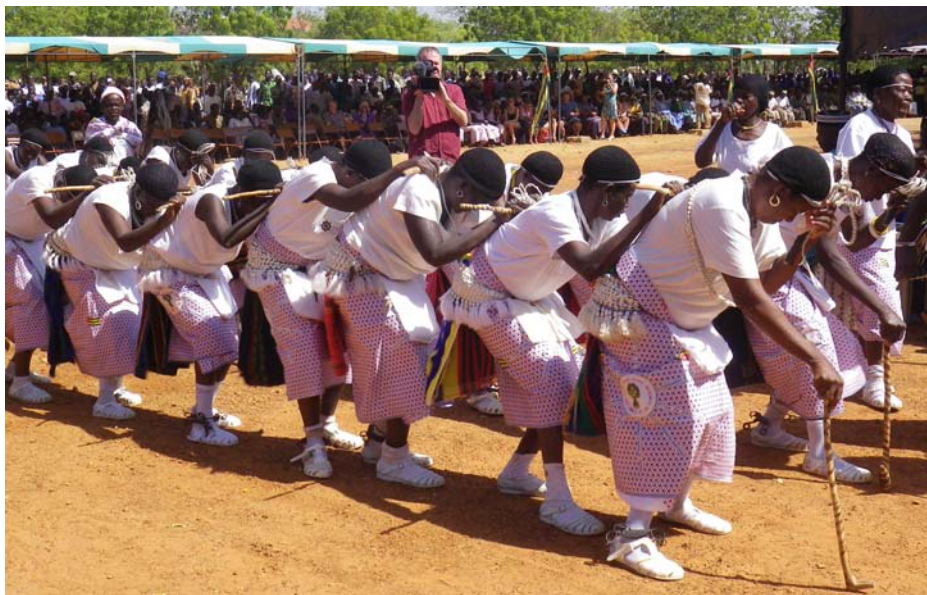
... et le groupe folklorique “Kompossiak Bignoté” de Lotogou dans Tône