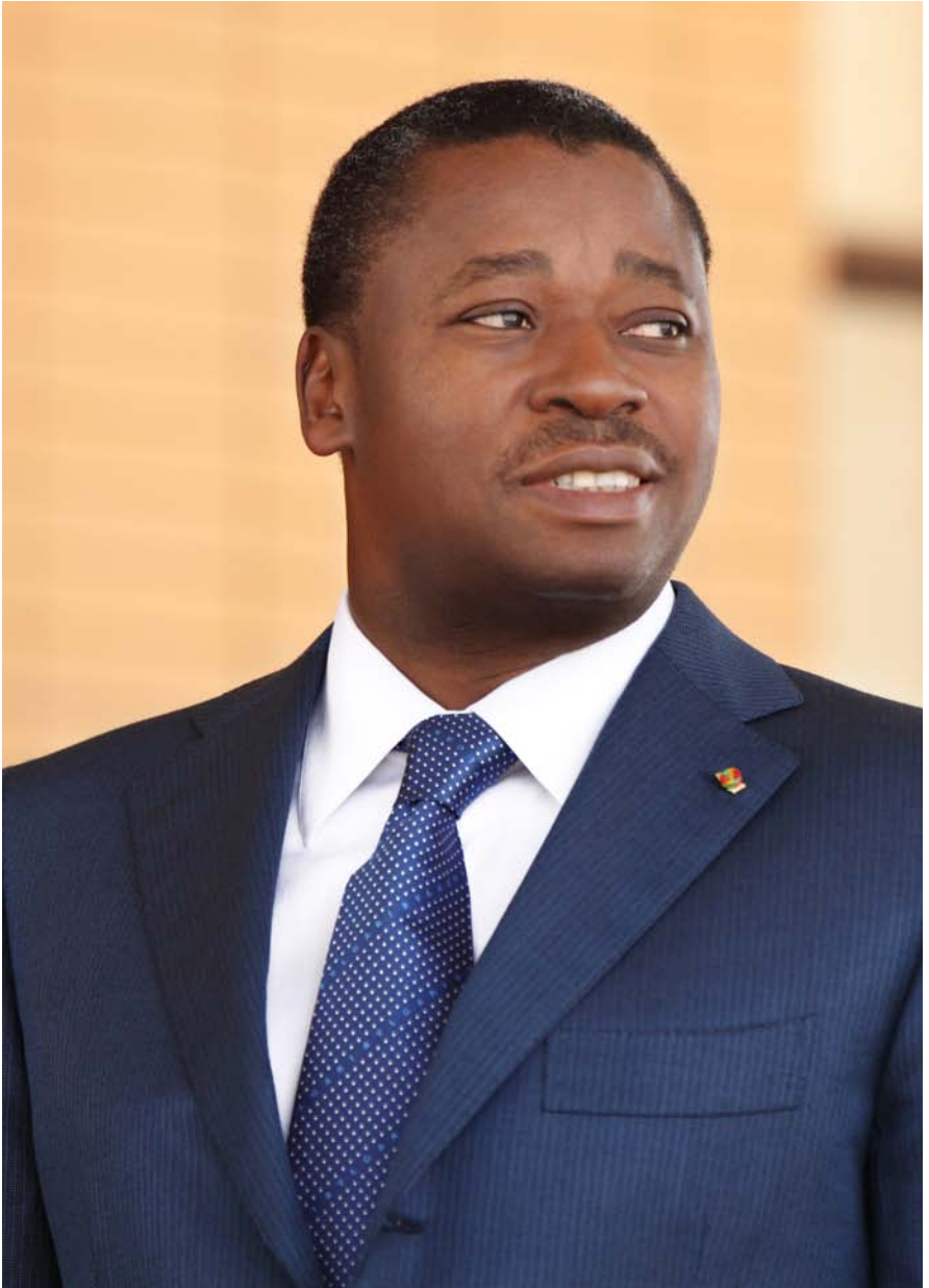
SON EXCELLENCE FAURE ESSOZIMNA GNASSINGBE PRÉSIDENT DE LA RÉPUBLIQUE TOGOLAISE