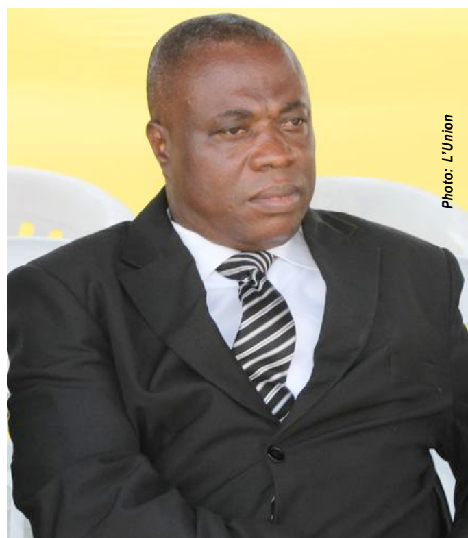
Komlan Nunyabu, Ministre de l'Urbanisme

Il s'agira pour l'entreprise adjudicataire de sécuriser les lieux par la construction d'une clôture en fil de fer et d'une guérite de surveillance. Après des travaux confortatifs du bassin, il sera construit un bloc administratif et d'une bibliothèque publique. Sur un espace gazonné bien aménagé, il sera érigé un bar-restaurant et des sanitaires pour les éventuels visiteurs de l'Espace vert d'Agbalépédogan, où parents et enfants pourront venir se récréer. Officiellement, au plus tard en février ou mars prochain, l'on doit pouvoir jouir d'un espace comme en trouve dans la plupart des pays, qui aide à combattre le stress. Lomé en manque terriblement. Malgré un plan directeur de la ville, les autorités courent sans jamais rattraper un développement des plus rapides et anarchiques de