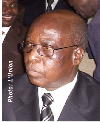
Adji Ayassor, Ministre de l'Economie et des finances

La prévision annuelle des dépenses d'investissement ordonnancées sur ressources externes se chiffre à 183,5 milliards