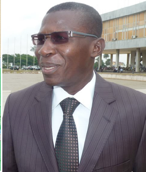
Ninsao Gnofam, Ministre des Travaux Publics

de Lomé et relie le cœur au nord de la capitale, celle de Maman N'Danida est de loin la plus fréquentée. Aussi, dans la perspective du réaménagement du boulevard Eyadéma, le tronçon sera construit au départ de la Colombe de la Paix en deux chaussées de deux fois trois voies, affirme le ministre des Travaux publics. En outre, ajoute-t-il, le giratoire de la Colombe sera également réaménagé en deux fois trois voies en vue de l'élimination