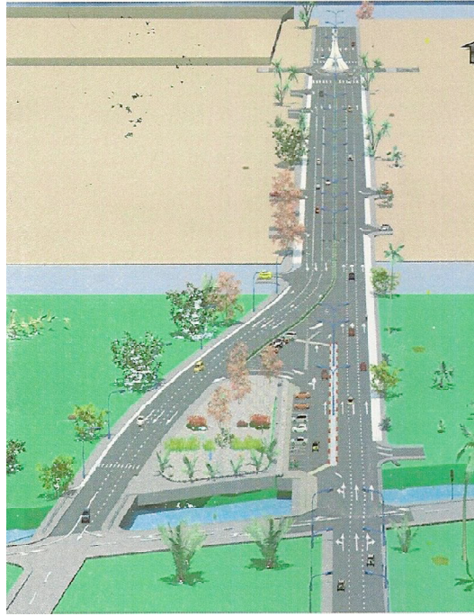
Le plan du nouveau boulevard Maman N'Danidaha

Il est à constater que parmi les six voies qui enjambent le plan d'eau