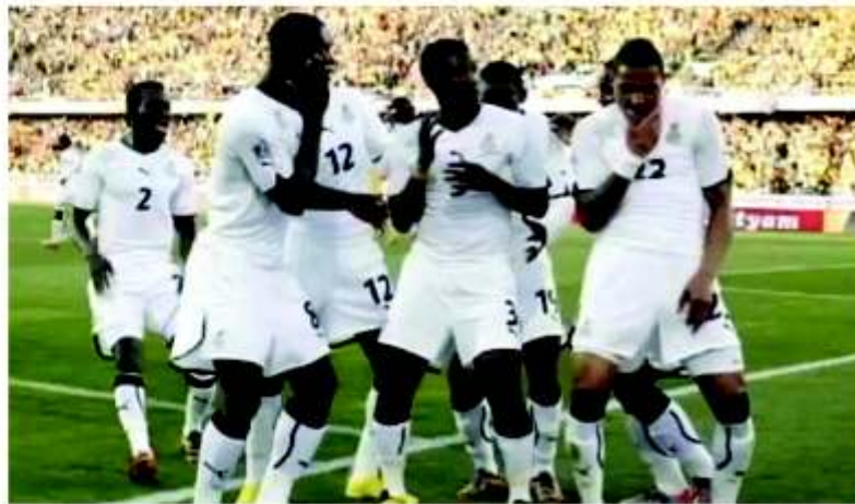
Les Black Stars du Ghana

pourtant, nul ne pariait sur cette grosse performance des Ghanéens habitués depuis un certain moment à la Coupe du Monde. Le Ghana est à un petit pas de Rio car, il est moins sûr que l'Egypte même à domicile puisse renverser la vapeur, surtout avec l'appui des cadors de cette sélection appelés à la res-