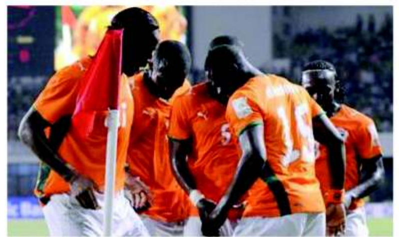
Les Eléphants de la Côte d'Ivoire

cousse. L'effet, Essien, André Ayew, Assamoah Gyan, Suley Muntari pour ne citer que ceux là, aura été positif et salutaire pour "les brésiliens d'Afrique". Le Nigéria dans la peau du roi D'Afrique n'a nullement ressenti de la peine devant une formidable sélection éthiopienne prise au dépourvu chez elle (2-1). La course