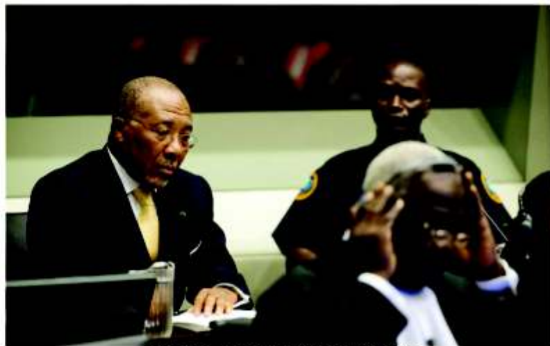
Charles Taylor lors du procès

Dès lors, se pose la question du pays dans lequel le seigneur de guerre libérien purgera ses peines. Après plus de deux années de tractations, un accord a été finalement trouvé entre le Pays-Bas et la Grande Bretagne qui a finalement accepté l'offre. Ainsi donc, Charles Taylor passera les cinquante prochaines années à Londres où il a d'ailleurs été transféré depuis mardi dernier. Ce, malgré les réticences de l'intéressé. En début du mois, Charles Taylor a, dans une lettre adressée à la CPI, souhaité purger ses peines au Rwanda pour, dit-il, « être proche de sa famille ». En outre,