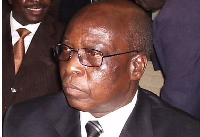
Adji Otèth Ayassor, Ministre de l'Economie et des Finances

Et, dans la foulée, le ministre Ayassor lance un avis d'appel à candidatures pour le recrutement des agents aux vingt (20) postes de responsabilité ci-après : cinq (5) directions d'appui rattachées au Commissaire Général (Direction du Bureau Anti-corruption ; Direction de l'Audit interne et de l'Assurance Qualité ; Direction de la Communication et des Services aux Usagers ; Direction des Etudes et de la Planification Stratégique ; Direction des Finances) ; deux (2) services du Bureau Exécutif du Commissaire Général (Assistant Administratif ; Secrétaire de Direction) ; quatre (4) directions rattachées au Commissaire des Douanes (Direction des Opérations douanières du Golfe ; Direction des Opérations douanières régionales ; Direction de Renseignement et de Lutte contre la Fraude ; Direction des Etudes et de la Législation) ; six (6) directions rattachées au Commissaire des Impôts (Direction des Grandes Entreprises ;