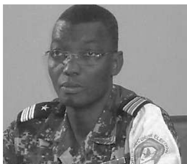
Col. Yark Damehame, ministre de la Sécurité et de la Protection Civile

Yark a tenu à faire le point et à prendre de nouveau, des dispositions plus coercitives contre les commerçants du Boudè. Toujours préoccupé par le sort et le mieux-être de ses concitoyens, le ministre a insisté sur la nécessité de sévir plus vigoureusement pour anéantir à jamais la