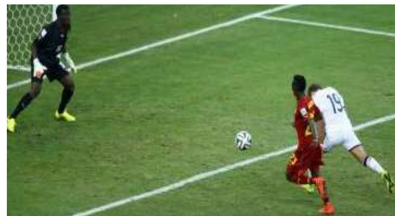
Mario Götze ouvre la marque pour l'Allemagne sur une passe millimétrée de Thomas Müller (51e).

Mais trois minutes plus tard, Andre Ayew, formidable joueur de tête et formidable guerrier qui avait dit être "prêt à mourir pour la nation", trompait Neuer