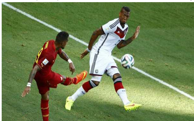
Le Ghanéen Kevin Prince Boateng face à son frère Jerome Boateng, lequel évolue sous le maillot allemand.

Tout reste donc possible dans ce groupe G et Klose a lui un destin à accomplir: devenir le seul au sommet des buteurs.