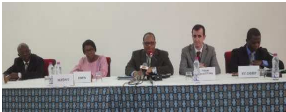
La table d'honneur

Après une année de mise en œuvre de la stratégie de croissance accélérée et de promotion de l'emploi(SCAPE) les acteurs du développement ce sont retrouvés en atelier national les 17 et 18 juin dernier à l'hôteleda oba où ils ont puis examinés et validés le 1er rapport-bilan de mise en œuvre de la Stratégie de Croissance Accélérée et de Promotion de l'Emploi (SCAPE) pour l'année 2013.