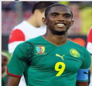
Samuel Eto'o, capitaine des Lions "domptés"

caines que l'on croyait perdues refont surface, le Cameroun aura bu le calice jusqu'à la lie. Le Nigeria peut tirer son épingle du jeu tandis que le Ghana a sa destinée entre ses mains. L'Algérie nous surprendra joliment. Quant aux Camerounais, ils regarderont le reste de la compétition devant leurs petits écrans. Tout ça pour ça ?