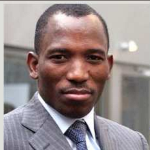
Le ministre Gilbert Bawara

Bodjona et ses avocats rompent le silence