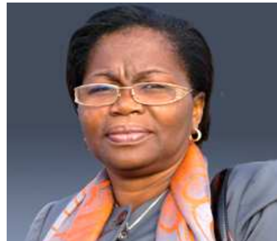
La ministre Victoire Tomégah-Dogbé

La mise sur pied d'une Agence va certainement permettre de garantir un financement dans la durée et une pérennisation institu-