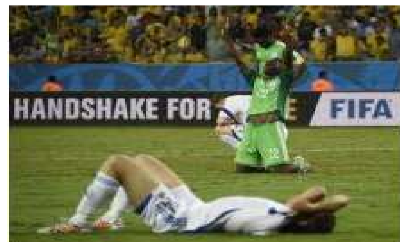
Les Nigériens célébrant la victoire de leur équipe face à la Bosnie en Coupe du Monde.

Bizarrement, les joueurs de Safet Susic se sont précipités pour revenir au score, gâchant leur finition et accumulant les mauvais choix, alors qu'ils étaient techniquement supérieurs aux champions