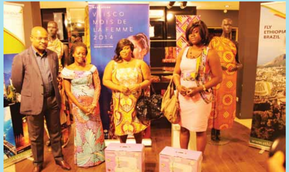
Le directeur de VAC-TOGO (extrême gauche)