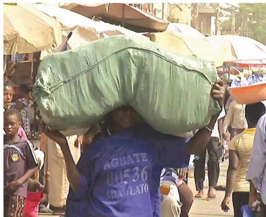
Une portefaix transportant un ballot

«On aurait bien aimé avoir une balance pour peser les ballots et fixer le prix en conséquence. Malheureusement le prix se fait de façon arbitraire et cela ne va pas souvent à notre avantage. On est obligé d'accepter