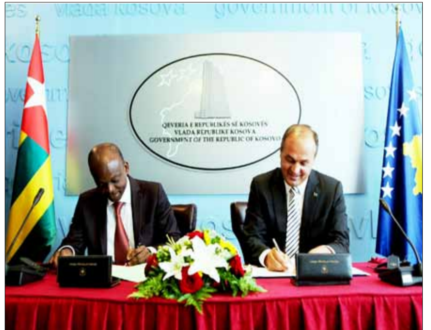
M. DUSSEY (à gauche) et M. Enver HOSHAJ lors de la signature

Selon le Ministère togolais des Affaires Etrangères, ce nouvel Accord participe de la diplomatie