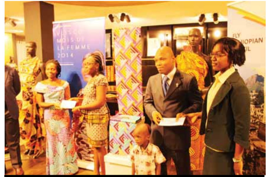
Le couple gagnant recevant les billets pour le Brésil