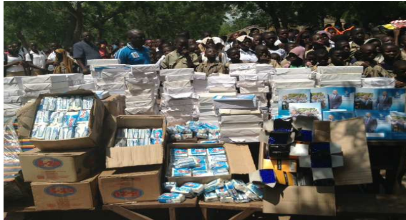
Lot de kits scolaires et du savons

Comme on le sait, la période des rentrées scolaires sont toujours difficiles pour les parents d'élèves. La NJSPF et son président se sont sentis interpellés et ont pris la peine de venir en soutien à ses populations démunies dans la vision du Chef de l'Etat dans sa vision d'amélioration des conditions de vies des togolais.