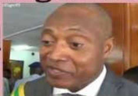
Jean-Pierre Fabre, chef de file de l'opposition

SOCIÉTÉ / ÉDUCATION : La Nouvelle Jeunesse pour le Soutien au Président Faure (NJSJPF) aux côtés des élèves et des parents pour la nouvelle rentrée scolaire P.6