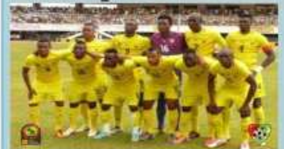
Les Eperviers du Togo

QUALIFICATIONS CAN 2015 / OUGANDA-TOGO : Matthieu Dossevi forfait pour blessure P.1