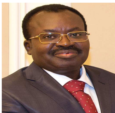
Le PM Ahoomey-Zunu

Ils étaient là depuis la période glorieuse de Rock Gnassingbé ou le Togo a connu sa toute première campagne mondiale avec les scandales de Wangen. Ce sont les mêmes qui se