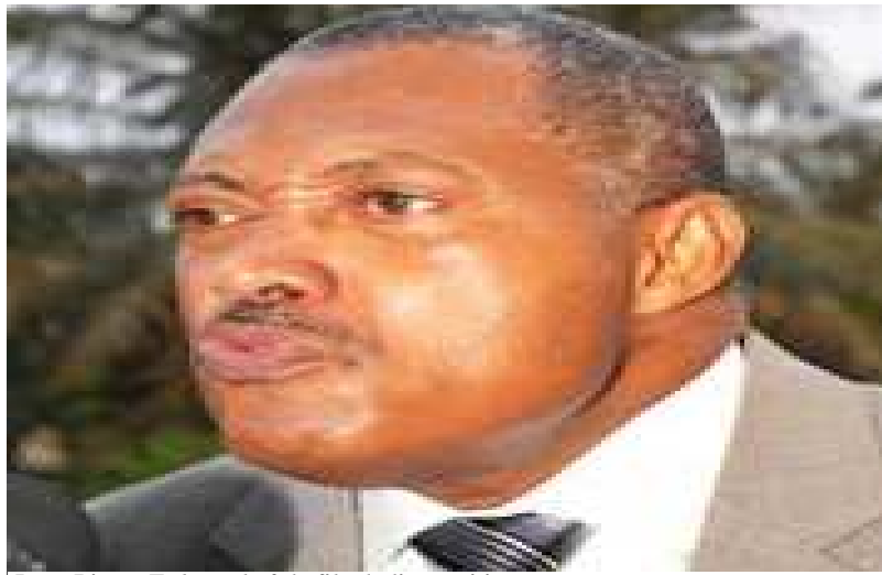
Jean-Pierre Fabre, chef de file de l'opposition

tremblement de terre, Jean-Pierre Fabre va être investi comme le candidat de l'Alliance Nationale pour le Changement (ANC) à l'élection présidentielle de 2015. Il mettra ainsi un terme à la propension unitaire de l'opposition que certains leaders de l'opposition s'efforcent encore de promouvoir. Connaissant les habitudes de la "maison orange", il est indéniable que l'ANC va se la jouer solo pour des résultats connus d'avance, qui une fois encore va lui permettre de marcher, même courir dans les rues de Lomé aux lendemains de l'élection présidentielle.