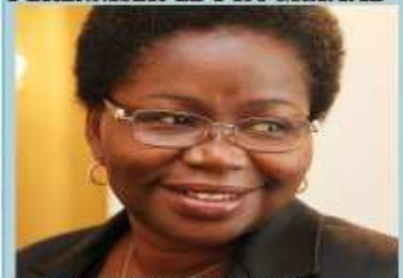
La ministre Victoire Tomégah-Dogbé

POLITIQUE/JEUNESSE : ESSAI GAGNANT DU PROVONAT, LE GOUVERNEMENT VEUT PÉRENNISER LE PROGRAMME P.5