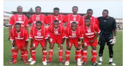
Les Guerriers de Tchououjo, nouveau champion de la D1?

FOOT TOGO: SEMASSI ET ANGÈS À UNE JOURNÉE DU TITRE, AS DOUANES RELÉGUÉ