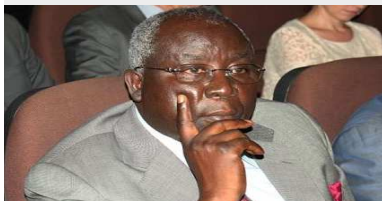
Aboudou Assouma, président de la Cour Constitutionnelle

Les représentants des églises évangéliques, presbytériennes et méthodistes ont lancé mercredi dernier un appel demandant au gouvernement de rouvrir des discussions en vue de réformes institutionnelles et constitutionnelles avant la présidentielle de 2015.