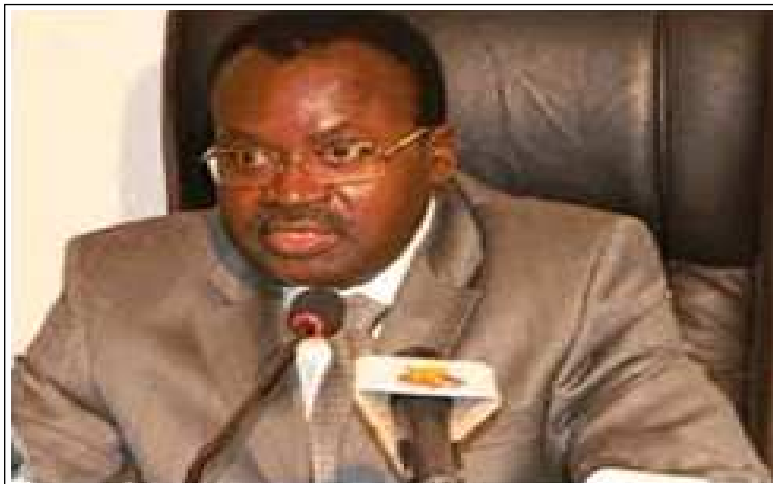
Ahoomey-Zunu Séléagodji, chef du Gouvernement

L'un des facteurs du phénomène de la vie chère dans le monde reste inéluctablement la hausse des prix des produits pétroliers. Depuis quelques années le prix du baril du pétrole ne cesse de grimper jusqu'à atteindre le pic de 115 dollars US.