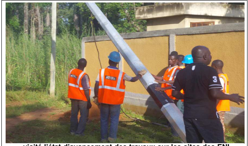
...visité l'état d'avancement des travaux sur les sites des ENI.

Djarkpanga : le Chef de l'Etat a tenu sa promesse !