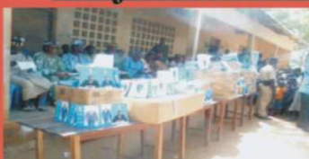
Vue partielle du lot de fournitures scolaires par le Chef de l'Etat

Des fournitures scolaires aux élèves en difficultés