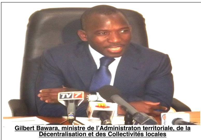
Gilbert Bawara, ministre de l'Administration territoriale, de la Décentralisation et des Collectivités locales