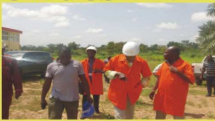
La délégation de la CEET, au milieu le DG Djétéli