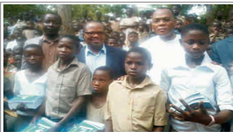
Les bénéficiaires posant avec des cadres du milieu