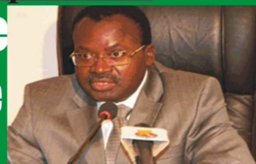
Ahoomey-Zunu Séléagodji, chef du Gouvernement

Extension du réseau électrique en cours :