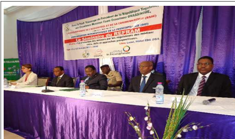
La table d'honneur à l'ouverture des travaux du séminaire. Au milieu, on reconnaît le PM Ahoomey-Zunu Séléagodji

Les présidents des institutions de régulation des médias de onze pays membres du Réseau francophone des régulateurs des médias (REFRAM), se sont réunis à Lomé les mardi et mercredi derniers, afin de réfléchir sur les rôles, défis et approches prospectives des régulateurs des médias, face aux dangers que représentent certains programmes audiovisuels pour la protection des mineurs.