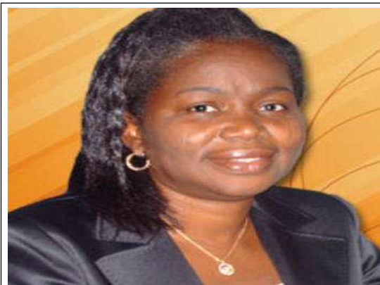
La ministre Dogbé, du développement à la base

La ministre du Développement à la Base, de l'Artisanat, de la Jeunesse et de l'Emploi des Jeunes a présidé le 16 octobre dernier à l'hôtel Sancta Maria à Lomé en présence de plusieurs invités une cérémonie solennelle placée sous le thème " Cap sur l'inclusion financière au Togo".