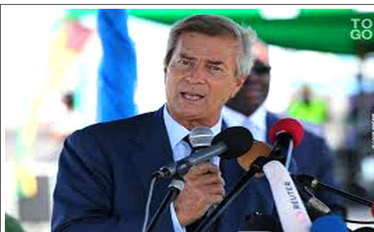
Vincent Bolloré, PDG du Group BOLLORÉ

La société vient d'injecter deux milliards de francs CFA pour l'amélioration des activités du parc à bois au port de Douala.