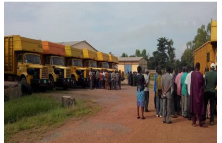
Des camions prêts au chargement du coton

Sur le plan industriel, la révision des usines est terminée. Le parc auto termine les dernières révisions. Dans ce cadre, les chefs Divisions Parc et les chauffeurs ont eu à