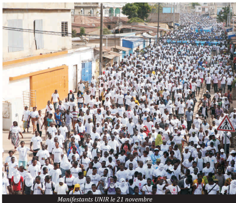
Manifestants UNIR le 21 novembre

Les associations soutenant les efforts et la politique du Président de la République ont organisé une grande marche. Dénommée « marche des forces vives de la nation pour la protection de la constitution et des institutions de la République Togolaise », cette manifestation des associations