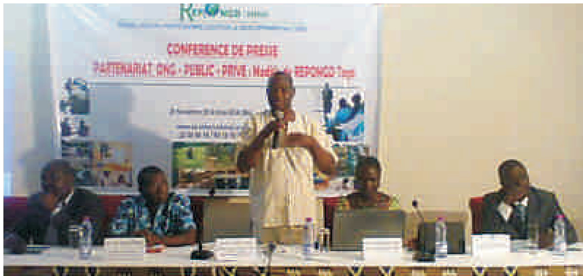
Plate-forme des organisations non gouvernementales œuvrant dans le domaine du développement socio-économique durable du Togo, le Réseau des ONG Professionnelles pour le Développement du Togo (REPONGD-TOGO) prône le professionnalisme, les bonnes pratiques, la bonne gestion et la bonne gouvernance, le partenariat, le changement de comportement et l'échange entre elles et tous les partenaires de développement du Togo dans une approche inclusive pour la réduction de la pauvreté.

En conférence de presse à Lomé, la semaine dernière, ce réseau, en partenariat avec l'ONG Social Entrepreneurs International (SE INTL TOGO) s'est longuement expliqué sur le modèle de partenariat qu'il compte établir avec le secteur public et privé au Togo. Pour eux, en effet, SE Intl et ses partenaires de REPONGD voudraient collaborer avec, d'une part, les autorités gouvernementales et locales, et d'autres parts, les sociétés privées, les PME/PMI, les établissements financiers, dans un cadre de partenariat gagnant-gagnant pour le développement durable du Togo. Concrètement, SE Intl, en partenariat avec le secteur public et privé se propose d'effectuer de façon pérenne des renforcements de capacités et