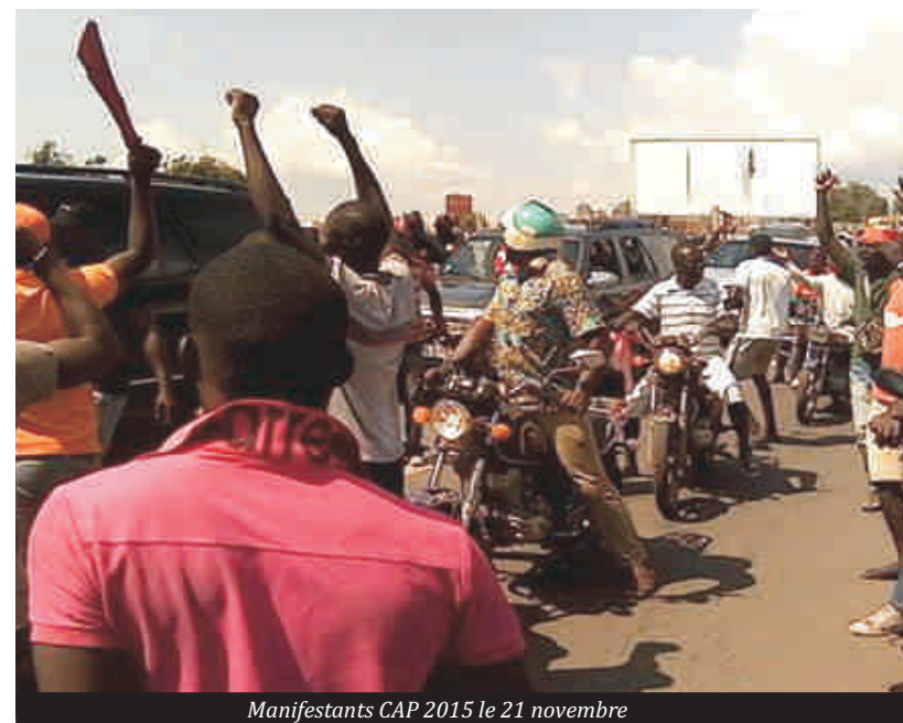
Manifestants CAP 2015 le 21 novembre

affiliées au parti UNIR avait pour objectif de signifier leur désapprobation aux manœuvres dilatoires d'une partie de l'opposition Togolaise en perte de repère.