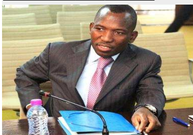
Le ministre Gilbert Bawara

La semaine dernière, les responsables de la Céni (Commission électorale nationale indépendante) avaient imputé au gouvernement, notamment, le report du processus de révision des listes électorales en raison de l'absence de moyens financiers.