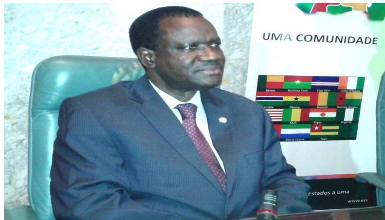
Kadré Désiré Ouédraogo, Président de la Commission de la CEDEAO

Tous les intervenants ont reconnu et félicité les efforts déployés par le chef de l'Etat togolais Faure Gnassingbé en sa qualité de coordinateur de la lutte contre Ebola dans la sous-région.