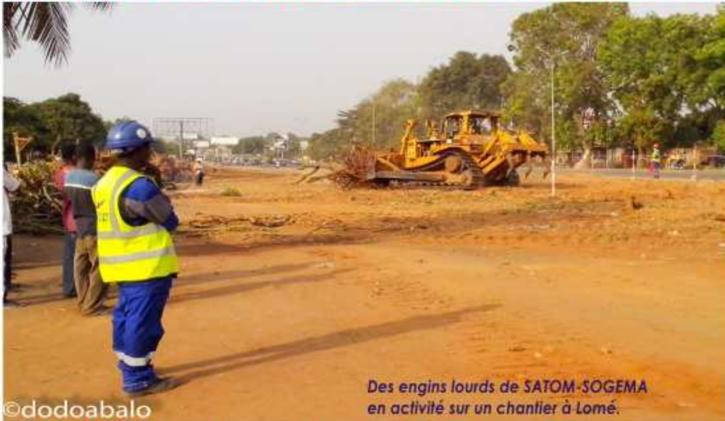
Des engins lourds de SATOM-SOGEA en activité sur un chantier à Lomé.