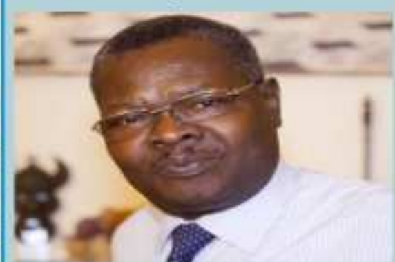
Agbéyomé M. Kodjo