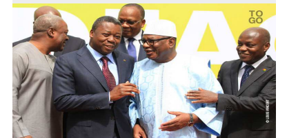
Faure et ses pairs africains à Abuja

FAURE GNASSINGBÉ À ABUJA POUR LE SOMMET DE LA CÉDEAO