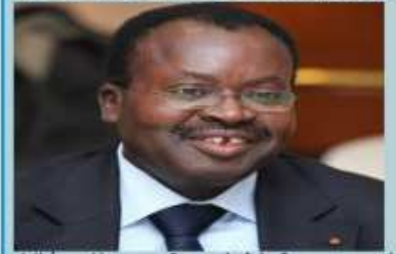
Arthème Ahoomey-Zunu, chef du Gouvernement