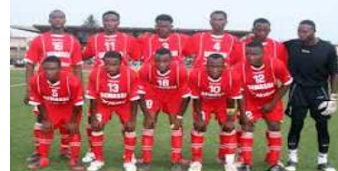
Les Guerriers de Tchaoudjo, champion du Togo

MATCH AMICAL: HEARTS OF OAK TIENT EN ÉCHEC SEMASSI