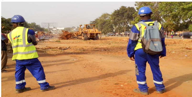
Des engins lourds sur le chantier sous les yeux des agents de la SATOM

Les documents fournis par le ministère des travaux publics indiquent que le lot N°1 concernent donc le Boulevard des armées (3,035 Km) dont les travaux seront exécutés pendant 12 mois par la société CECO-BTP pour un montant total de 4.827.794.877 F CFA hors taxes, 5.696.797.955 F CFA TTC. Ils seront financés à 78,94% du montant Hors Taxes par la Banque Ouest Africaine de Développement (BOAD). Le gouvernement togolais apportera sa contribution à hauteur de 21,06%. La voie concernée va des feux tricolores