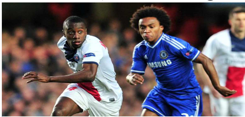
Duel blaise Matuidy (PSG) et Marcelo de Chelsea

PARFUM DE revanche dans l'air lorsque le PSG retrouvera Chelsea en février prochain pour le match aller des huitièmes de finale de la Ligue des champions de l'UEFA. C'est le verdict du tirage au sort effectué ce lundi à Nyon en Suisse. Les deux clubs s'étaient déjà retrouvés en quarts de finale la saison dernière avec un succès des Anglais.