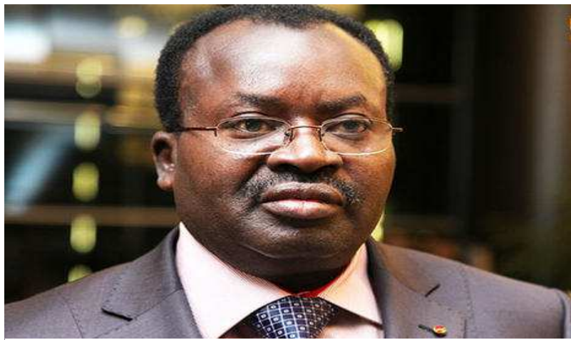
Arthème Séléagodji Ahoomey-Zunu, chef du Gouvernement

La différence revient à 450 f CFA qui ne peuvent payer que quelques centilitres du précieux liquide. Pour le Gasoil, n'en parlons même pas. Effarant ! Autant dire que pour les motocyclistes qui font le plein de leur