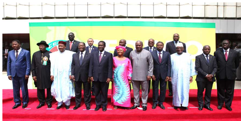
Des Chefs d'Etat et de Gouvernement présents au 46ème Sommet de la CEDEAO

Le Conseil des ministres a aussi examiné le rapport annuel 2014 du président de la Commission de la CEDEAO, Kadré Désiré Ouédraogo,