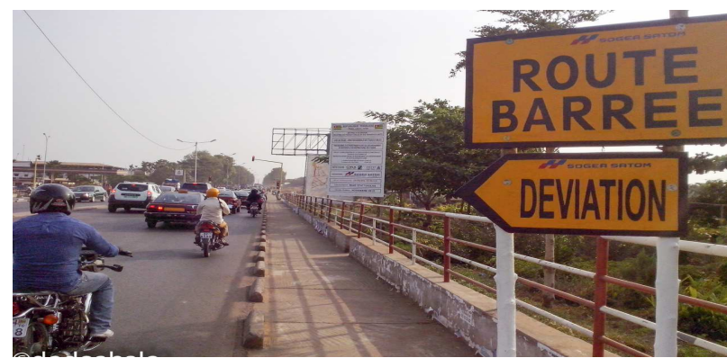
Indication de la déviation sur le tronçon Todman-Protestant

Pour le lot N°2 composé de l'Avenue de la victoire et du RPT, en plus de l'Avenue Augustino de Souza, il est confié à la société SOGEA-SATOM pour un montant total de 11.412.167.729 F CFA Hors Taxes, 13.466.357.920 F CFA TTC. La BOAD finance le projet à hauteur de 78,94% du montant Hors taxes, le gouvernement apportant le reste du financement soit 21,06%. Le délai