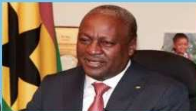
Le Président ghanéen John Mahama Dramani

ECONOMIE/ BAISSA A MINIMA DES PRIX DES PRODUITS PÉTROLIERS :