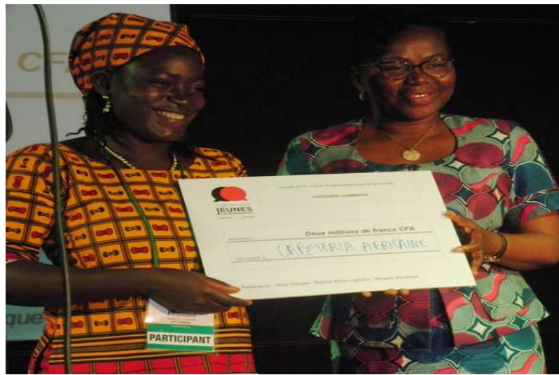
La ministre Dogbé (dte) remettant un prix à une lauréate

Axé sur l'approche des inventions, des ateliers, des tables rondes et des concours d'entrepreneurs sur les intérêts des jeunes togolais de moins de 35 ans, le forum est donc l'occasion pour ces jeunes de monter