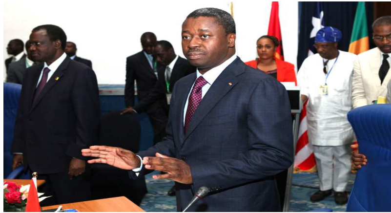
Le Président Faure Gnassingbé, à son arrivée.

Les chefs d'Etat de l'Afrique de l'Ouest ont procédé hier lundi 15 décembre 2014 à Abuja au lancement