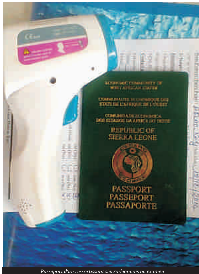
Passeport d'un ressortissant sierra-leonnais en examen

endroits, ils ne sont ni sensibilisés, ni outillés sur la maladie et les risques de contamination ou d'importation. Malheureusement, ce sont ces frontières que plusieurs passagers préfèrent utiliser soit par manque de moyens pour payer les policiers au niveau de la grande frontière, soit pour éviter que leur petit business soit saisi ou surtaxé. L'appel est donc lancé à l'Etat pour que des postes de contrôle sanitaires soient créés et multipliés afin de réduire au maximum les risques d'importation de cette épidémie. A la population, il est urgent de changer de comportement en adoptant les mesures préventives à savoir, se laver les mains au savon ou se désinfecter avec le gel hydro-