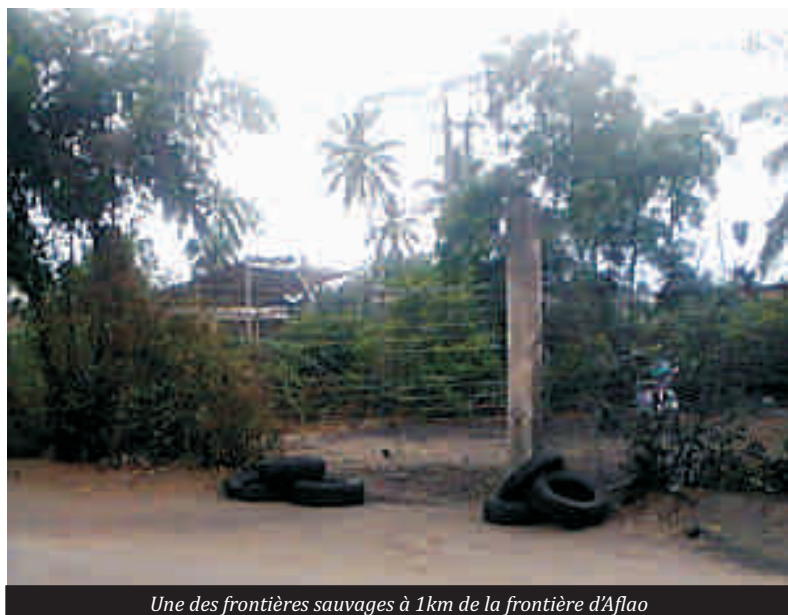
Une des frontières sauvages à 1km de la frontière d'Aflao

Les postes de contrôles sanitaires existaient bien avant l'apparition de l'épidémie. Ces postes servaient essentiellement au contrôle des cartes de vaccination contre la fièvre jaune, le choléra, etc. Avec la maladie à virus Ebola, ces postes ont été renforcés en termes de personnels formés, de matériels et de logistiques adéquats servant à isoler d'éventuels cas suspects. C'est le cas du poste de contrôle sanitaire Aflao-Kodjoviakopé de la frontière Togo-Ghana où il existe à côté du dispositif de lavage des mains, des thermo flash servant à prendre la