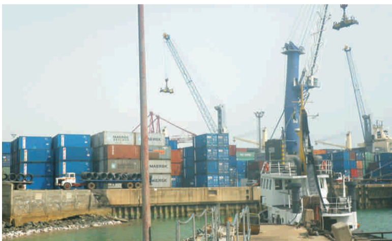
Une vue de quelques grues en activité

données et des documents par le réseau Internet de remplir rapidement toutes les formalités officielles liées à l'importation, à l'exportation et au transit.