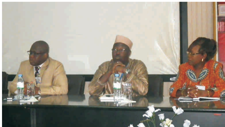
Quelques responsables du Port Autonome de Lomé

A toutes ces mesures est venu s'ajouter l'opérationnalisation du guichet unique pour le commerce extérieur (GUCE) en juillet dernier, et qui permet de nos jours aux acteurs impliqués dans le commerce et le transport (chargeurs, transitaires, consignataires), à partir de la centralisation des