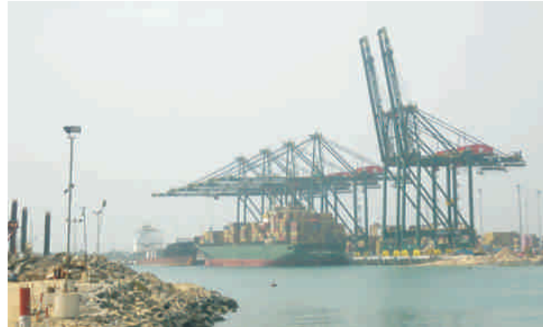
Autres installations au PAL

mesures qui s'inscrivent dans leur vision à court terme. Il s'agit de nouvelles infrastructures telles que la construction d'une darse qui servira à installer un nouveau terminal à conteneurs. Ce terminal sera d'une capacité équivalente à 900 000 conteneurs de 20 pieds à court terme avec un potentiel de développement estimé à 2,5 millions de conteneurs sur les 1050m de quai et pourra accueillir 3 à 4 navires simultanément, avec d'importantes surfaces de stockages de plus de 220.000m 2 . La darse aura un tirant d'eau de 16,60m, ce qui est supérieur à celui des installations actuelles. L'objectif vise à mettre en place un feeder service avec l'arrivée dans le port de Lomé de grands porteurs-conteneurs et le transbordement des conteneurs dans les pays de la sous région, du centre et du sud ouest, par des navires de petites capacités.