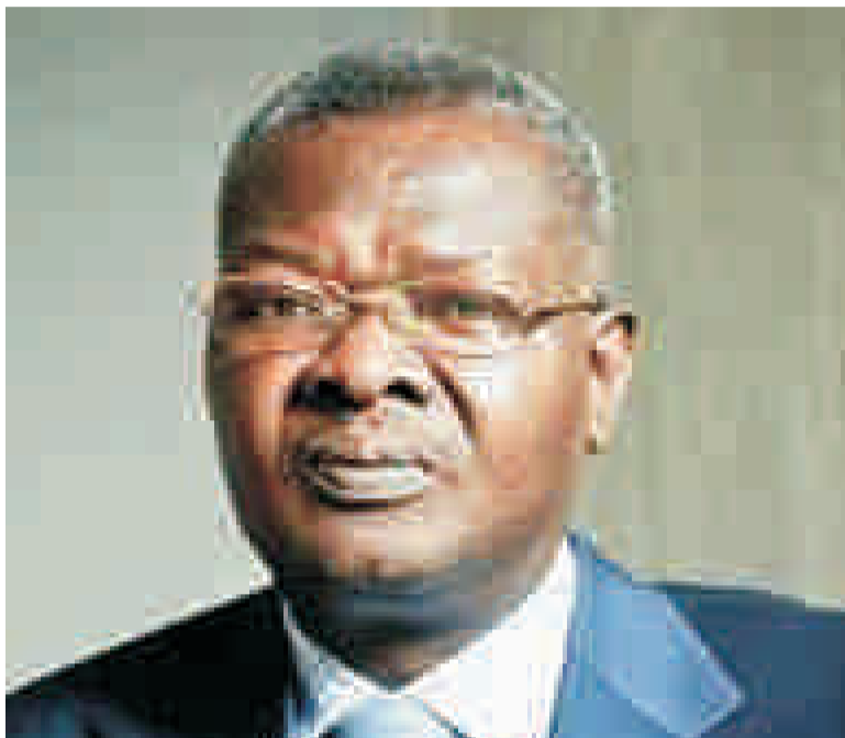
Agbéyomé Kodjo, président de OBUTS

S'agissant des commentaires qui font cours et qui parlent d'un rapprochement entre OBUTS et UNIR, du fait de l'avoir vu à la cérémonie d'inauguration du 3e quai, et à la présentation des vœux au chef de l'Etat, M. Agbéyomé laisse entendre que ce serait irresponsable de décliner l'invitation qui lui a été faite pour assister à la cérémonie d'inauguration du 3e quai, en tant qu'ancien directeur général du port autonome de Lomé, et en tant qu'ancien premier ministre de la république. Il dit avoir été heureux de retrouver le port et ceux avec qui il avait eu à