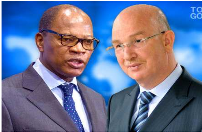
Mohamed Ibn Chambas (G) et Smaïl Chergui (dt)

Le Togo organisera en novembre 2015 à Lomé une conférence internationale sur la sécurité maritime en coopération avec l'Union africaine. De nombreux chefs d'Etat et de gouvernement y participeront ainsi que des experts en charge de la lutte