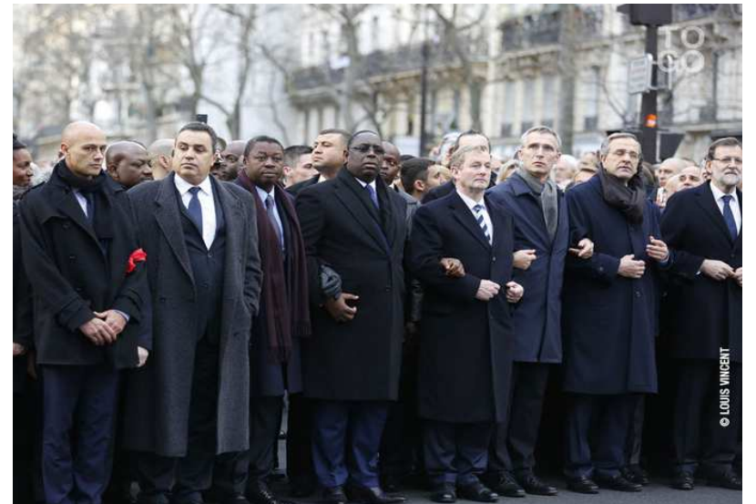
Faure Gnassingbé aux côtés de son homologue sénégalais, Macky Sall

tout le monde est touché, ressent la douleur du peuple français. Et pour moi qui ai vécu dans ce pays pendant plus de dix ans, j'ai compris que la France était touchée, qu'il y