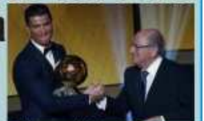
Cr7 (g) recevant le Ballon d'Or

Football : Cristiano Ronaldo remporte son 3ème ballon d'or P.1