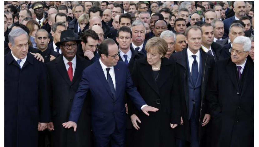
François Hollande entouré par des chefs d'Etats du monde venus soutenir la France

"Une telle violence, au seuil d'une nouvelle année, ne peut susciter qu'une réprobation totale", avait