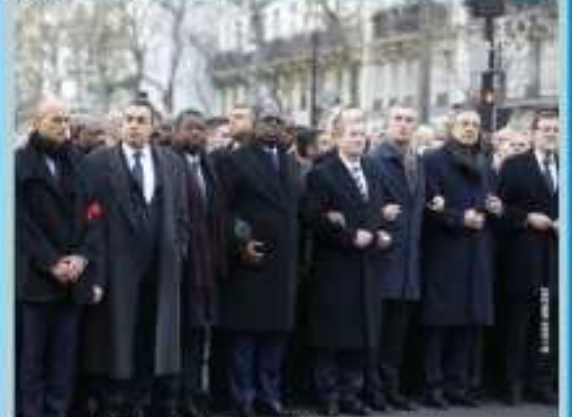
Faure et Macky Sall aux côtés du peuple français

ATTENTAT CONTRE CHARLIE HEBDO : Faure Gnassingbé aux côtés du peuple français PA