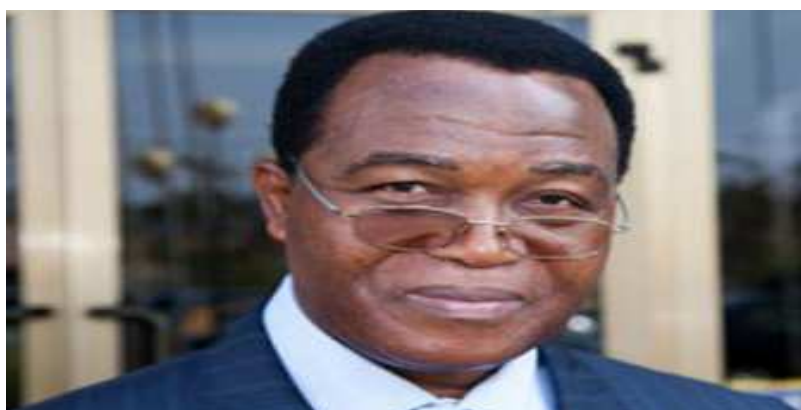
Kokou Biossey Tozoun, Pdt de la Plate-forme des régulateurs de l'Audiovisuel de l'UEMOA

Les participants se sont félicités de la mise en œuvre effective du processus de migration vers la Télévision Numérique Terrestre dans l'espace UEMOA et en Guinée. Ils se sont convenus d'adapter les législations nationales en matière de communication audiovisuelle au nouvel environnement numérique. Ils ont aussi encouragé la mise en œuvre, dans le cadre de la convergence des