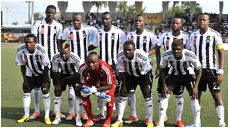
Le Tout Puissant Mazembe, club de D1 de la RDC

Le club qui dispose du plus grand contingent à la CAN est le Tout Puissant-Mazembe. le club congolais compte 8 internationaux à la CAN