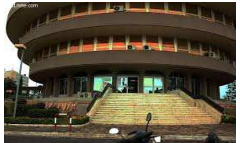
Le Trésor public

La durée de cession est de 182 jours, avec une valeur nominale unitaire de 1 million de francs et à taux multiples. L'échéance est donc fixée au mercredi 15 juillet 2015, indique le communiqué. Cette opération est