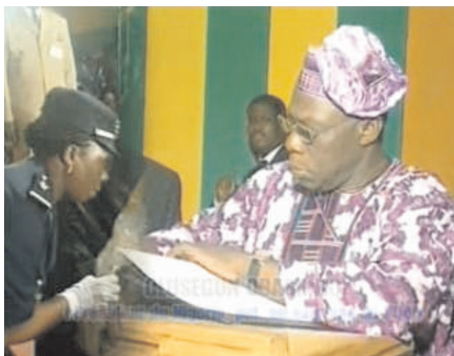
Le président Olusegun Obasanjo