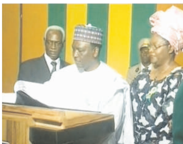
L'ex président nigerian Yacoubou Gowone