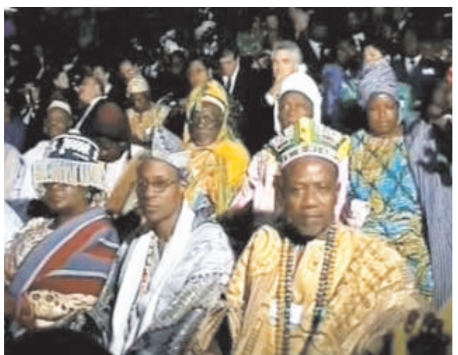
Le président Faure et la première dame