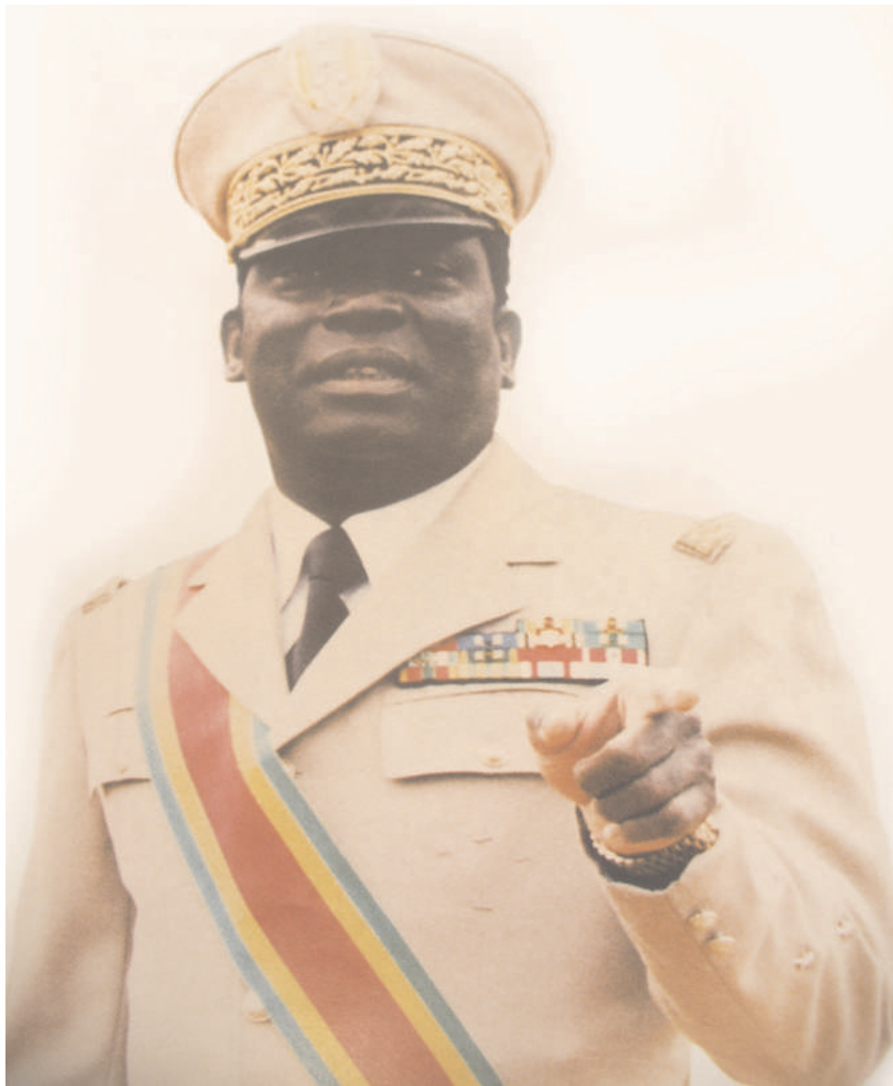
Idriss DEBY, Président du Tchad

« profondément touché » par la disparition d'Eyadema