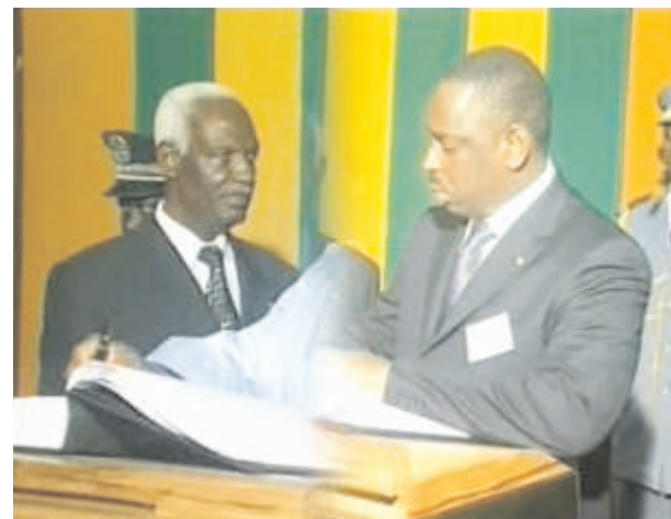
Macky Sall, premier ministre du Sénégal