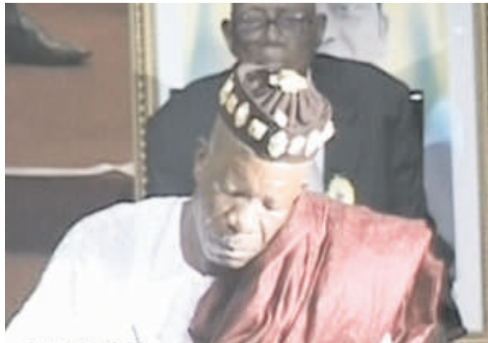
Le chef Agokoli