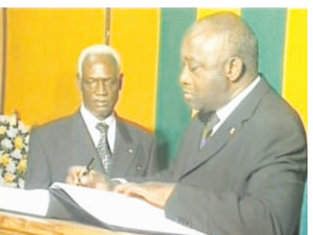
Le président Laurent Gbagbo de la Côte d'Ivoire