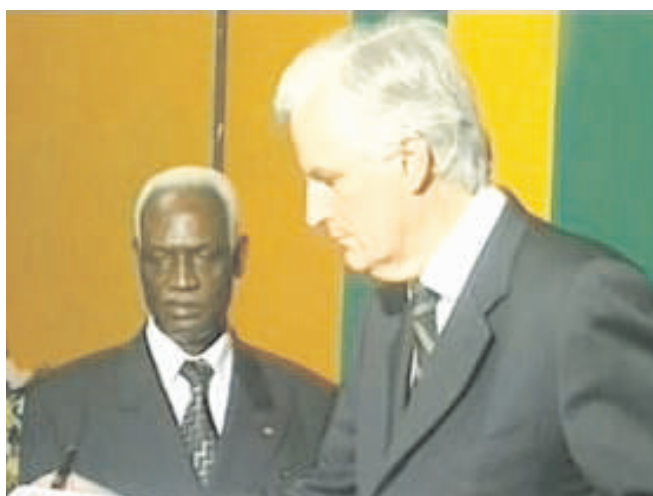
Le ministre Michel Barnier, représentant le pdt français