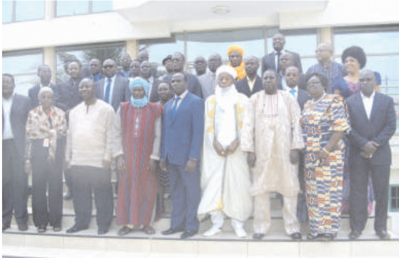
Photo de famille des Experts

Dans le cadre de la 5e réunion statutaire des ministres de la Communauté Economique des Etats de l'Afrique de l'Ouest (CEDEAO) qui se tient les 29 et 30 janvier au Togo, le comité technique des experts de cette institution s'est réuni du 27 au 29 janvier dernier. Cette rencontre leur a permis d'examiner les rapports que