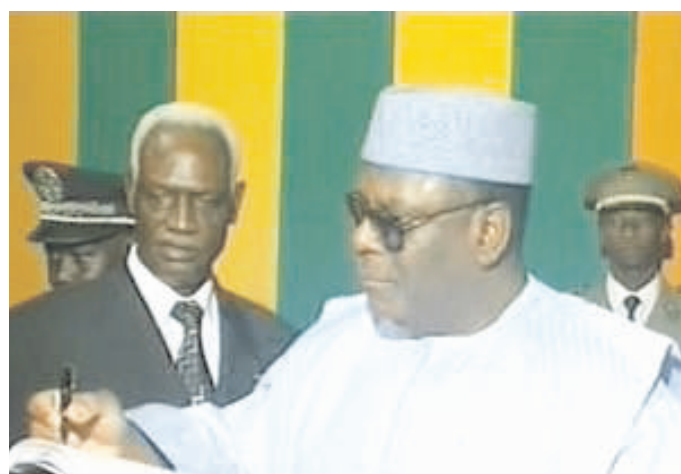
IBK, président de l'Assemblée Nationale du Mali