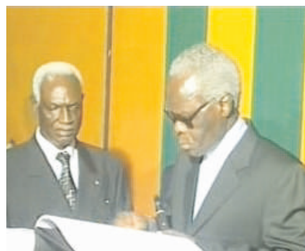
Le président Mathieu Kerekou