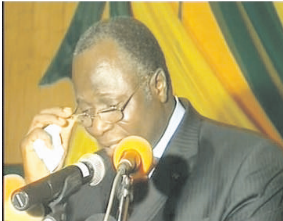
Le Premier ministre togolais Koffi SAMA inconsolable

« Le Président Eyadema était un véritable ami d'Israël et des Juifs. Durant son mandat, il a