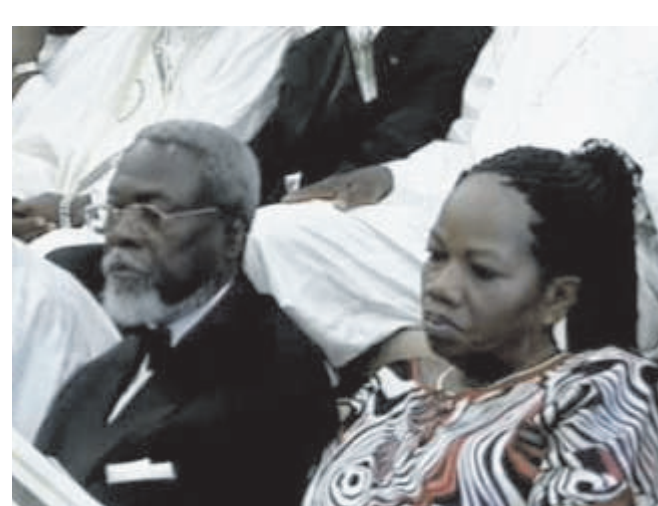
Le président Ange Félix Patassé