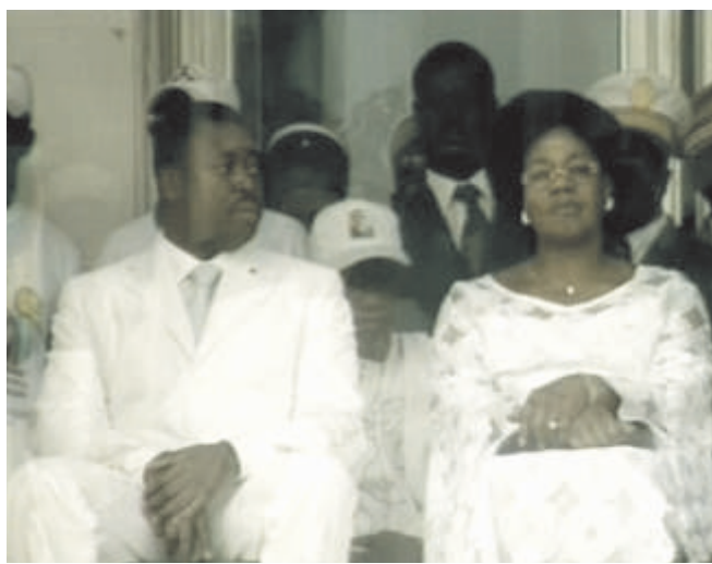
Le président Faure et la première dame