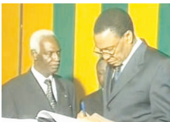
Le président Mamadou Tandja du Niger