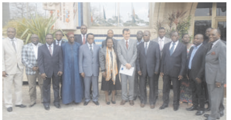
Photo de famille à l'issue de la cérémonie d'ouverture