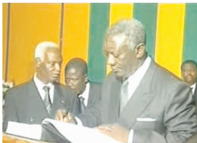
Le président John Kufuor du Ghana