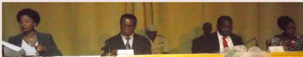
La table d'honneur au lancement des activités de la MUAJ-Togo

Journalistes et artistes désormais unis par une mutuelle P.4