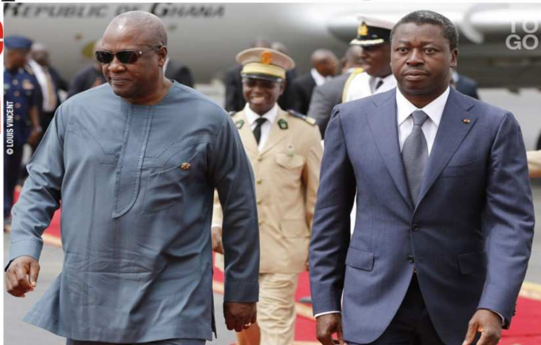
Les Présidents John Dramani Mahama (g) et Faure Gnassingbé (dt)

Probable report de 10 jours du scrutin pour satisfaire les desiderata de Jean-Pierre Fabre