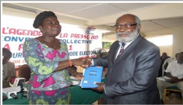
Remise officielle de l'Agenda de la presse 2015

L'Union des Journalistes Indépendants du Togo (UJIT) a procédé le 19 mars dernier à la Maison de la presse au lancement officiel de l'agenda de presse 2015 en collaboration avec la fondation Friedrich Ebert Stiftung (FES). La cérémonie couplée au lancement du club de la presse N°1 de l'année a été placée sous le thème " Médias et conventions collectives "