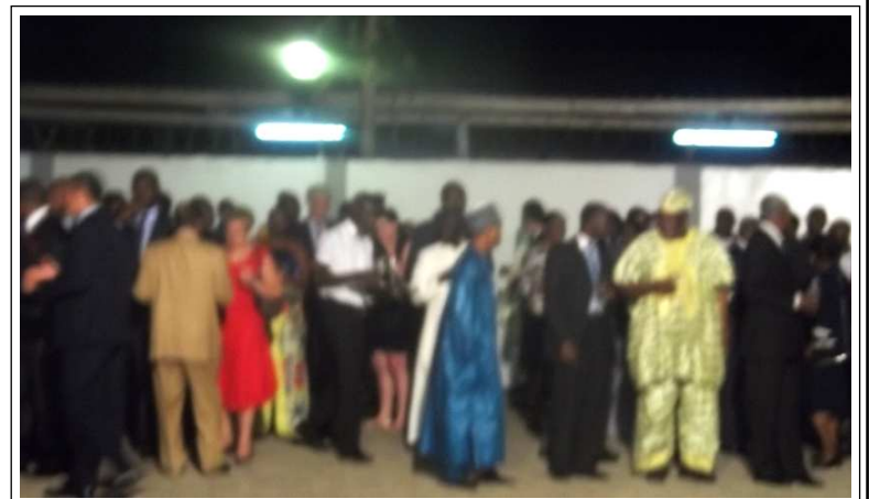
Les convives au cours de la soirée apothéose au BRAO à Lomé

Selon la Secrétaire Générale de l'OIF, "...Ce que nous fêtons, c'est notre volonté à vivre ensemble, c'est notre volonté d'assurer ensemble notre destin commun, de préserver ensemble les biens communs de l'humanité, de gérer ensemble notre cadre commun, de construire ensemble notre environnement commun. ". Elle a, pour finir, invité le monde entier, à l'occasion de cette journée, à former " dans nos esprits et dans nos cœurs,