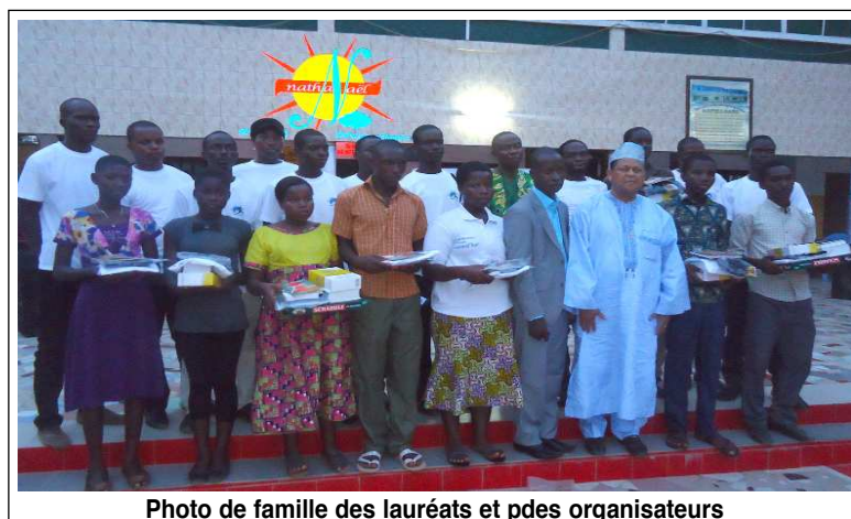
Photo de famille des lauréats et pdes organisateurs

Au terme de ces épreuves, les meilleurs élèves de chaque catégorie ont été primés. C'était le 21 mars dernier à Lomé, en