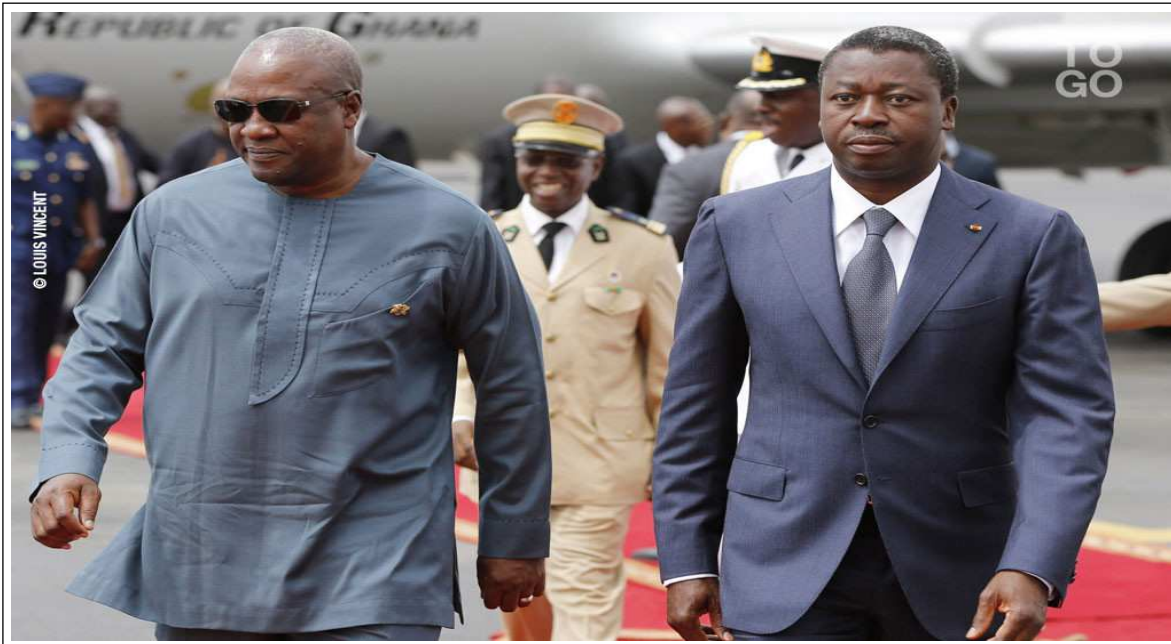
Les Présidents John Dramani Mahama (g) et Faure Gnassingbé (dt)

Il a, par ailleurs, exhorté l'ensemble de la classe politique à apporter tout son concours, dans un esprit républicain pour le succès de la prochaine élection présidentielle. Face à certaines réclamations du CAP2015