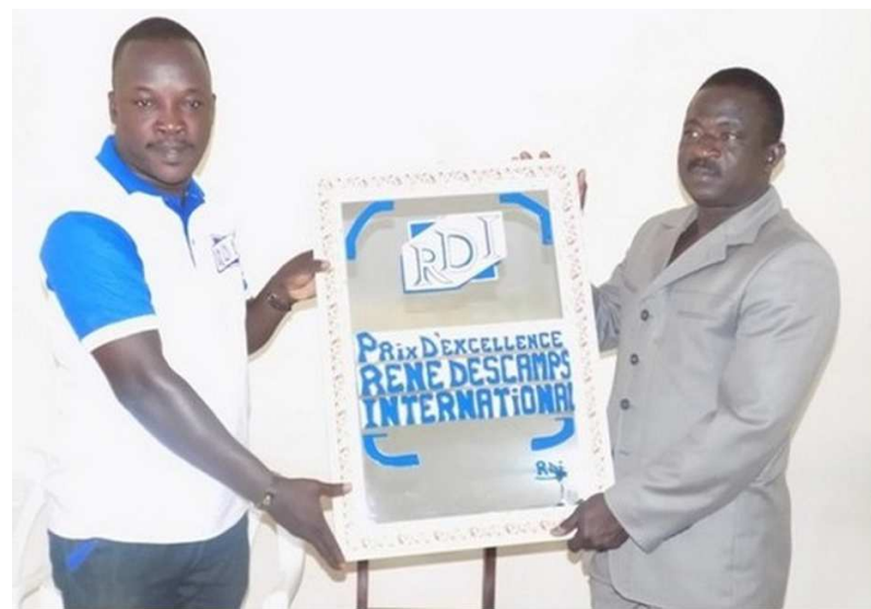
Remise du Prix d'Excellence au Préfet de Dankpen (dt)