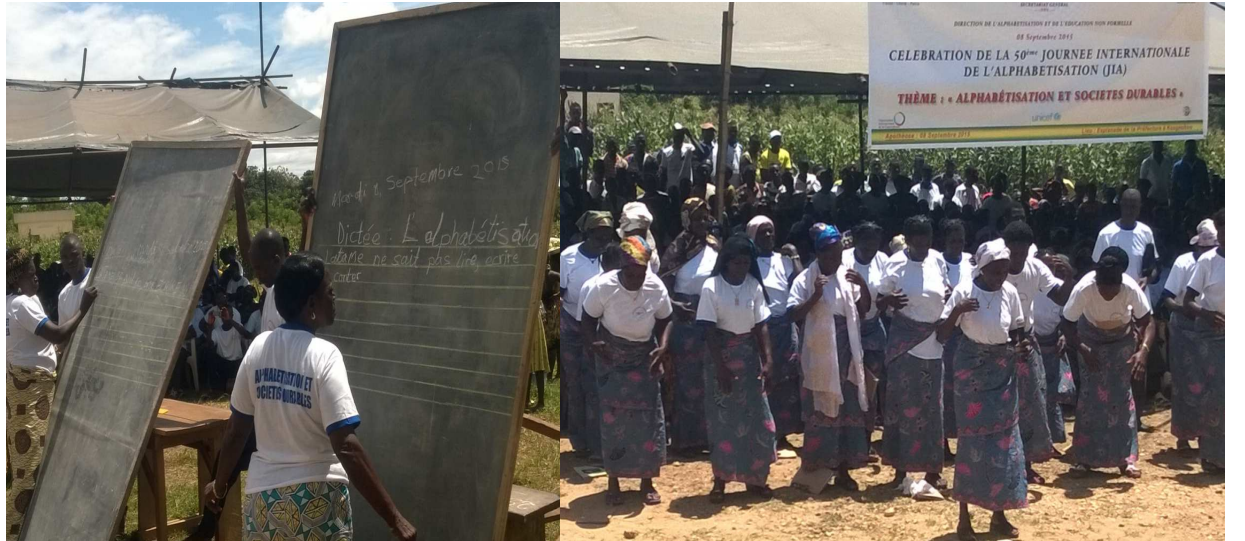
Une démonstration de dictée....

Instituée en 1965 par l'Organisation des Nations Unies pour l'Education, la Science et la