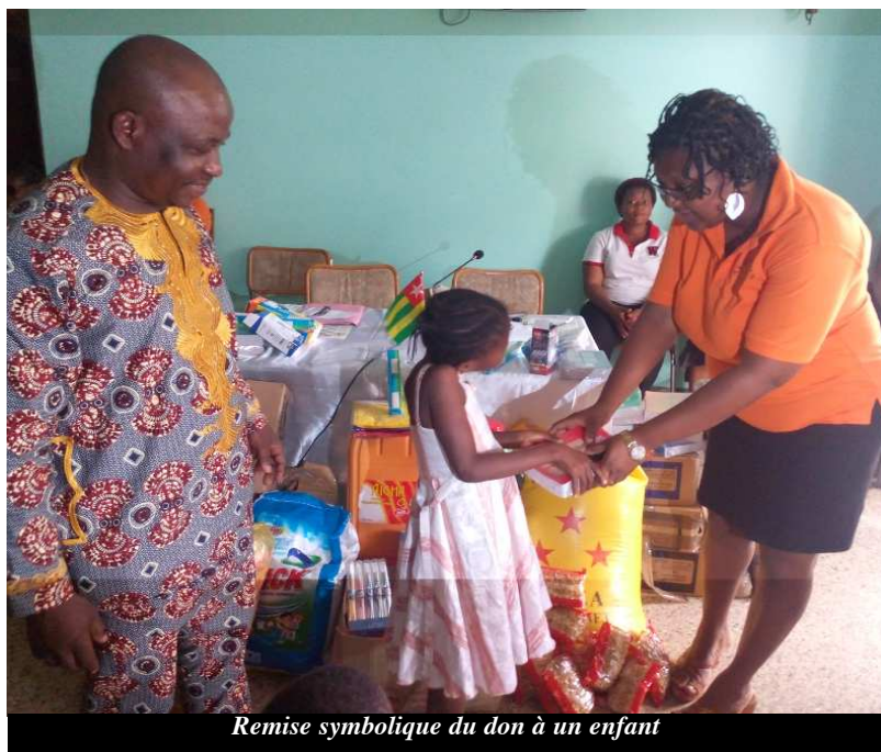
Remise symbolique du don à un enfant

L'ONG M.E.D a pour but de créer au Togo et partout où besoin sera, un réseau de promotion de la prise en charge, de la scolarisation des orphelins, des enfants de la rue, des enfants vulnérables et le développement socio-économique sans pour autant exclure la santé.