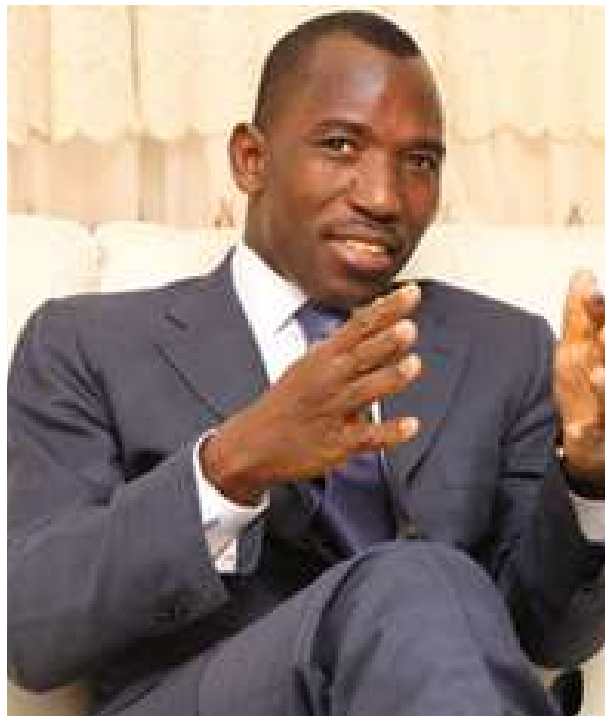
Le ministre Gilbert Bawara

Cette année, tout porte à croire que des mesures sont en train d'être prises pour rompre avec ces années scolaires perturbées. En effet, le 29 juillet dernier, suite à une rencontre entre le ministre actuel des enseignements primaire et secondaire et les fédérations des syndicats de l'enseignement à savoir FE / CNTT, FENASYET, FESEN, FESET,