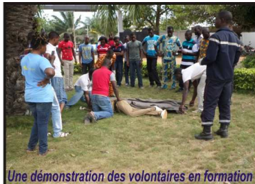
Une démonstration des volontaires en formation