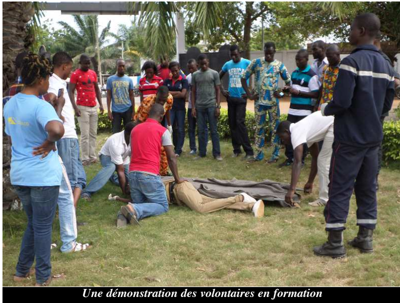
Une démonstration des volontaires en formation

De nos jours, il urge pour tout Etat, de disposer d'un nombre important de " bénévoles secouristes ", afin de porter assistance à autrui, notamment lors des catastrophes majeures. Le Togo est en bonne voie et des secouristes volontaires sont en formation depuis ce matin sur les principes généraux du secourisme à la caserne des sapeurs-pompiers de Lomé. Au total 20 volontaires prennent part à cette formation ; la première étant passée du 25 au 29 août dernier.