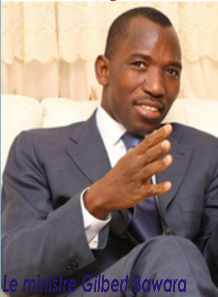
Le ministre Gilbert Bawara

Le Mali s'inspire de l'expérience de la finance inclusive du Togo