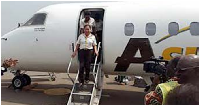
Une équipe d'ASKY

Créée par les institutions régionales : la Banque d'Investissement et de Développement de la CEDEAO (BIDC), la Banque Ouest Africaine de