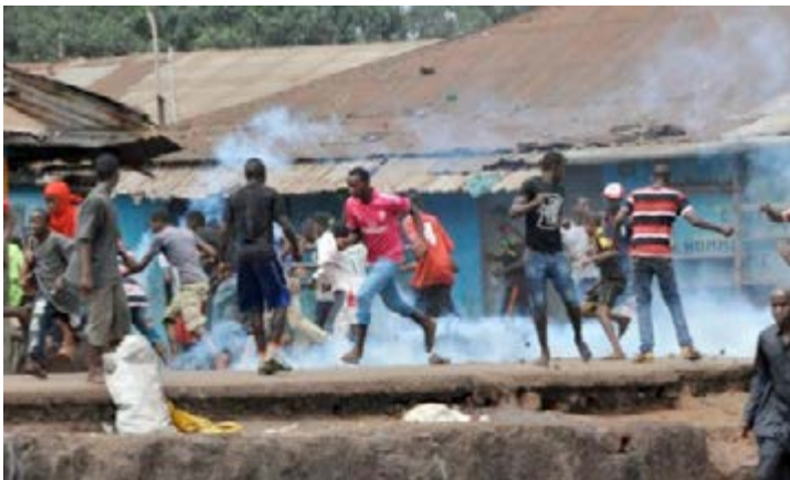
Vue de la scène

De violents affrontements ont éclaté vendredi 02 et samedi 03 octobre, entre militants du parti au pouvoir, le RPG Arc-en-ciel, et ceux de l'Union des forces démocratiques de Guinée (UFDG, opposition). Bilan : au moins 17 blessés, dont 14 par balles.