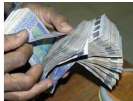
Liasse de billets du franc CFA

Les ministres des finances, les gouverneurs des Banques centrales et les présidents des institutions régionales de la zone franc se sont réunis vendredi 02 octobre 2015 à Paris-Bercy, sous la présidence de Michel Sapin, ministre des Finances et des Comptes publics. Au centre du débat, l'épineuse question du franc CFA.