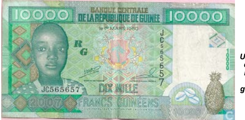
Un billet de dix mille franc guinéen

Après les nouvelles coupures de 20 000 et de 5000 francs guinéens, la Banque Centrale de la République de Guinée (BCRG) a annoncé mercredi 30 septembre, l'émission dès le 5 octobre prochain, d'un nouveau billet de 1000 GNF.