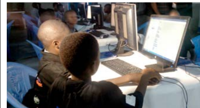
Initiation de certains élèves

Le programme « Africa Code Week » a été lancé le jeudi 1er octobre au centre Blue Zone à Lomé par la ministre des Postes et de l'Economie numérique ainsi que celui des enseignements primaire, secondaire et de la formation professionnelle. Pour ce programme 5000 élèves au Togo seront formés sur toute l'étendue du territoire national.