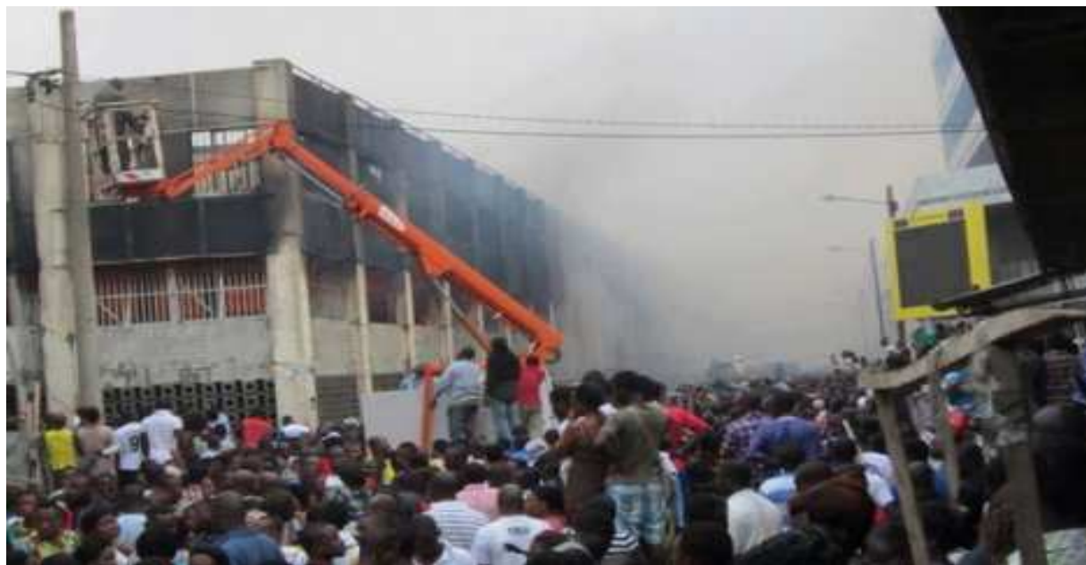
Le bâtiment central du Grand marché de Lomé envahi par les flammes la nuit du 12 au 13 janvier 2013

Au moment de ces fameuses incendies que les Togolais ne cesse-