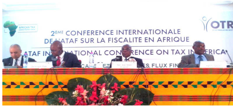
La table d'honneur lors à l'ouverture des travaux

Les buts pour lesquels le forum sur l'administration Fiscale africaine a été créé sont entre autres de jeter une base solide pour une nouvelle approche concernant la fiscalité africaine, le renforcement de l'Etat et le développement des capacités ; créer