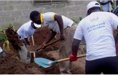
Des cadres d'Ecobank, pèles en mains

ECOBANK OFFRE DE BÂTIMENTS SCOLAIRES À TCHIMEDÉ