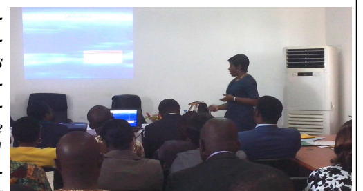
Vue partielle des participants

LE SYNDICAT national des banques, assurances et établissements financiers du Togo (SYNBANK) a initié une formation ce 22 octobre 2015, qui a pour thème " le synbank face à la sensibilisation de ses membres " au profit de ses membres.