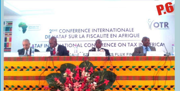
La table d'honneur à l'ouverture des travaux

OFFICIE TOGOLAIS DES RECETTES (OTR) : La seconde conférence internationale de l'ATAF sur la fiscalité en Afrique P.6