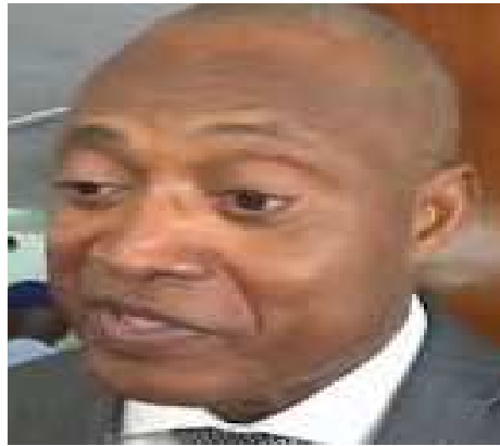
Jean-Pierre Fabre, Pdt ANC

LE POUVOIR de Faure Gnassingbé a-t-il peur d'organiser des élections locales ? C'est en tout cas ce que pensent les responsables de l'Alliance nationale pour le changement (ANC), parti de l'opposition togolaise dirigé par Jean-Pierre Fabre.