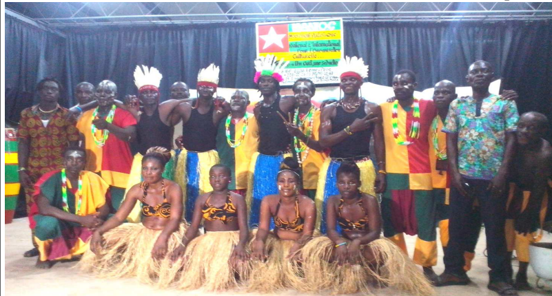
Le groupe de ballet MANIOC