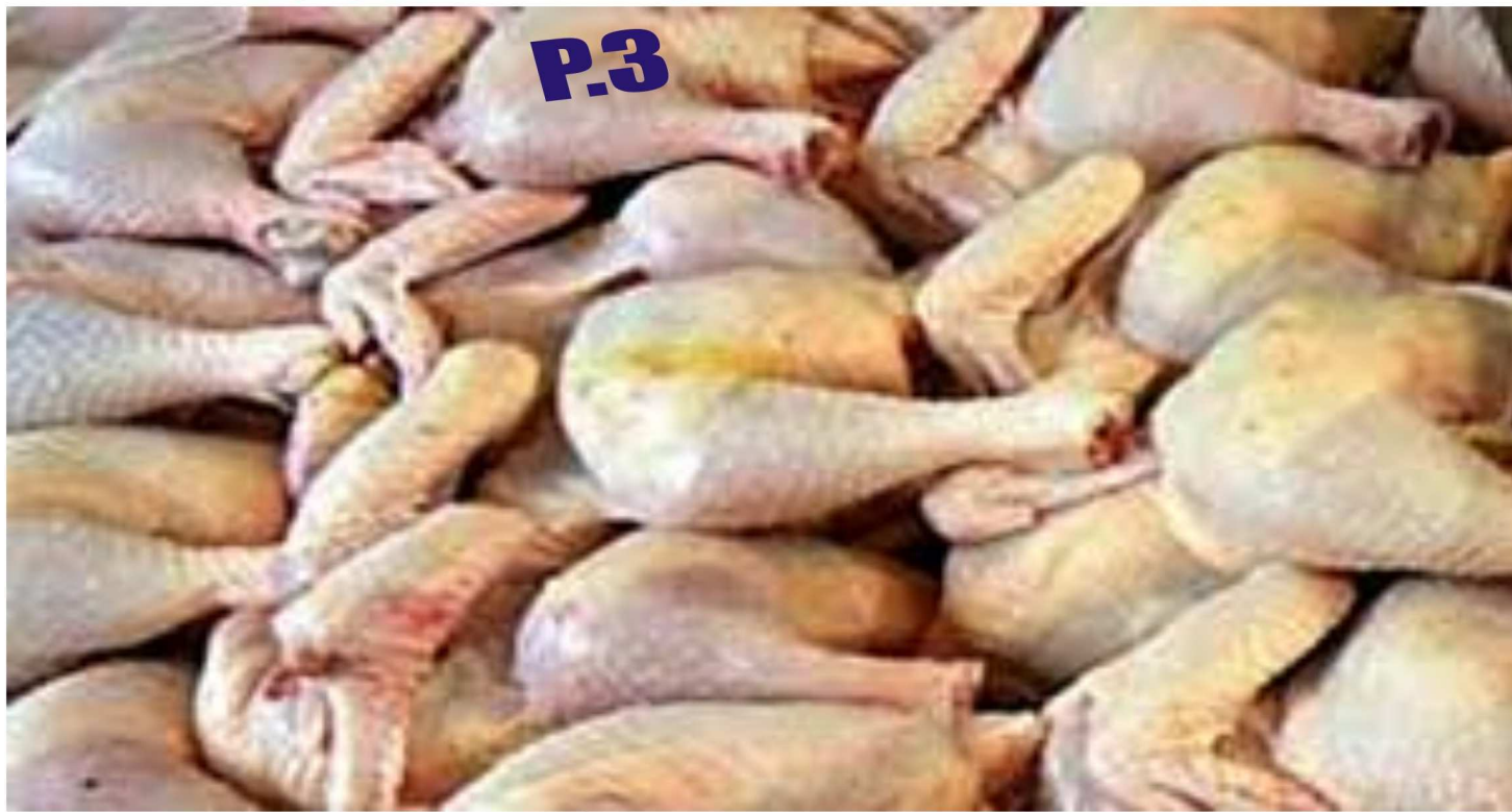
Des produits (poulets et ailerons) congelés