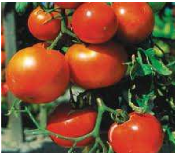
Tomate ronde, plus forte hausse (+21,2%)

S'agissant de la fonction de consommation "Santé", c'est le poste "Médicaments traditionnels" (-10,5%) qui a influencé la baisse de l'indice. En ce qui concerne la fonction de consommation "Logement, eau, gaz, électricité et autres combustibles", la baisse observée est l'œuvre du poste "Combustibles solides et autres" (-3,1%).