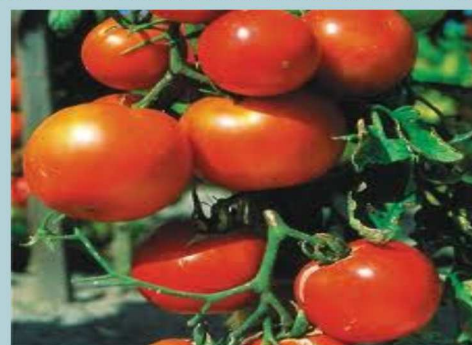
Tomate ronde, plus forte hausse (+21,2%)

ECONOMIE / CONSOMMATION : Baisse de 0,5% du niveau général des prix à la consommation au mois d'Octobre