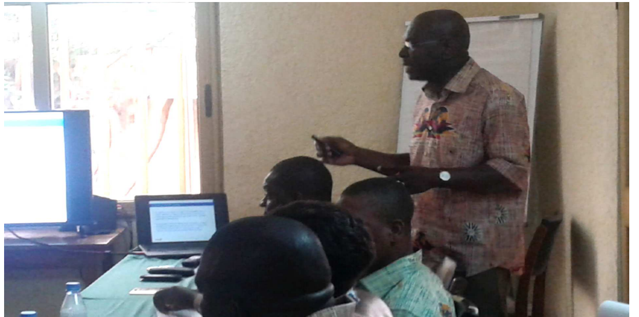
Vue partielle de l'assistance lors de la conférence de presse

Plus loin, ils affirment que " les campagnes de vaccination ont prouvé leur efficacité, approchant pas à pas de l'éradication totale de cette maladie, mais, malgré les grands moyens mis en