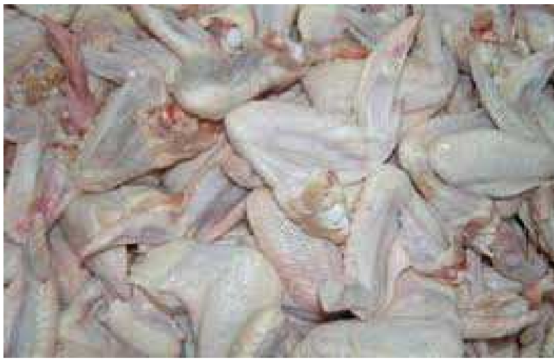
Des ailerons de poulets congelés

Dans une correspondance du Ministre de l'Economie, des Finances et de la Planification du Développement N°2268/MEFPD/CAB/CJ du 07 Aout 2015 avec pour objet " L'arrêté interministériel N°037/14/MAEP/MEF/MCPSP du 20 juin 2014 ", Le Ministre Adji Otèth AYASSOR écrivait ceci à son collègue Colonel Ministre de l'Agriculture, de l'Elevage et de