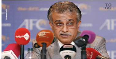
Cheikh Salman ben Ibrahim al Khalifa

Le candidat à la présidence de la FIFA, le bahreïni Cheikh Salman ben Ibrahim al Khalifa dément avoir été impliqué dans l'affaire de la venue d'une fausse équipe des Eperviers à l'époque où il dirigeait la Fédération nationale de football (BFA).