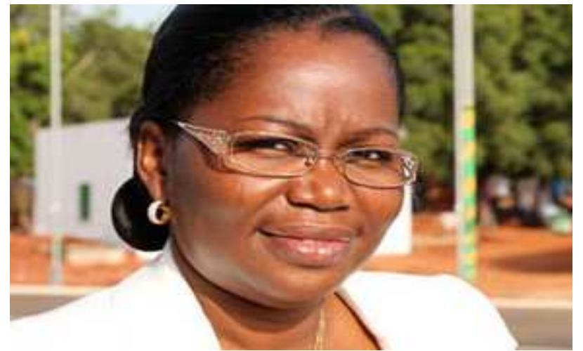
Mme Victoire Tomégah-Dogbé, ministre du Développement à la Base

Selon la ministre, si globalement les produits du FNFI ont déjà permis d'atteindre 600.000 personnes, avec en 2015, 8.000 pour AJSEF, 80.000 pour AGRISEF, les réalités dans les différentes régions et préfectures ne sont pas les mêmes.