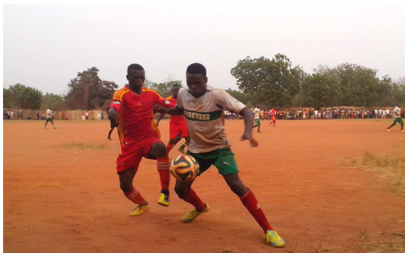
Une phase de jeu du match d'ouverture

"Nous voulons que le tournoi soit déroulé dans une bonne condition