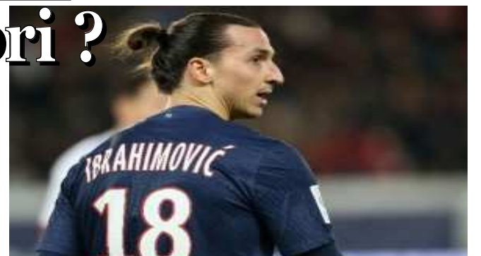
Zlatan Ibrahimovic, l'espoir des Parisiens

Une maxime veut que "l'attaque fait lever les foules et la défense gagner les titres". Le PSG va devoir la faire mentir puisque sur l'ensemble de ses participations en Ligue des Champions, le club de la capitale a (un peu) plus marqué que Chelsea, avec une moyenne de 1,76 réalisation par rencontre contre 1,70. En revanche, Paris encaisse 1,12 but par match contre 0,84 pour le club de Londres. Mais Paris tire son épingle du jeu cette année où il a inversé la tendance. Le PSG a moins marqué que Chelsea, 12 réalisations contre 13 en six matchs, mais n'a concédé qu'un seul but et c'était face au Real Madrid sur une bourde de Trapp. Les filets des Blues ont tremblé trois